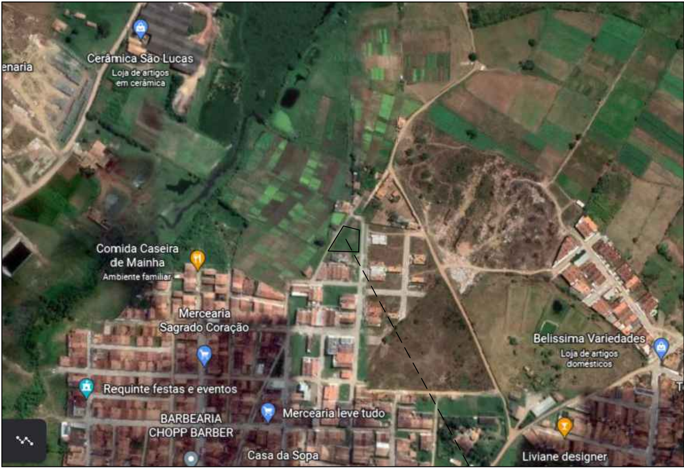
U.B.S. TIPO I - BAIRRO MARCELA