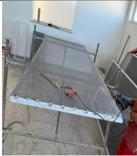
Figura 08: Montagem das esquadria de chapa de aço perfurada.