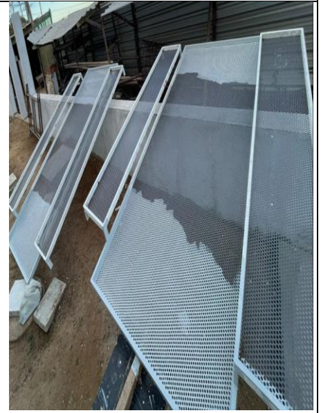
Figura 15: Pintura das esquadria de chapa de aço perfurada.