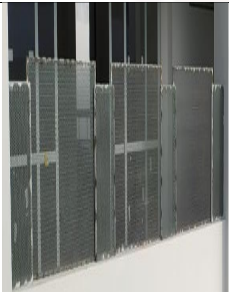
Figura 16: Fixação das esquadria de chapa de aço perfurada.