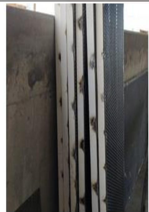
Figura 04: Montagem das esquadria de chapa de aço perfurada.