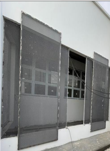
Figura 10: Fixação das esquadrias de chapa de aço perfurada.