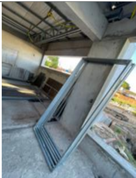
Figura 01: Montagem de quadros em metalon para as chapas perfuradas.