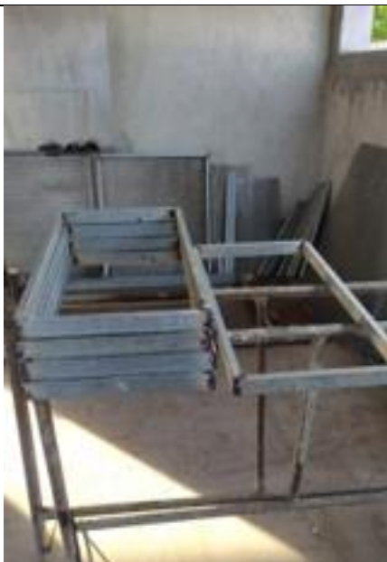
Figura 02: Montagem de quadros em metalon para as chapas perfuradas .