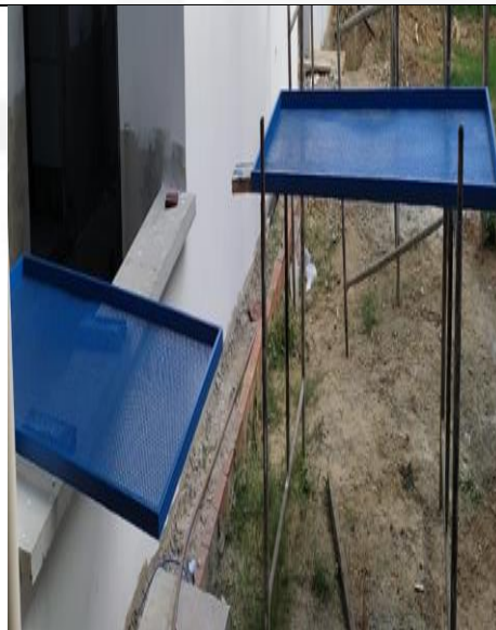
Figura 17: Pintura das esquadria de chapa de aço perfurada.