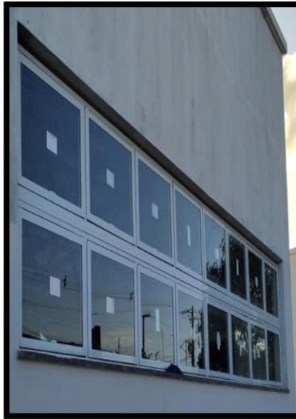
Figura 20: Fixação de vidro na esquadria.