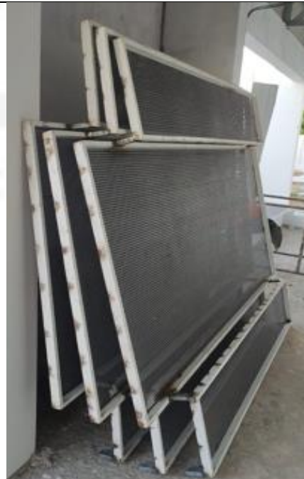
Figura 05: Montagem das esquadrias de chapa de aço perfurada.