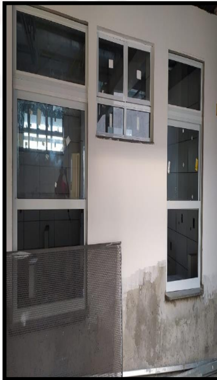
Figura 23: Fixação de vidro na esquadrias.