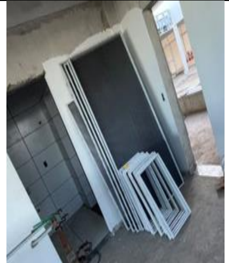
Figura 09: Pintura dos quadros da esquadria de chapa de aço perfurada.