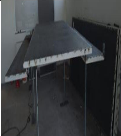
Figura 07: Montagem das esquadrias de chapa de aço perfurada.