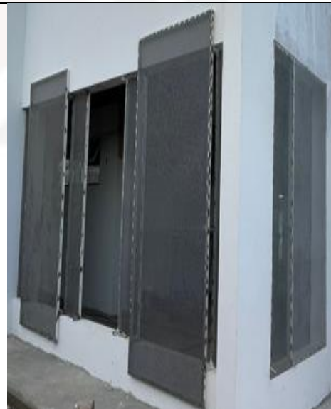
Figura 11: Fixação das esquadrias de chapa de aço perfurada.