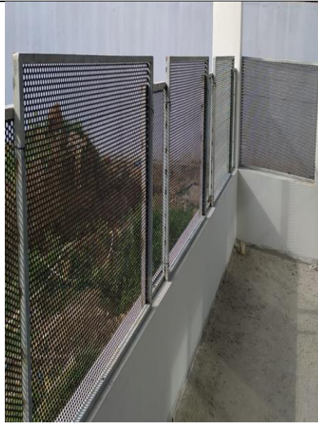
Figura 14: Fixação das esquadria de chapa de aço perfurada.