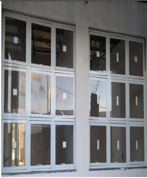
Figura 19: Fixação de vidro na esquadria.