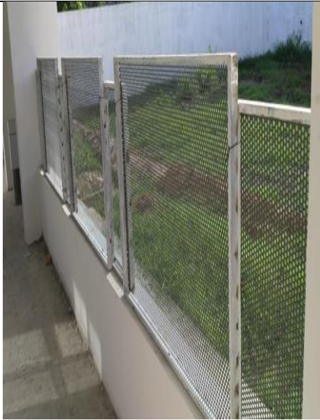
Figura 13: Fixação das esquadria de chapa de aço perfurada.