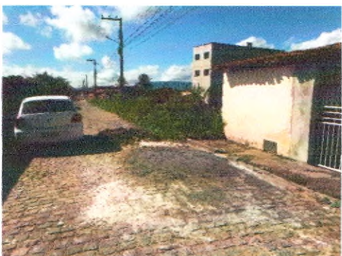
RUA ARIVALDO ALVES CORREIA