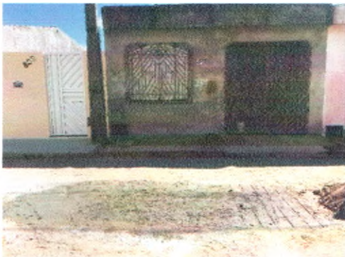
TRAVESSA JOSEFA CORDÉLIA DE GOIS