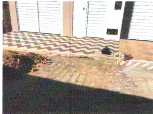
RUA ARIVALDO ALVES CORREIA