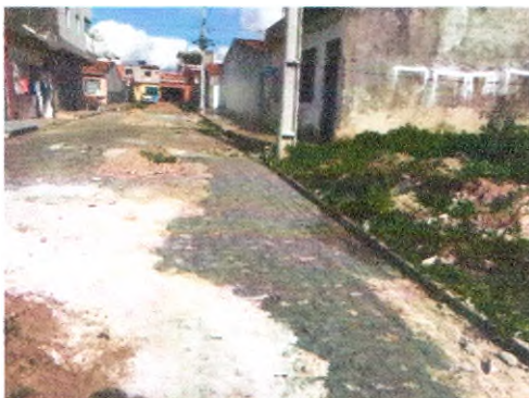
TRAVESSA TERCICIO BISPO