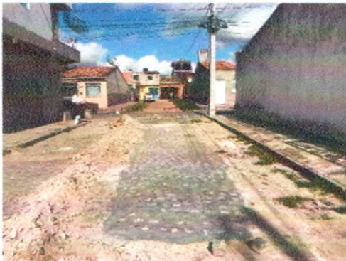
TRAVESSA TERCICIO BISPO