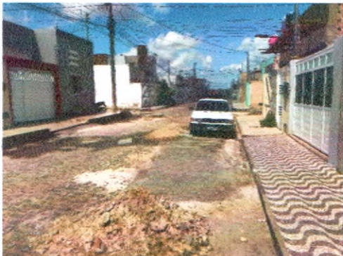
RUA JOSEFA ADALULA NORONHA