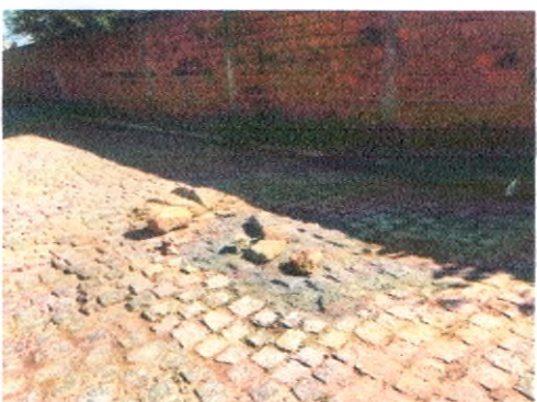
RUA ARIVALDO ALVES CORREIA