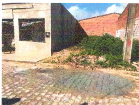
RUA ARIVALDO ALVES CORREIA