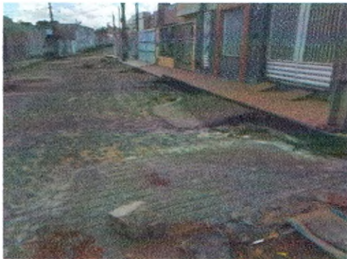
RUA ERCÍLIA COSTA DE OLIVEIRA