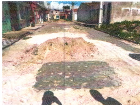
TRAVESSA TERCICIO BISPO