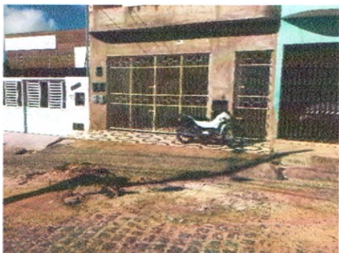
RUA JOSÉ FERREIRA LIMA

OBRA: RECUPERAÇÃO DE PAVIMENTAÇÃO A PARALELEPÍPEDO DE RUAS NO MUNICÍPIO – CONTRATO: 096/2021 BOLETIM DE MEDIÇÃO: 17/2022