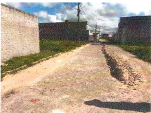
RUA HELENO LUIZ DA SILVA