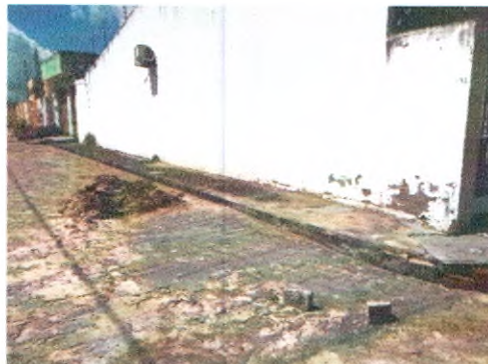
RUA JOSEFA ADALULA NORONHA