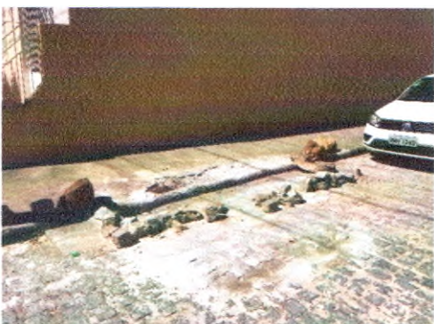
TRAVESSA ANTONIO ALVES DOS SANTOS