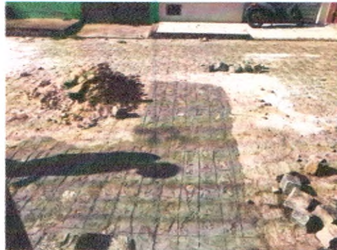
TRAVESSA TERCICIO BISPO