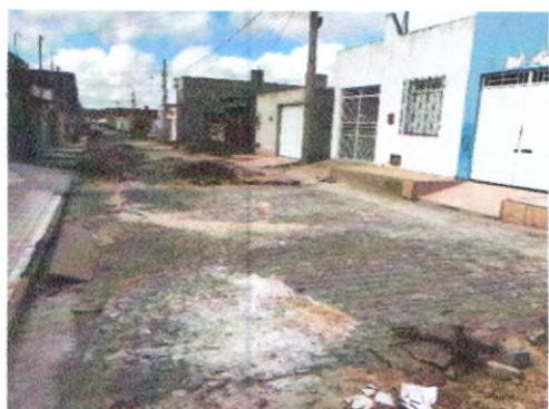
RUA HELENO LUIZ DA SILVA