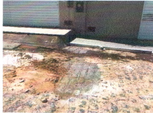
RUA JOSEFA ADALULA NORONHA