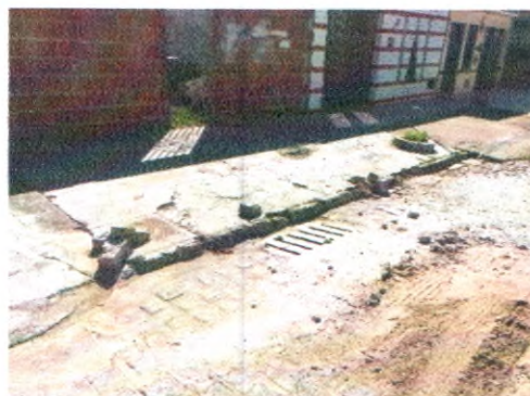
RUA SÃO JOÃO