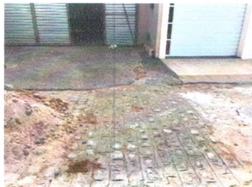
RUA HELENO LUIZ DA SILVA