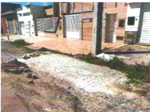
RUA SÃO JOÃO