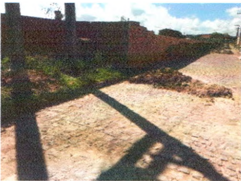
RUA ARIVALDO ALVES CORREIA