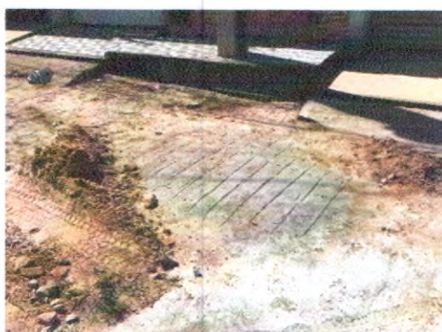
RUA JOSEFA ADALULA NORONHA