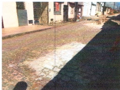
RUA ARIVALDO ALVES CORREIA