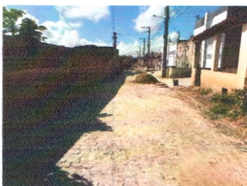
RUA ARIVALDO ALVES CORREIA

PAULO CESAR LIMA Assinado de forma digital por PAULO CESAR LIMA JUNIOR:06524886500 Dados: 2022.05.13 10:00:03 -03'00'