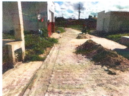
RUA JOÃO PEREIRA DA SILVA