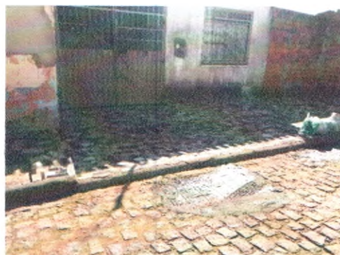
RUA ARIVALDO ALVES CORREIA