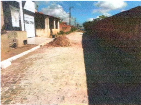
RUA ARIVALDO ALVES CORREIA