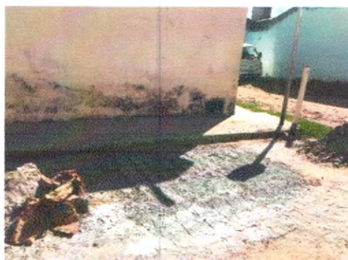
TRAVESSA JOSEFA CORDÉLIA DE GOIS