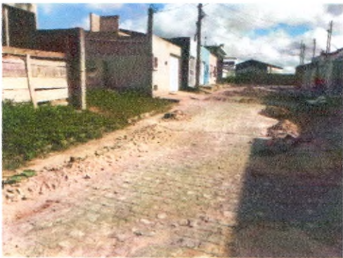
RUA HELENO LUIZ DA SILVA