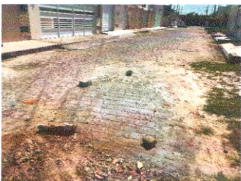
RUA JOSEFA ADALULA NORONHA