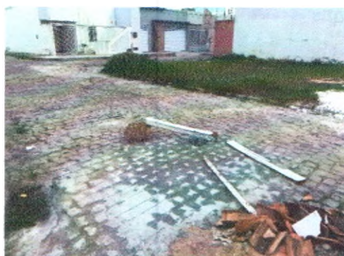
RUA ERCÍLIA COSTA DE OLIVEIRA