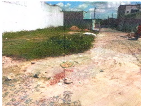
RUA ERCÍLIA COSTA DE OLIVEIRA