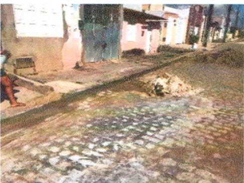
RUA ARIVALDO ALVES CORREIA