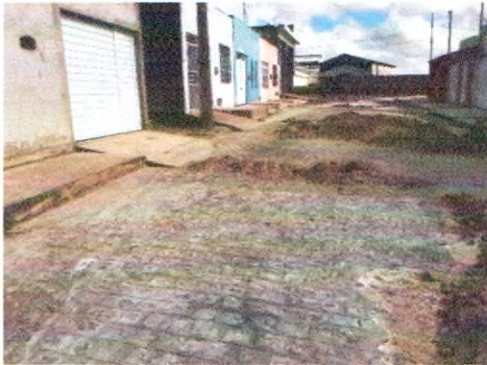
RUA HELENO LUIZ DA SILVA