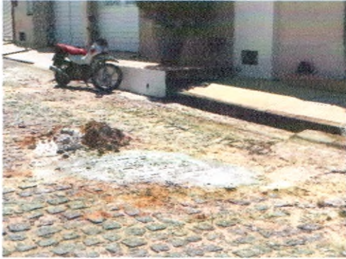
RUA JOSEFA ADALULA NORONHA