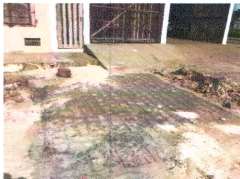
RUA HELENO LUIZ DA SILVA