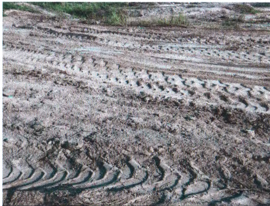
LIMPEZA MECANIZADA DO TERRENO