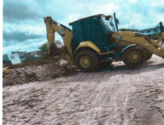
LIMPEZA MECANIZADA DO TERRENO; MATERIAL PARA SUB-BASE