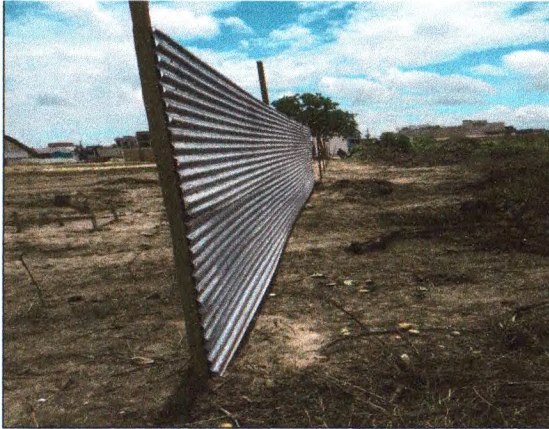
FECHAMENTO COM TAPUME EM TELHA DE AÇO