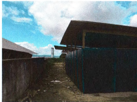
EXECUÇÃO DO BARRACÃO DE APOIO À PRODUÇÃO