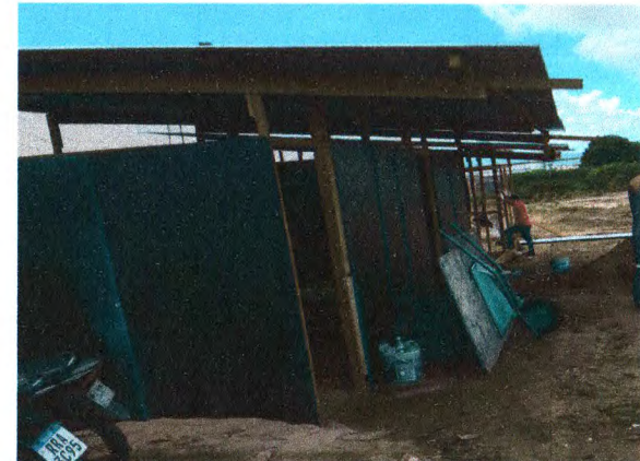
EXECUÇÃO DO BARRACÃO DE APOIO À PRODUÇÃO