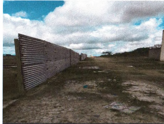
FECHAMENTO COM TAPUME EM TELHA DE AÇO