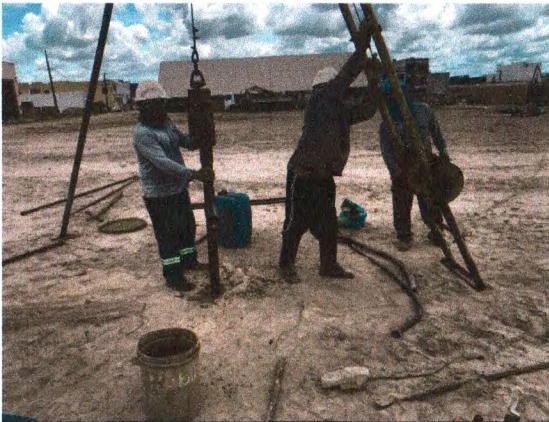
EXECUÇÃO DA SONDAGEM À PERCUSSÃO