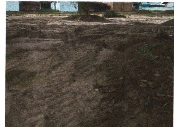
LIMPEZA MECANIZADA DO TERRENO; MATERIAL PARA SUB-BASE