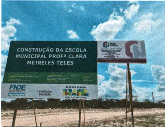
PLACA DA OBRA