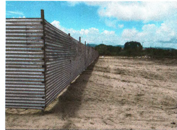
FECHAMENTO COM TAPUME EM TELHA DE AÇO