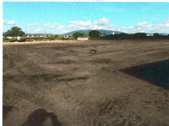
LIMPEZA MECANIZADA DO TERRENO