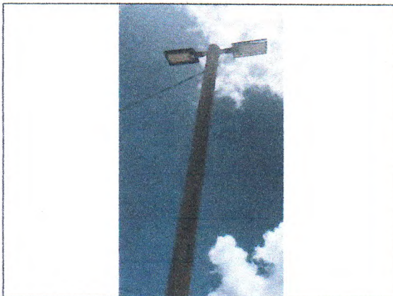
Poste e Luminárias LED