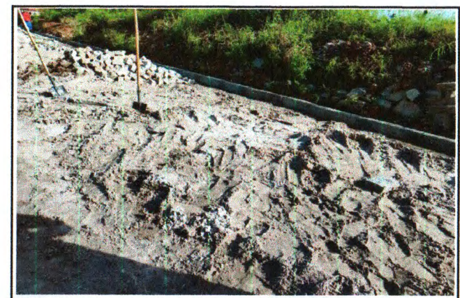
PAVIMENTAÇÃO DO TRECHO 02