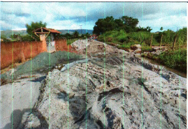
PAVIMENTAÇÃO DO TRECHO 02