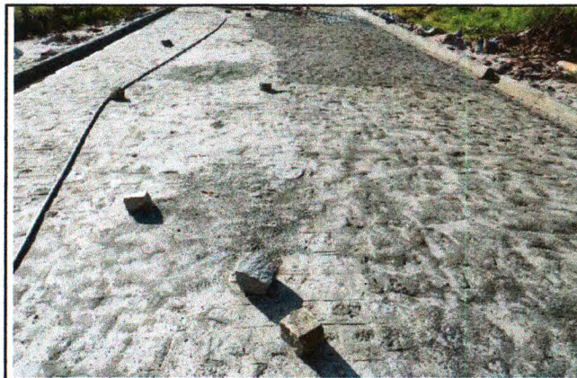
PAVIMENTAÇÃO DO TRECHO 02