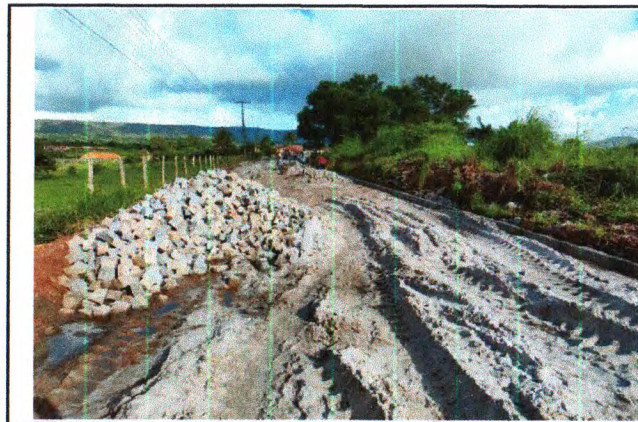
PAVIMENTAÇÃO DO TRECHO 02