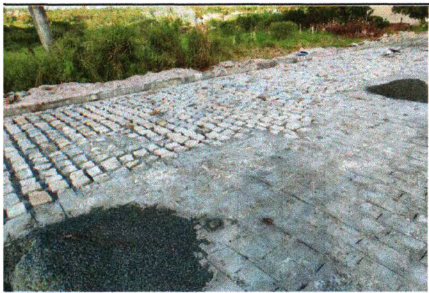
PAVIMENTAÇÃO DO TRECHO 02