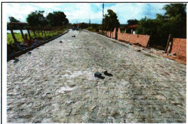
PAVIMENTAÇÃO DO TRECHO 02