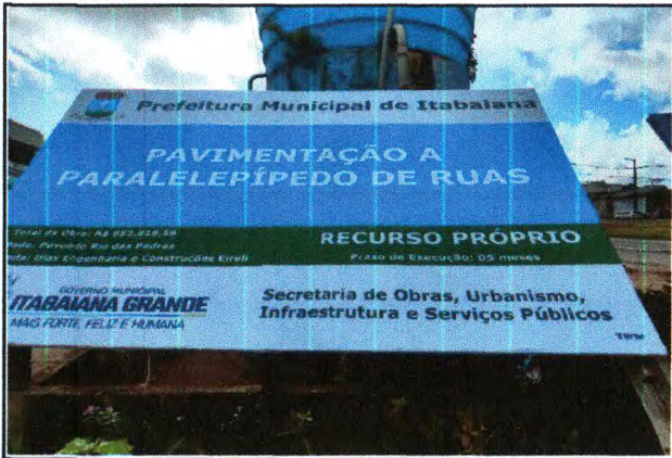
PLACA DA OBRA