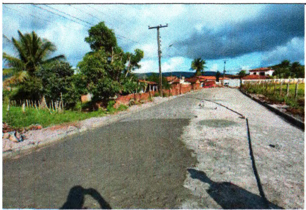
PAVIMENTAÇÃO DO TRECHO 02