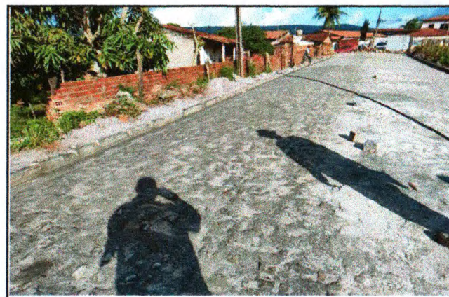
PAVIMENTAÇÃO DO TRECHO 02