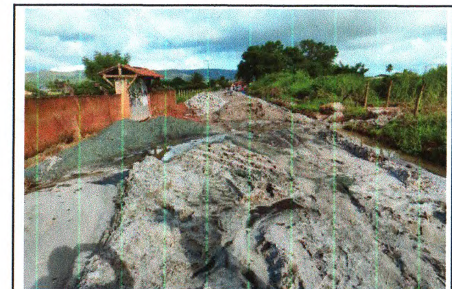
PAVIMENTAÇÃO DO TRECHO 02