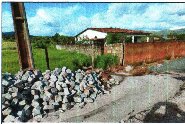
PAVIMENTAÇÃO DO TRECHO 02