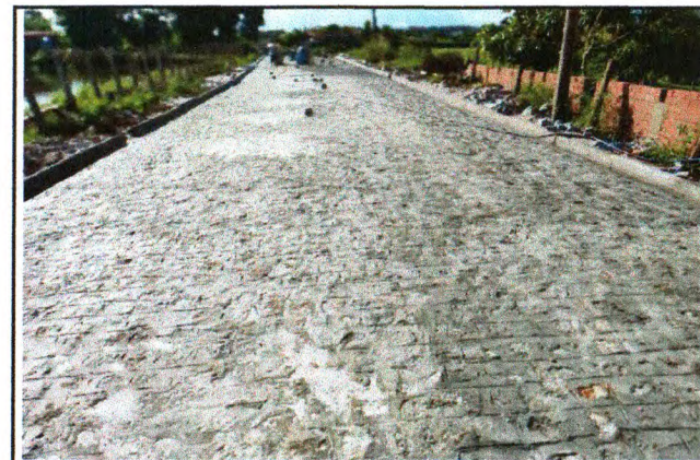
PAVIMENTAÇÃO DO TRECHO 02