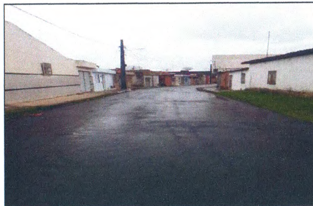
TRAVESSA ANTÔNIO DE JESUS