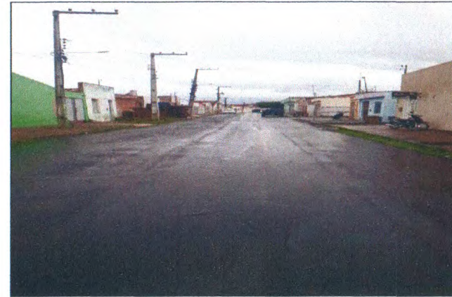
RUA JOSÉ NUNES DE MENDONÇA