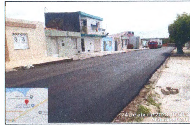
RUA JOSÉ ANTÔNIO DE JESUS