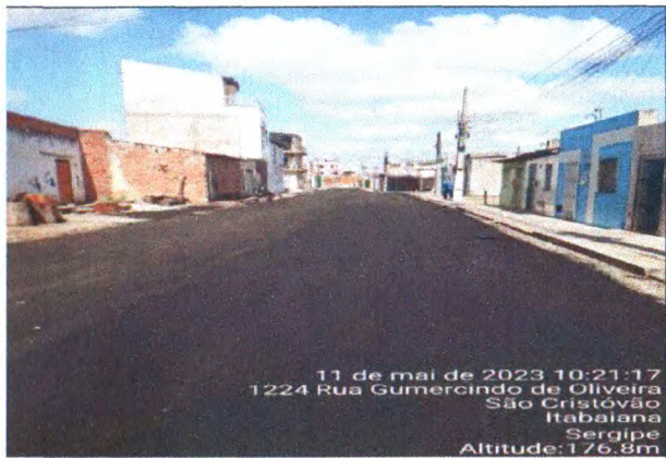
RUA GUMERCINDO DE OLIVEIRA