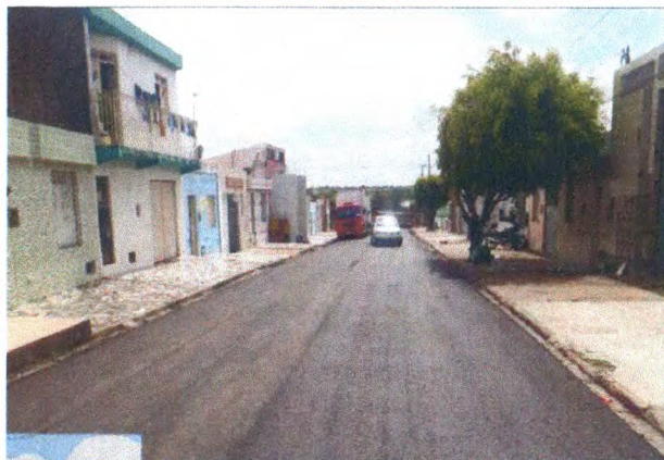
RUA JOSÉ ANTÔNIO DE JESUS

PERÍODO DOS SERVIÇOS: 11/04/2023 A 11/05/2023