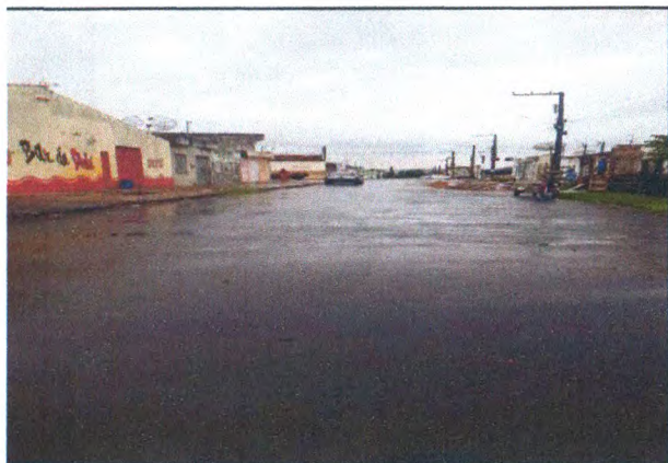
RUA FRANCISCO ALVES DE OLIVEIRA

PERÍODO DOS SERVIÇOS: 11/04/2023 A 11/05/2023