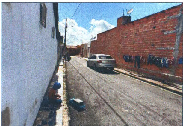
TRAVESSA FRANCISCO BRAGANÇA