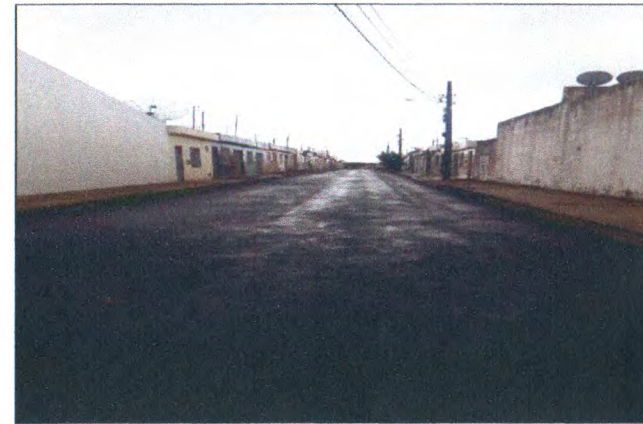
RUA JACONIAS FERREIRA LIMA