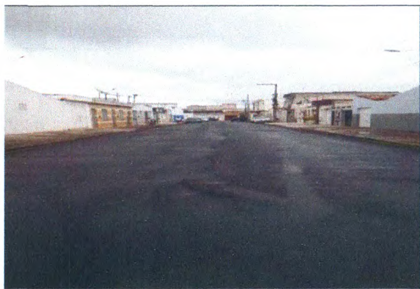
RUA ALUIZIO LIMA DOS SANTOS