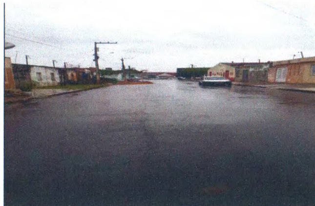
RUA FRANCISCO ALVES DE OLIVEIRA