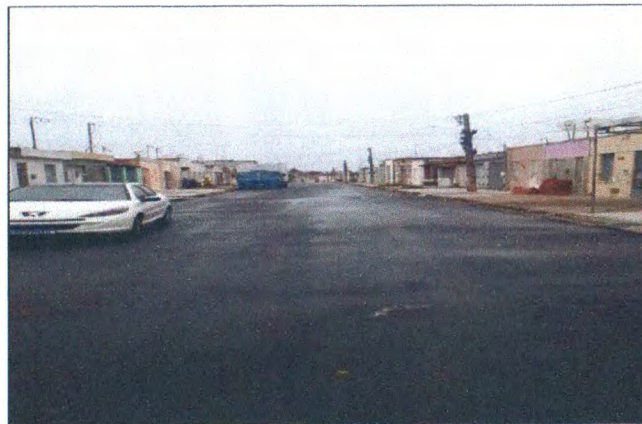
RUA JACONIAS FERREIRA LIMA