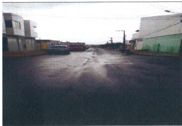
AV. DR. LEANDRO MAYNARD MACIEL