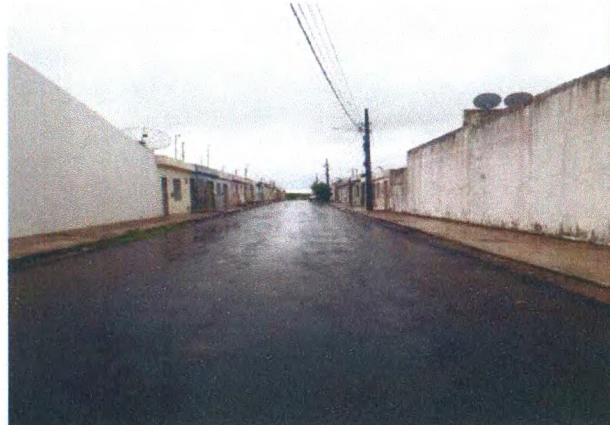
RUA JOSÉ ADALBERTO DE MENEZES