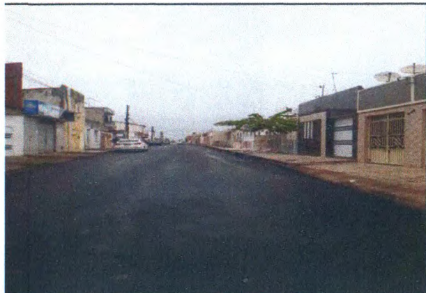
RUA ALUIZIO ALMEIDA SILVA

PERÍODO DOS SERVIÇOS: 11/04/2023 A 11/05/2023