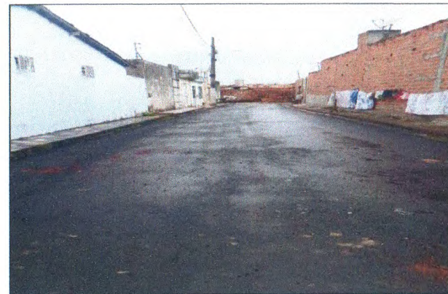
RUA JOSÉ ALVES DE OLIVEIRA