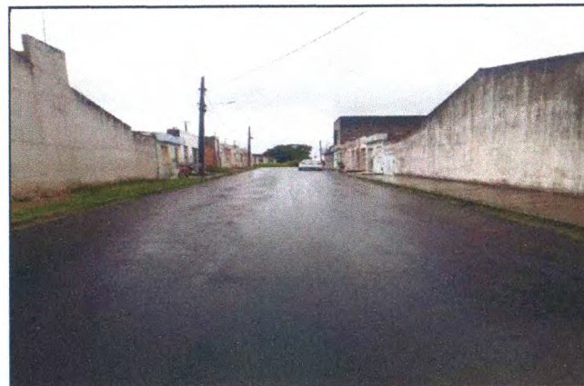
RUA GLEIDIOMAR DE SANTANA