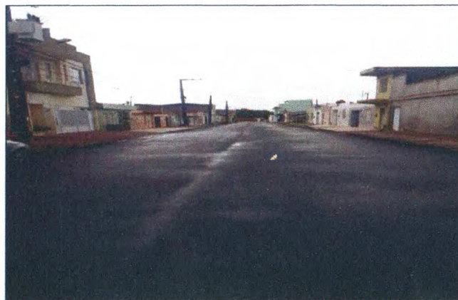
RUA ALUIZIO LIMA DOS SANTOS