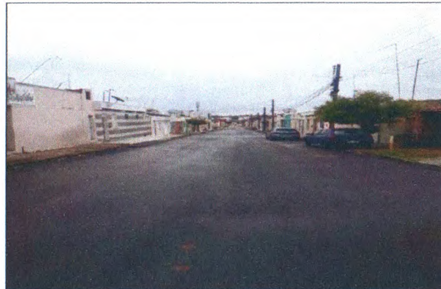
RUA ALUIZIO ALMEIDA SILVA