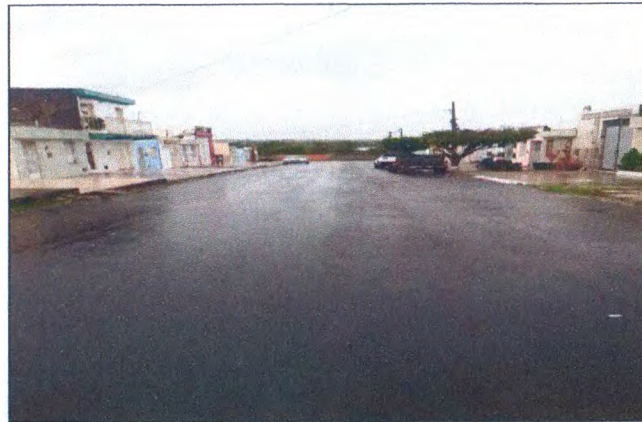
RUA JOSÉ NUNES DE MENDONÇA