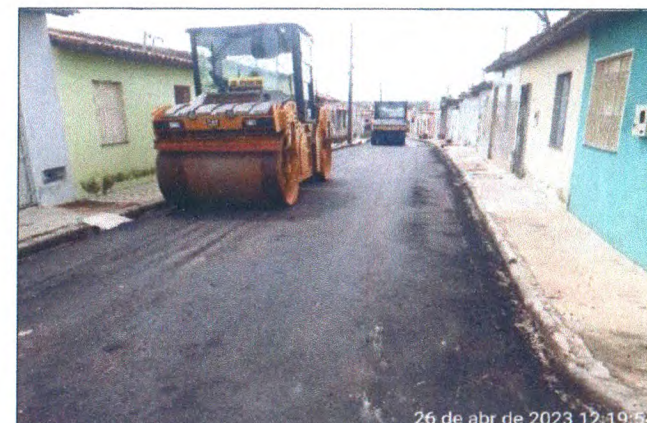
TRAVESSA FRANCISCO ALVES DE OLIVEIRA