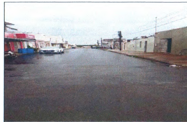
RUA FRANCISCO ALVES DE OLIVEIRA