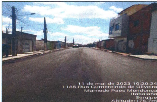
RUA GUMERCINDO DE OLIVEIRA