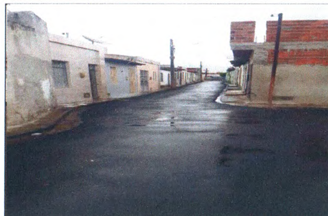
TRAVESSA JOSÉ ALVES DE OLIVEIRA III