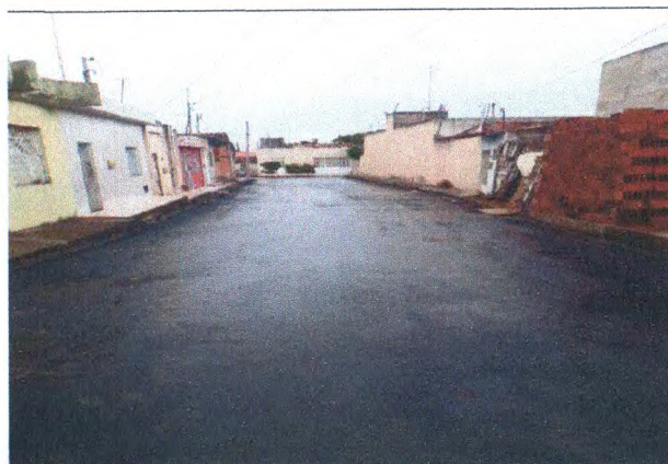
RUA JOSÉ ALVES DE OLIVEIRA