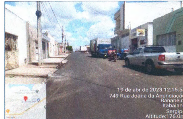
RUA JOANA DA ANUNCIÇÃO BORGES