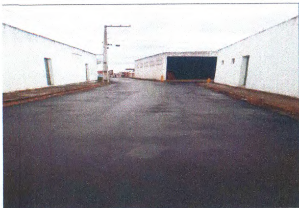
TRAVESSA ANTÔNIO DE JESUS

PERÍODO DOS SERVIÇOS: 11/04/2023 A 11/05/2023