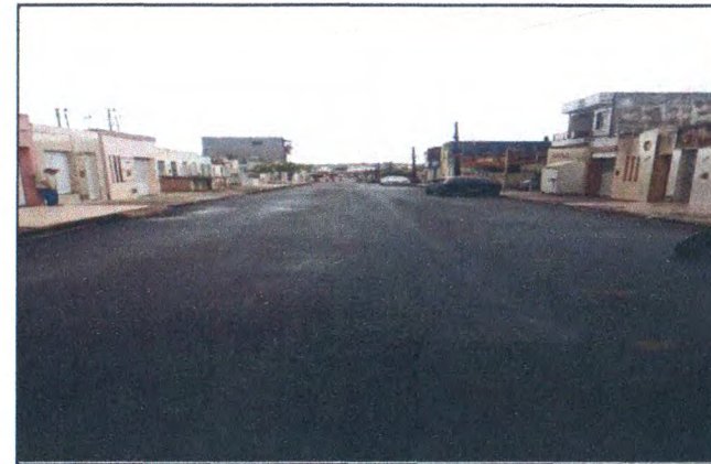
RUA ALUIZIO ALMEIDA SILVA