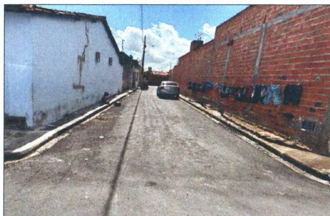
TRAVESSA FRANCISCO BRAGANÇA