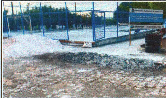
PLACA DE OBRA, REVISÃO DE ALAMBRADO E INSTALAÇÃO DE TELA DE AÇO GALVANIZADO