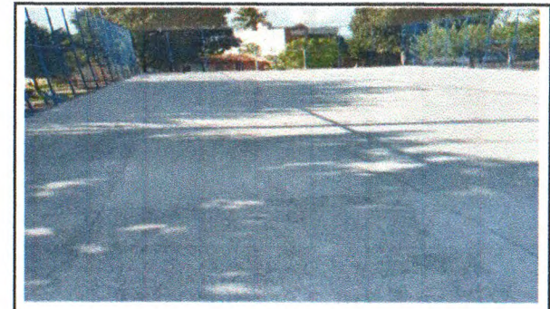
REVISÃO DE ALAMBRADO, INSTALAÇÃO DE TELA DE AÇO GALVANIZADO E PISO DE ALTA RESISTÊNCIA POLIDO