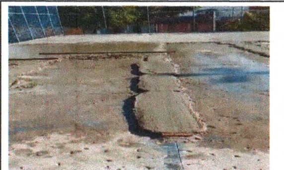
EXECUÇÃO DE PASSEIO EM CONCRETO