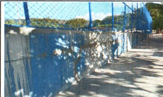
REVISÃO DE ALAMBRADO E INSTALAÇÃO DE TELA DE AÇO GALVANIZADO