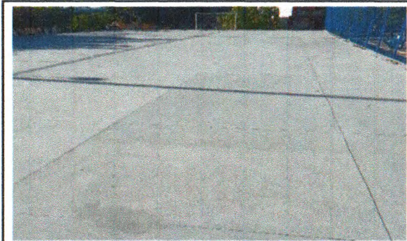
PISO DE ALTA RESISTÊNCIA POLIDO