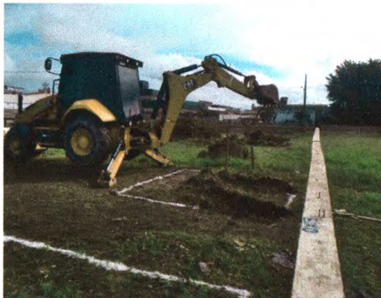
EXECUÇÃO DA SAPATA: ESCAVAÇÃO