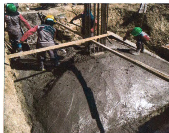
EXECUÇÃO DA SAPATA: LANÇAMENTO DO CONCRETO