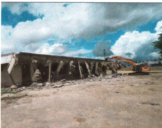
DEMOLIÇÃO DE ESTRUTURA NA ÁREA DO TERRENO