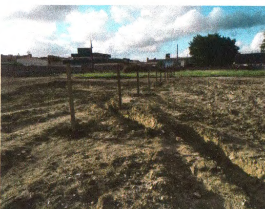
LOCAÇÃO DA OBRA