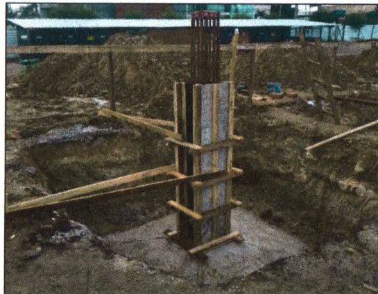
EXECUÇÃO DA SAPATA: PROCESSO DE CURA