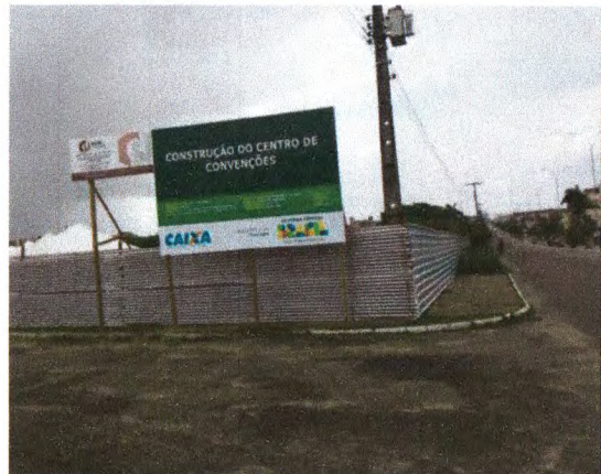
PLACA DA OBRA

CONTRATANTE: PREFEITURA MUNICIPAL DE ITABAIANA