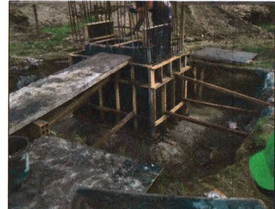
EXECUÇÃO DA SAPATA: CONCRETAGEM DO ARRANQUE