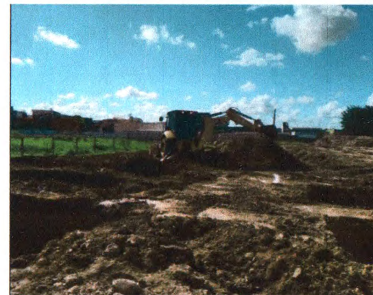
EXECUÇÃO DA SAPATA: ESCAVAÇÃO