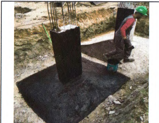
EXECUÇÃO DA SAPATA: IMPERMEABILIZAÇÃO