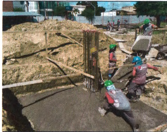
EXECUÇÃO DA SAPATA: CONCRETAGEM DA BASE