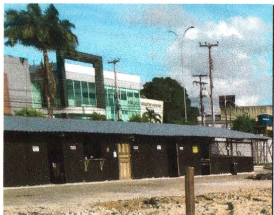
BARRACÃO DE APOIO