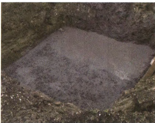
EXECUÇÃO DA SAPATA: APLICAÇÃO DO CONCRETO MAGRO