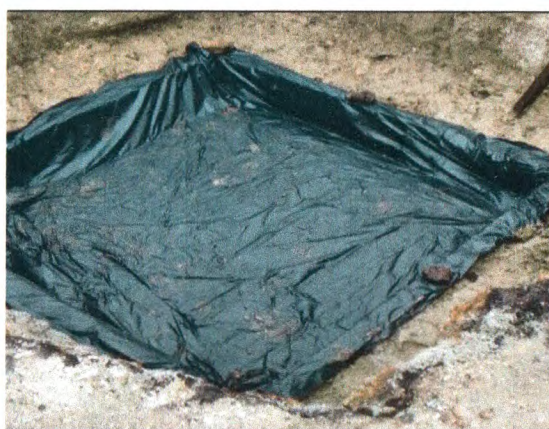
EXECUÇÃO DA SAPATA: FORMA PARA BASE