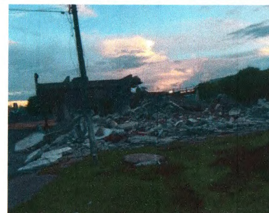
DEMOLIÇÃO DE ESTRUTURA NA ÁREA DO TERRENO