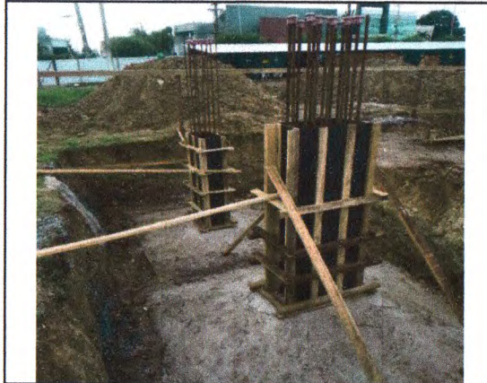
EXECUÇÃO DA SAPATA: FORMA PARA O ARRANQUE