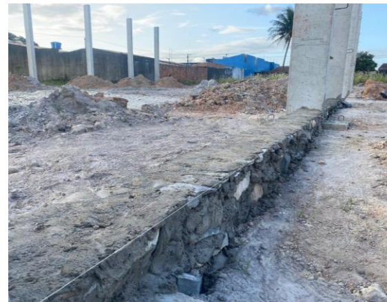
ALVENARIA DE PEDRA - QUADRA