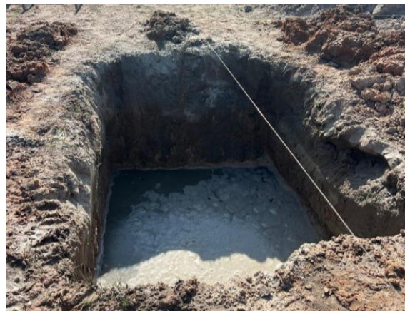
ESCAVAÇÃO DAS VALAS PARA A FUNDAÇÃO DO BALCÃO