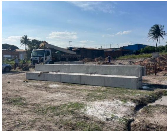
PILARES PRÉ MOLDADOS