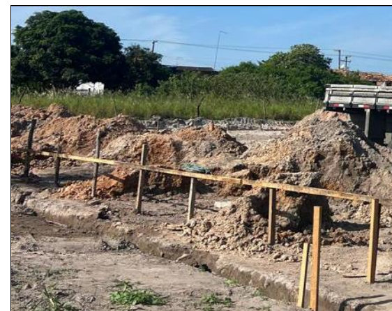
INSTALAÇÃO DOS GABARITOS NA DELIMITAÇÃO DAS OBRAS