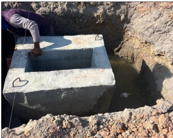
ASSENTAMENTO DA SAPATA PRÉ MOLDADA

CONTRATANTE: PREFEITURA MUNICIPAL DE ITABAIANA