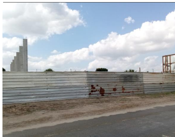
TAPUME EM TELHA METÁLICA