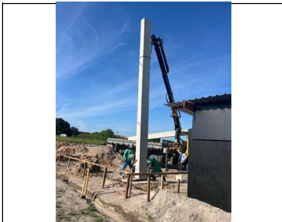
INSTALAÇÃO DOS PILARES PRÉ MOLDADOS