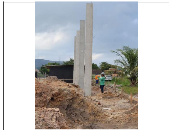
INSTALAÇÃO DOS PILARES PRÉ MOLDADOS