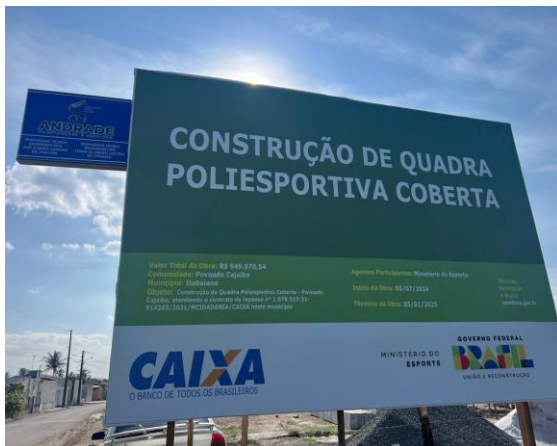
PLACA DA OBRA