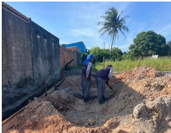
ESCAVAÇÃO DAS VALAS PARA A FUNDAÇÃO DO BALCÃO