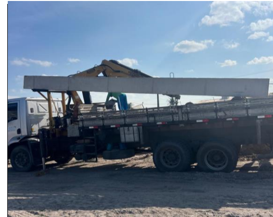
INSTALAÇÃO DOS PILARES PRÉ MOLDADOS