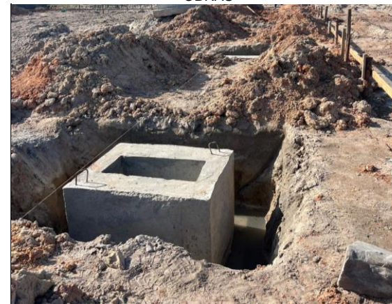
ASSENTAMENTO DA SAPATA PRÉ MOLDADA