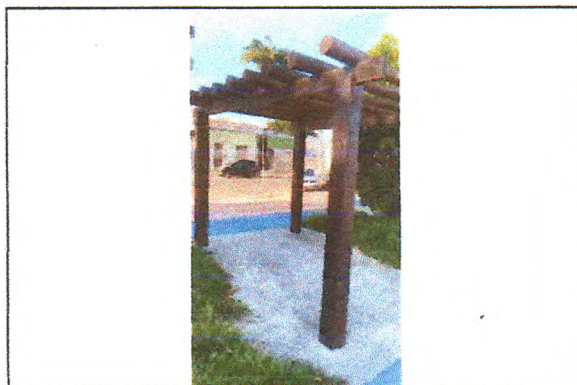
Pintura Imunizante para madeira (Pergolado)