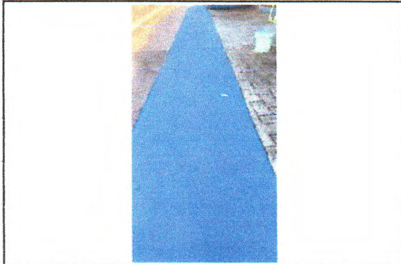
Pintura Acrílica em piso cimentado (faixa de caminhada)