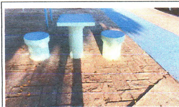
Pintura de Acabamento (mesas em alvenaria)