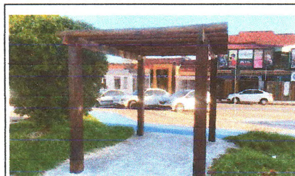
Pintura Imunizante para madeira (Pergolado)