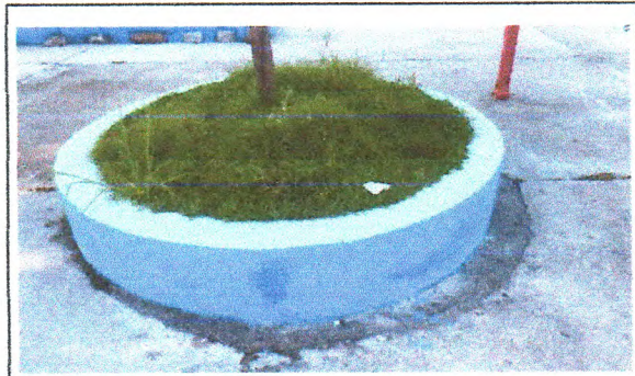
Pintura de Acabamento (canteiros)