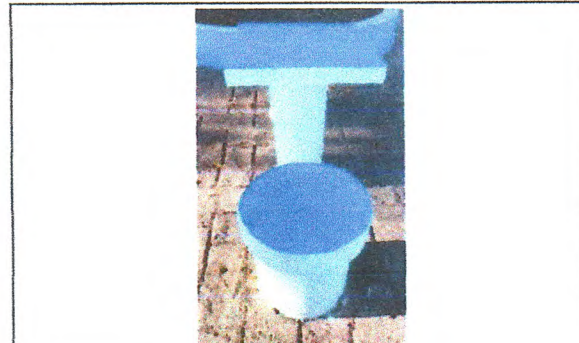
Pintura de Acabamento (bancos em alvenaria)