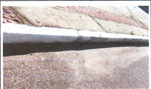
Pintura de Meio fio (caiação)