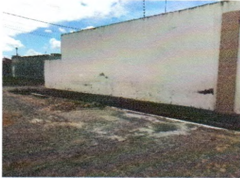
RUA ACINDINO AMARO DE ARAUJO