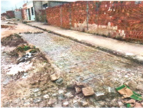
RUA SÉRGIO BATISTA DOS SANTOS