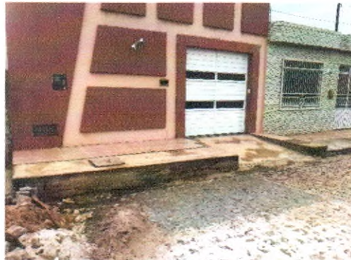
RUA SÉRGIO BATISTA DOS SANTOS