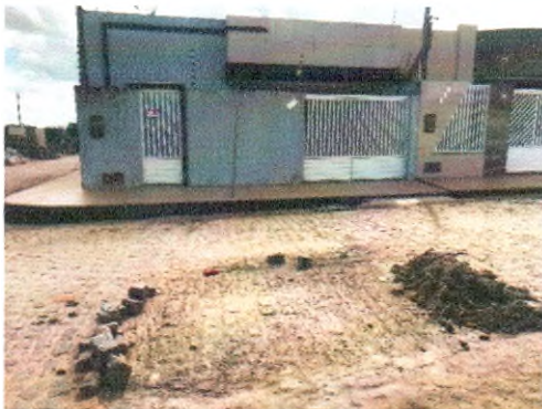
RUA JOSÉ MOISES DE SANTANA