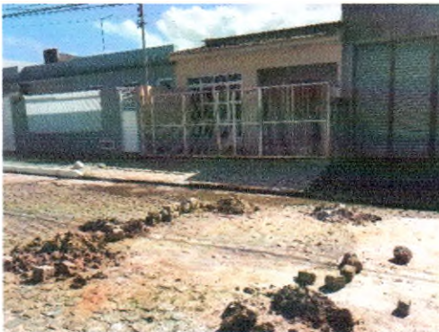
RUA MARIA ANGÉLICA DA CONCEIÇÃO