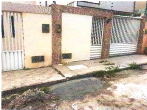
RUA OLIMPO NERI DOS SANTOS