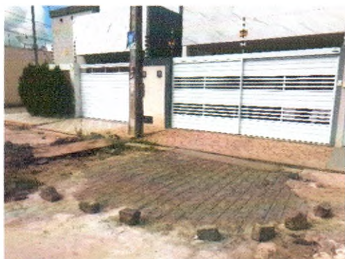
RUA JOSÉ MOISES DE SANTANA