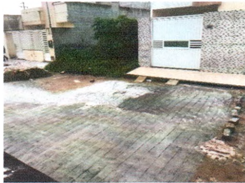
RUA ACINDINO AMARO DE ARAUJO