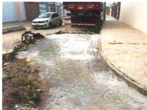
RUA RIACHO DO NAVIO