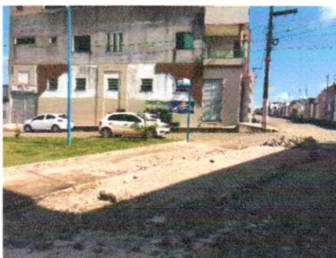
RUA JOSÉ ANTONIO DE SANTANA