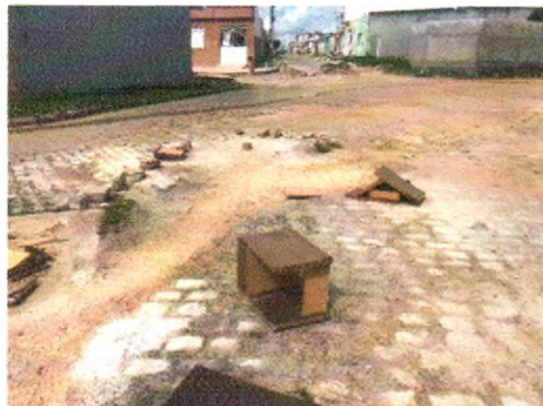
AVENIDA DR. LEANDRO MAYNARD MACIEL