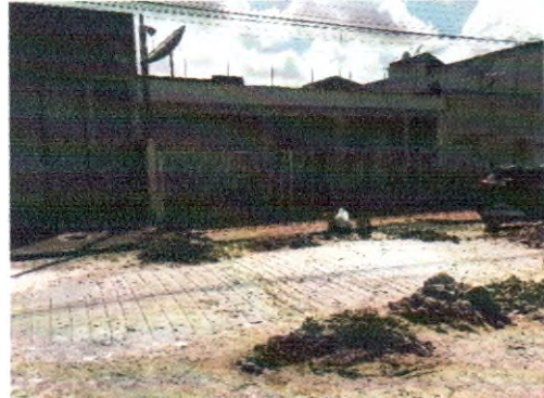
RUA MARIA ANGÉLICA DA CONCEIÇÃO