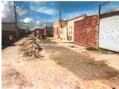
RUA SÉRGIO BATISTA DOS SANTOS