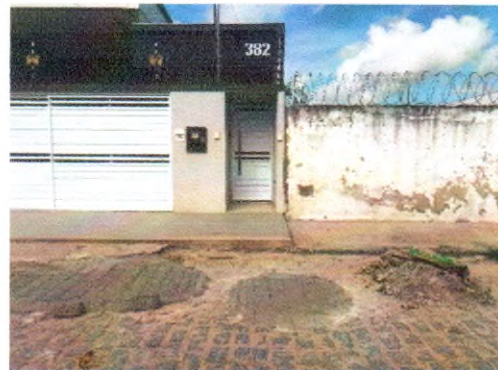
RUA JOSÉ MOISES DE SANTANA