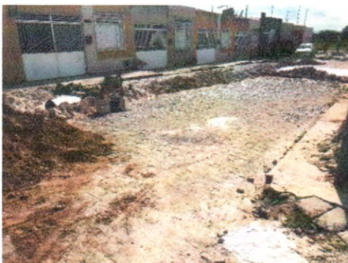
RUA SÃO JORGE