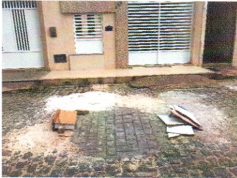
TRAVESSA RITA VIEIRA DOS SANTOS