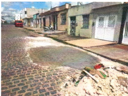
AVENIDA DR. LEANDRO MAYNARD MACIEL