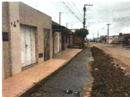
PRAÇA DEPUTADO JOSÉ WILSON DA CUNHA