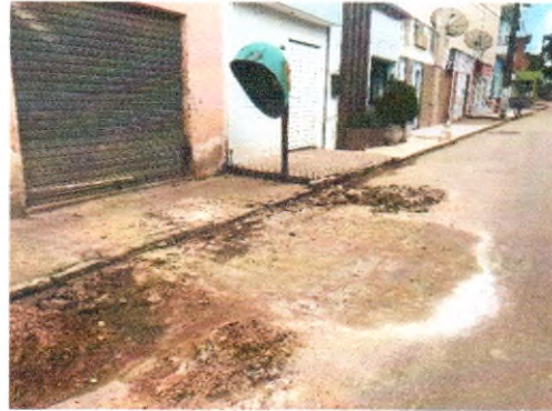
PRAÇA DEPUTADO JOSÉ WILSON DA CUNHA