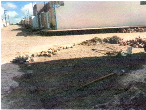
RUA JOSÉ ANTONIO DE SANTANA