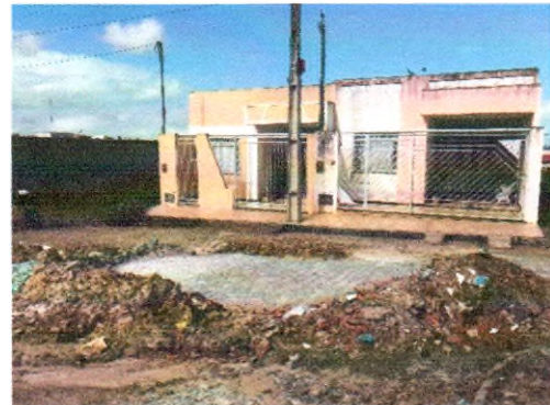
RUA JOSÉ ANTONIO DE SANTANA