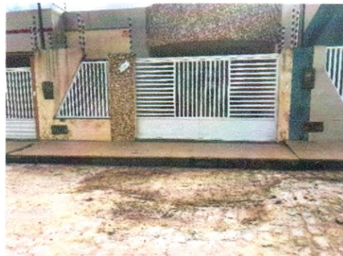
RUA JOSÉ MOISES DE SANTANA