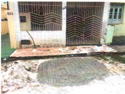
TRAVESSA RITA VIEIRA DOS SANTOS