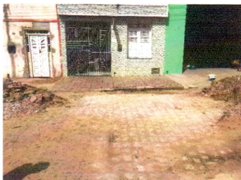
RUA JACONIAS FERREIRA LIMA