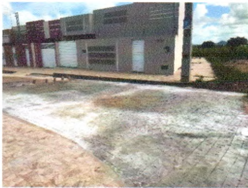
RUA RIACHO DO NAVIO