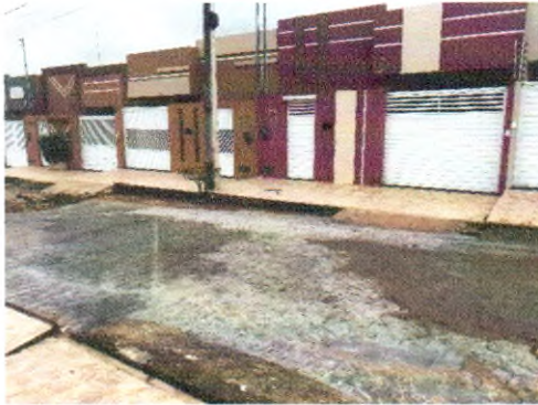
RUA RIACHO DO NAVIO