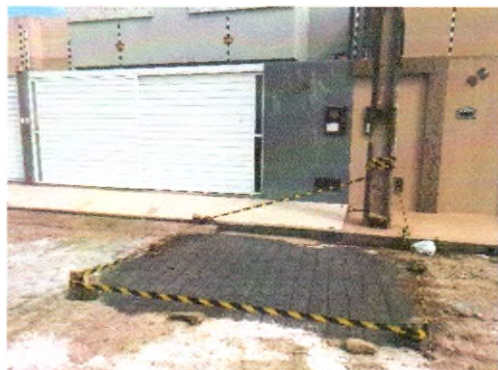
RUA OLIMPO NERI DOS SANTOS