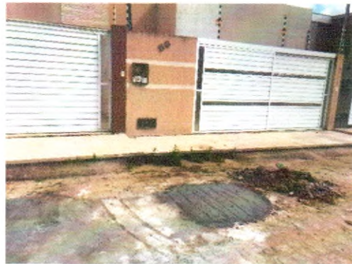
RUA OLIMPO NERI DOS SANTOS