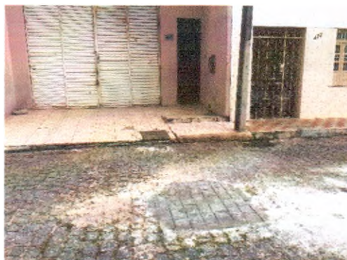
TRAVESSA RITA VIEIRA DOS SANTOS