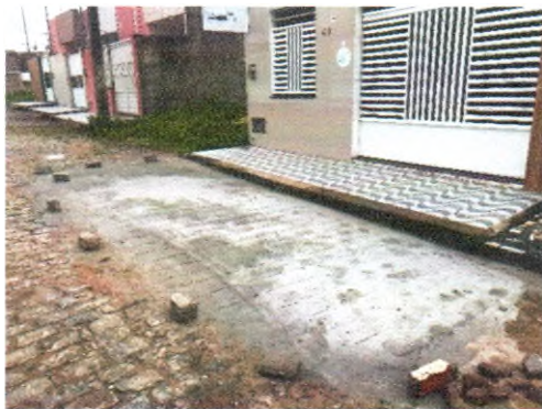
RUA JOSÉ AMÉRICO SANTANA