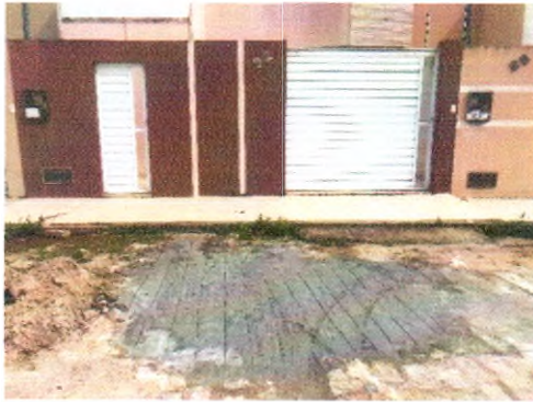
RUA OLIMPO NERI DOS SANTOS