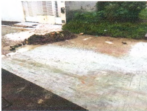
RUA ACINDINO AMARO DE ARAUJO