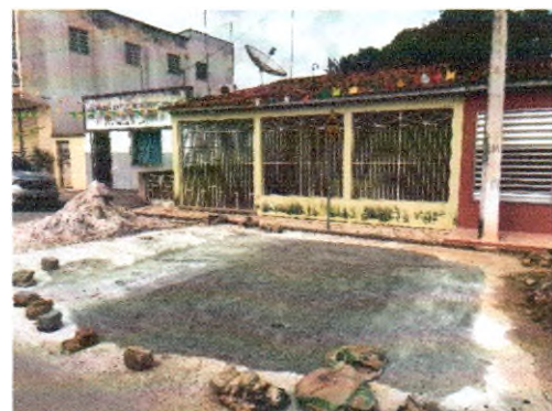
AVENIDA ACRÍSIO DOS SANTOS ANDRADE