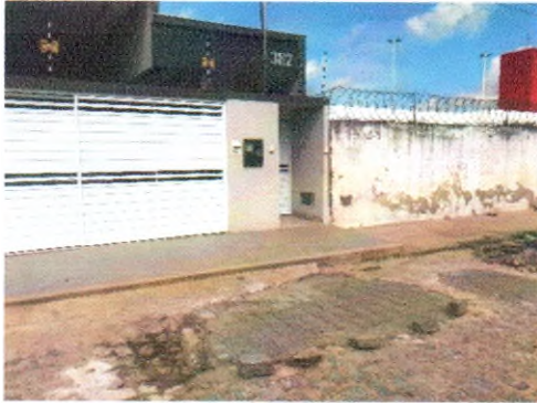
RUA JOSÉ MOISES DE SANTANA