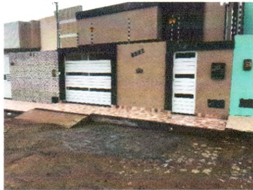
RUA ACINDINO AMARO DE ARAUJO