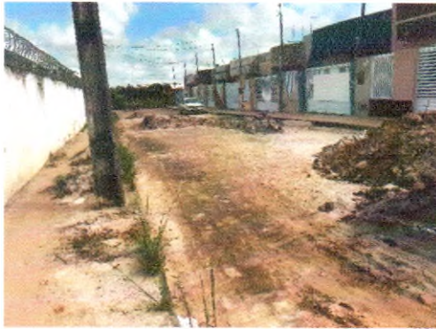
RUA JOSÉ MOISES DE SANTANA