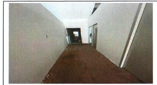
ALVENARIA DE BLOCO, CHAPISCO, REBOCO E EMASSAMENTO E PINTURA DE BANCADA E PAREDES