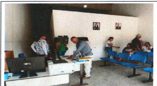
EMASSAMENTO E PINTURAS DE PAREDES