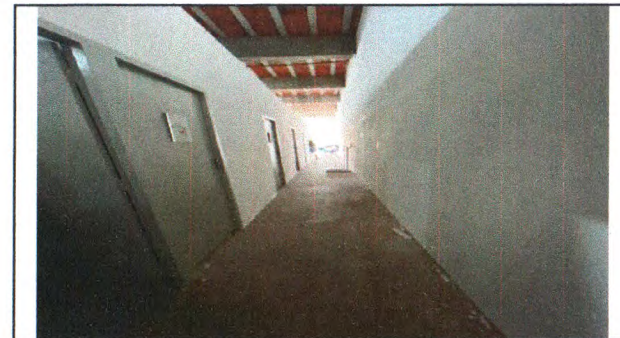
EMASSAMENTO E PINTURAS DE PAREDES