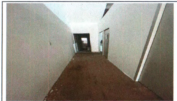
EMASSAMENTO E PINTURAS DE PAREDES