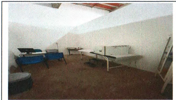
ALVENARIA DE BLOCO, CHAPISCO, REBOCO E EMASSAMENTO E PINTURA DE BANCADA E PAREDES