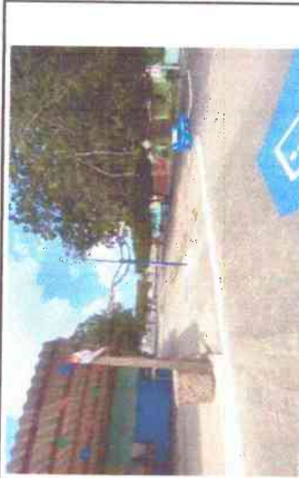
PINTURA DE BANCOS, PINTURA DE MEIO-FIO