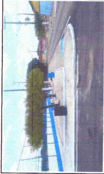
PINTURA METÁLICA, PINTURA DE MEIO-FIO, PINTURA DA MURETA DA QUADRA, PINTURA DOS BANCOS