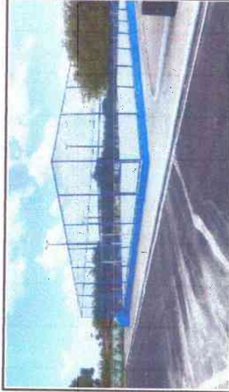
PINTURA METÁLICA, PINTURA DE MEIO-FIO, PINTURA DA MURETA DA QUADRA, LIMPEZA GERAL