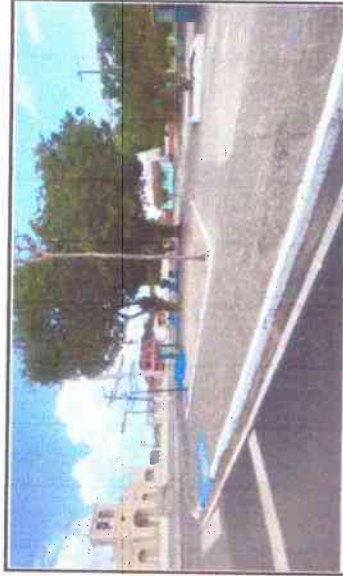
PINTURA DE MEIO-FIO, PINTURA DOS BANCOS, LIMPEZA GERAL