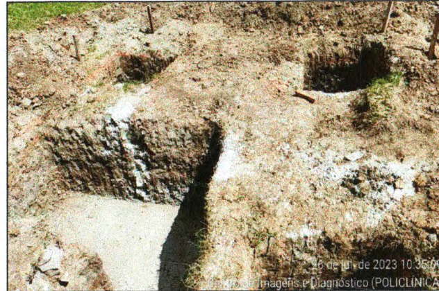
ESCAVAÇÃO E LASTRO DE CONCRETO DAS SAPATAS DA GUARITA