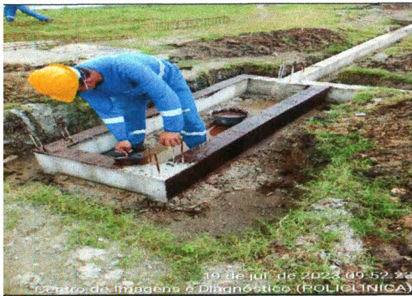
IMPERMEABILIZAÇÃO DOS BALDRAMES