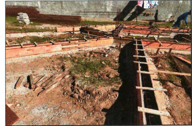
MONTAGEM DE FÔRMA DOS BALDRAMES