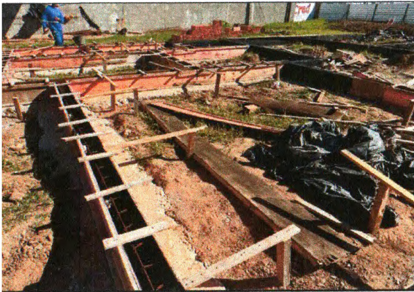
MONTAGEM DE FÔRMA DOS BALDRAMES