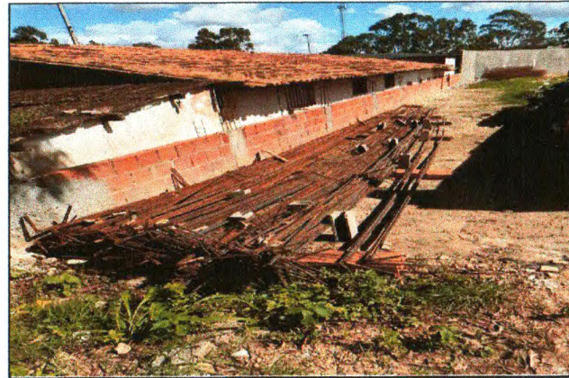
CORTE E DOBRA DO AÇO DAS VIGAS DA COBERTURA