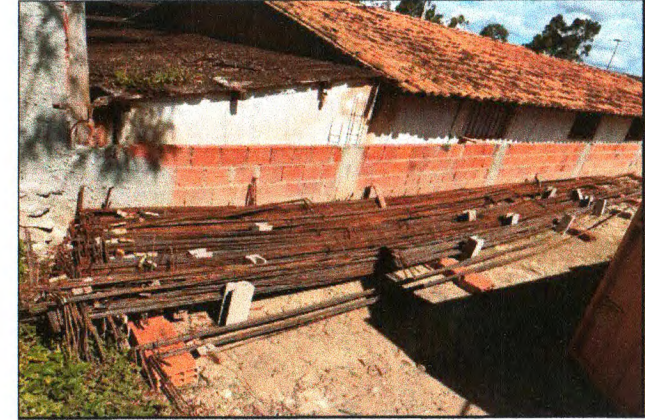
CORTE E DOBRA DO AÇO DAS VIGAS DA COBERTURA