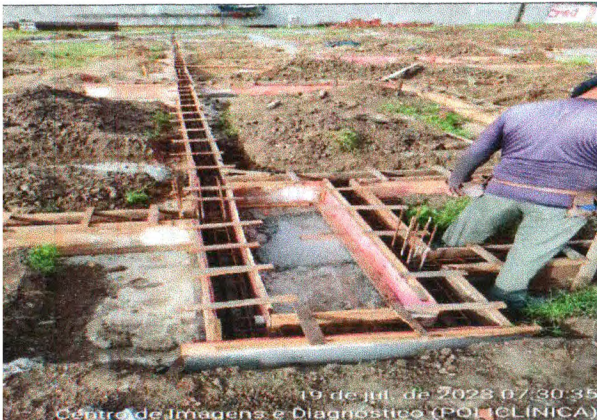
MONTAGEM DE FÔRMA DOS BALDRAMES