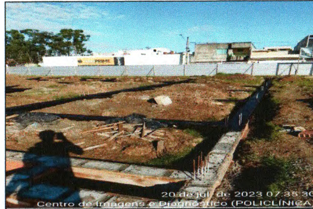
IMPERMEABILIZAÇÃO DOS BALDRAMES