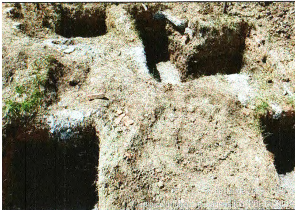
ESCAVAÇÃO E LASTRO DE CONCRETO DAS SAPATAS DA GUARITA