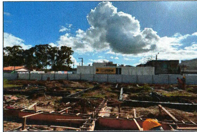
MONTAGEM DE FÔRMA DOS BALDRAMES