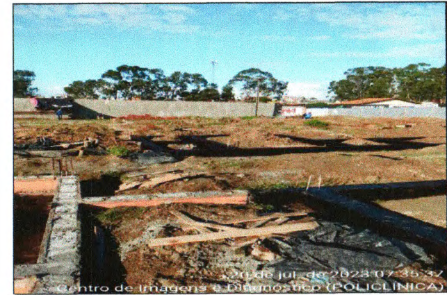
IMPERMEABILIZAÇÃO DOS BALDRAMES