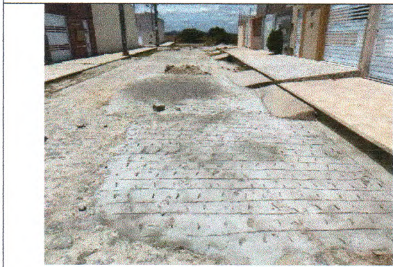
RUA BAIÃO DE DOIS