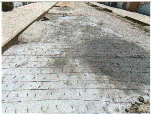
RUA BAIÃO DE DOIS