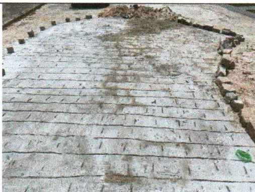
AV. DR. WELLINGTON MENDES