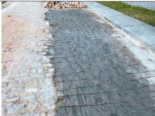
RUA RIACHO DO NAVIO