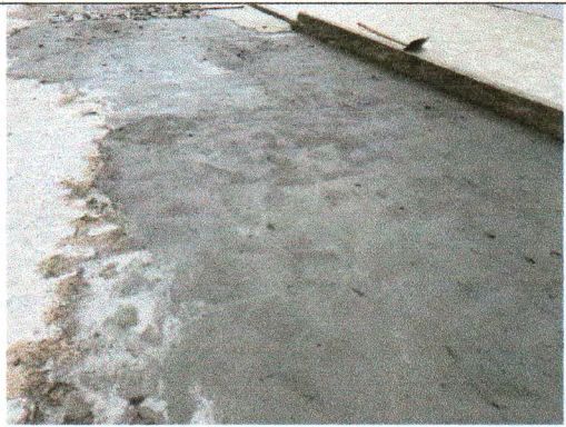
RUA RIACHO DO NAVIO