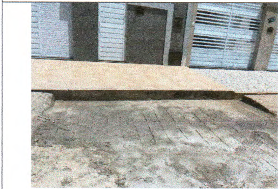
RUA BAIÃO DE DOIS