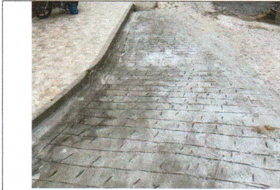
RUA RIACHO DO NAVIO