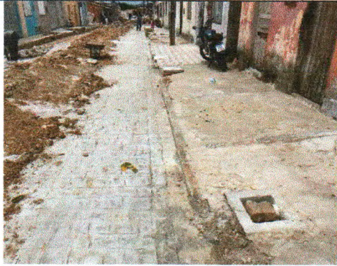
RUA ANTÔNIO MENEZES