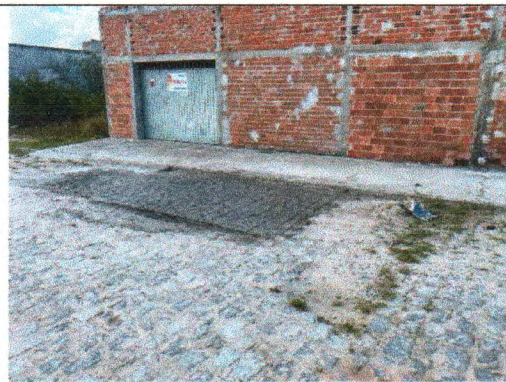
RUA RIACHO DO NAVIO