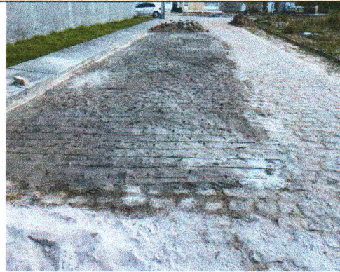
RUA RIACHO DO NAVIO