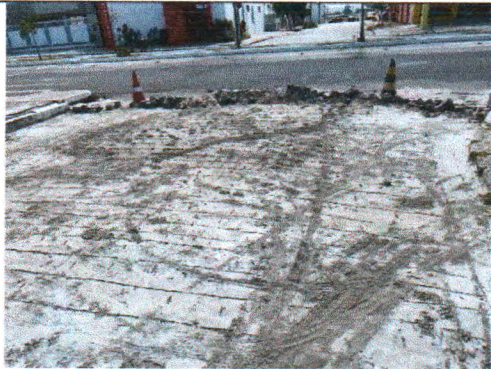
RUA JOSÉ FERREIRA LIMA