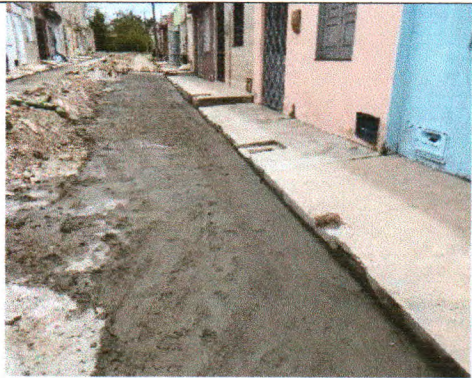
RUA MARIA FELIX DA SILVA