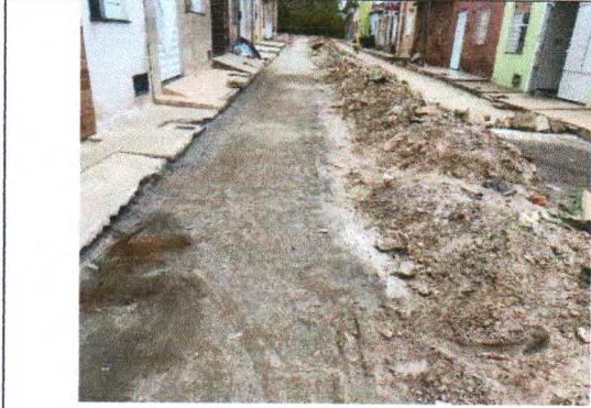
RUA MARIA FELIX DA SILVA