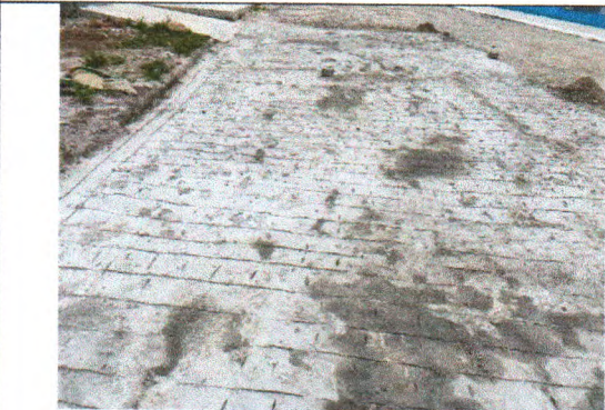
RUA VACA ESTRELA MEU BOI FUBÁ