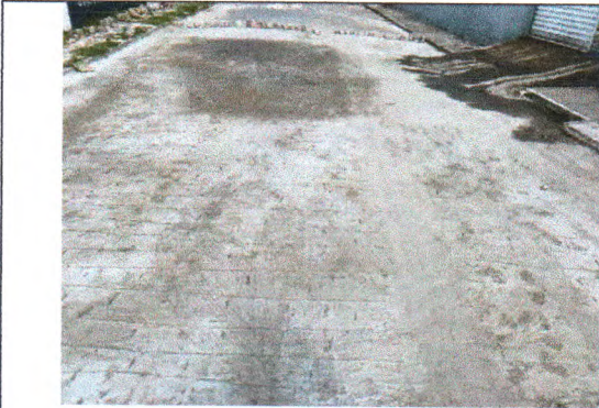
RUA JOSÉ FERREIRA LIMA