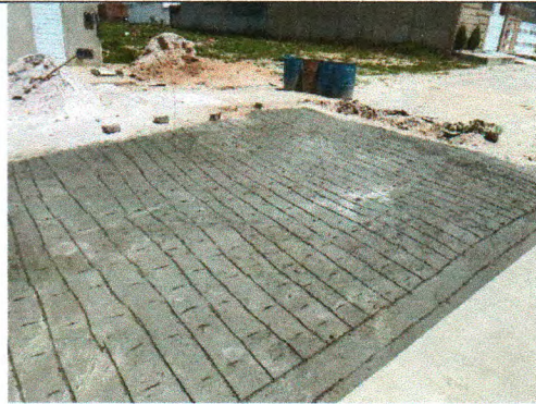
RUA TRISTE PARTIDA