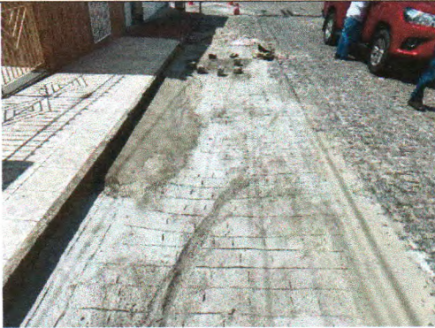
RUA MARCELINO RENATO BISPO