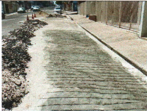
RUA MONSENHOR ERALDO BARBOSA