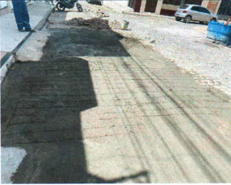
RUA MARCELINO RENATO BISPO