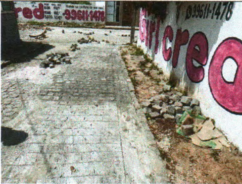
RUA MARIA DOS ANJOS BISPO