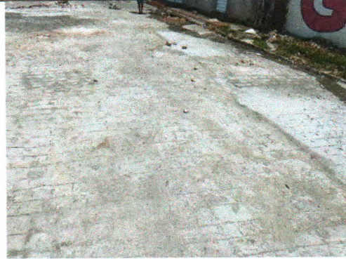
RUA JOSÉ FERREIRA LIMA