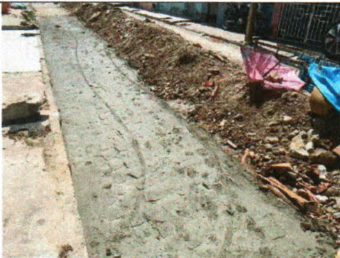
RUA MARIA FELIX DA SILVA