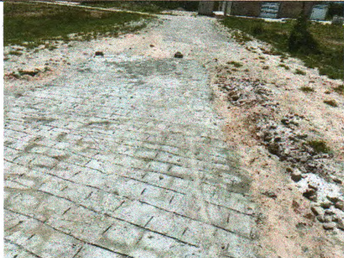
RUA TRISTE PARTIDA