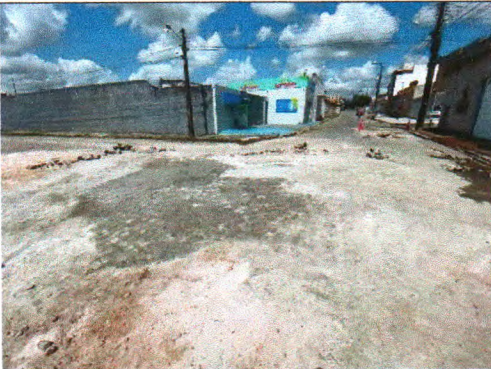
RUA JOSÉ FERREIRA LIMA