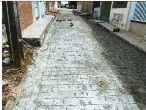
RUA MARIA DOS ANJOS BISPO