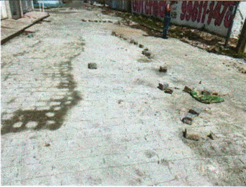
RUA JOSÉ FERREIRA LIMA