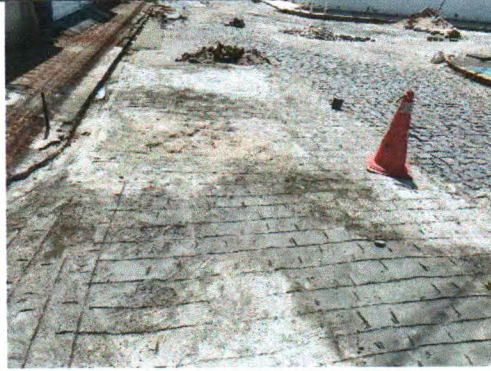
RUA JOSÉ FERREIRA LIMA