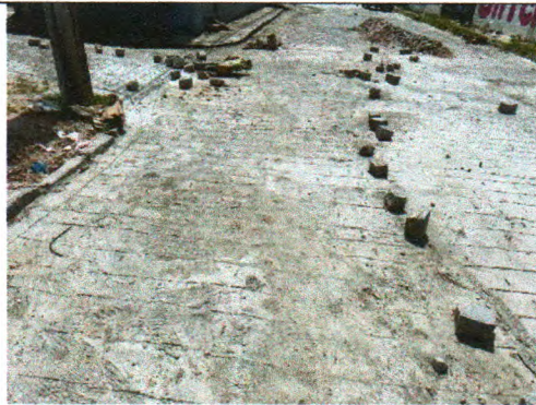
RUA JOSÉ FERREIRA LIMA