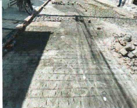
RUA MARCELINO RENATO BISPO