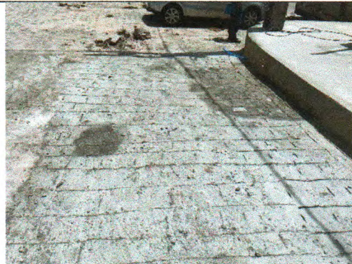
RUA TRISTE PARTIDA