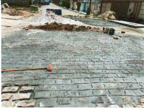
RUA TRISTE PARTIDA