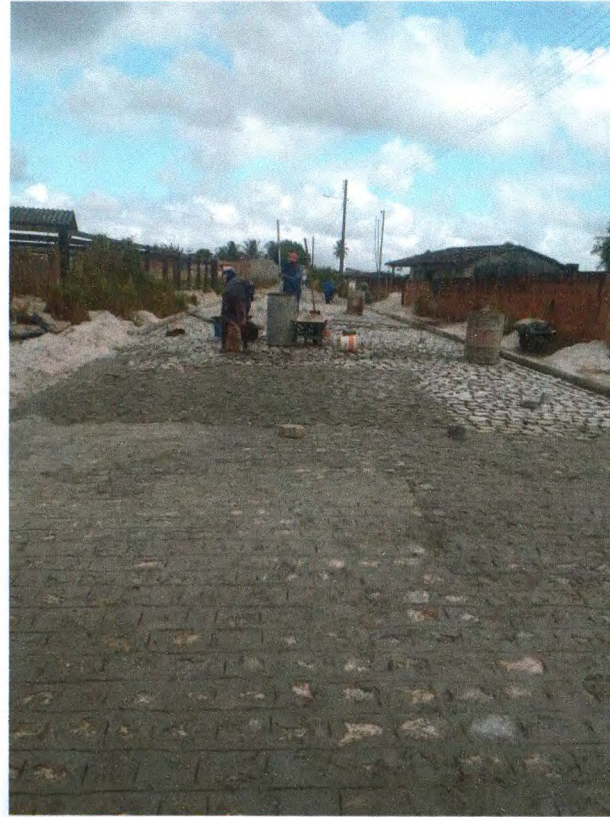
Foto 08: Pavimentação em paralelepípedo granítico sobre colchão de areia.