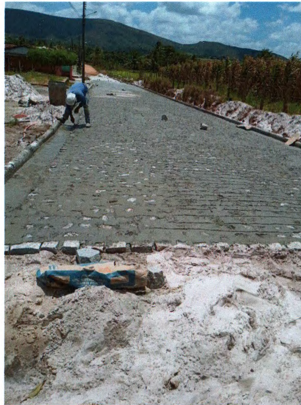
Foto 05: Pavimentação em paralelepípedo granítico sobre colchão de areia.