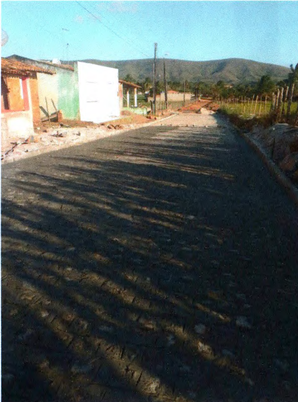
Foto 07: Pavimentação em paralelepípedo granítico sobre colchão de areia.