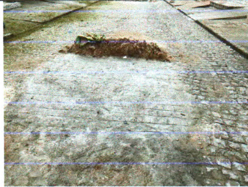
RUA VERA CANDIDA DE SANTANA