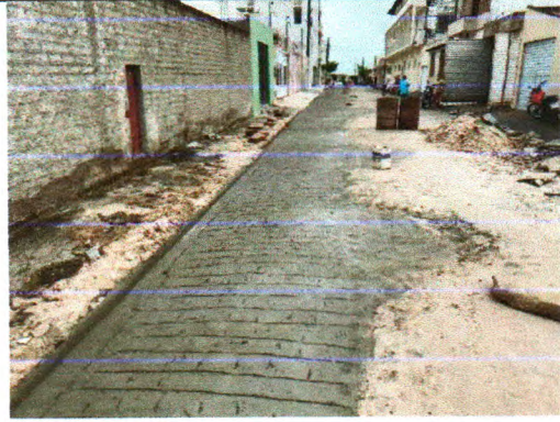
RUA AMAZILDE MENEZES SAMPAIO