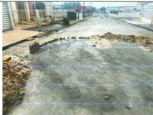
RUA JOSÉ FERREIRA LIMA