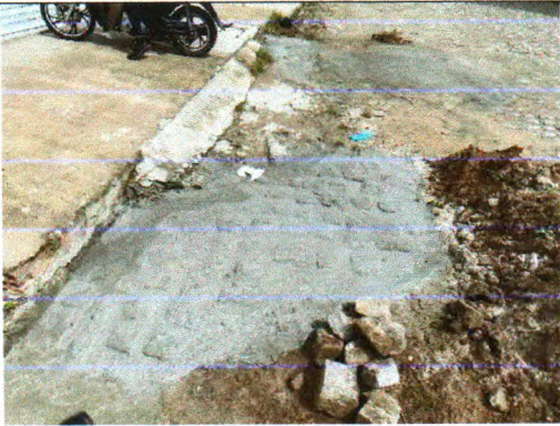
RUA CONSTANTINO ALVES DO AMORIM