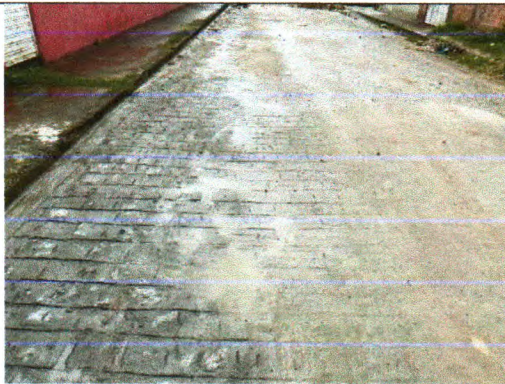
RUA MANOEL SERAFIM DE SANTANA