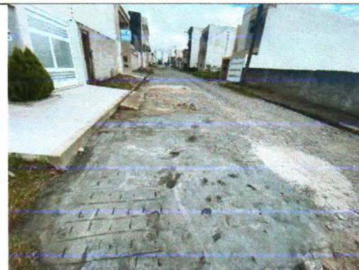
RUA CONSTANTINO ALVES DO AMORIM