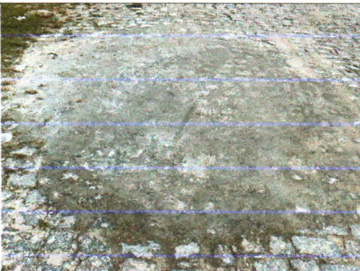
RUA CONSTANTINO ALVES DO AMORIM