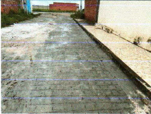
RUA MONSENHOR MARIO