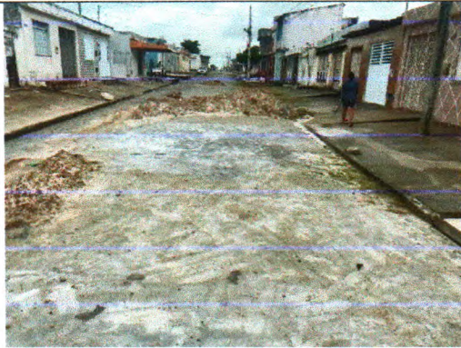
RUA VERA CANDIDA DE SANTANA