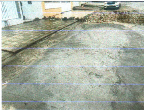
RUA JOSÉ FERREIRA LIMA