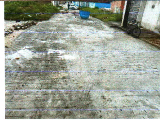
RUA MONSENHOR MARIO