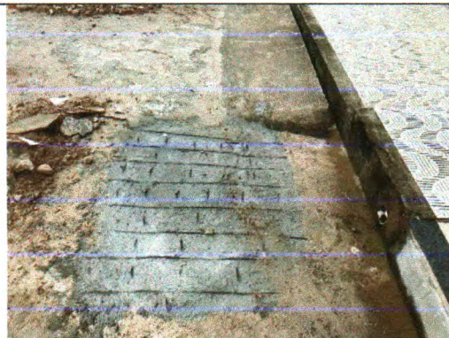
RUA AMAZILDE MENEZES SAMPAIO