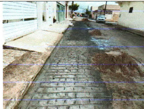
RUA AMAZILDE MENEZES SAMPAIO