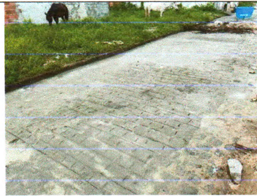
RUA MONSENHOR MARIO