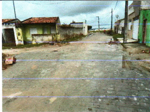
RUA MANOEL SERAFIM DE SANTANA