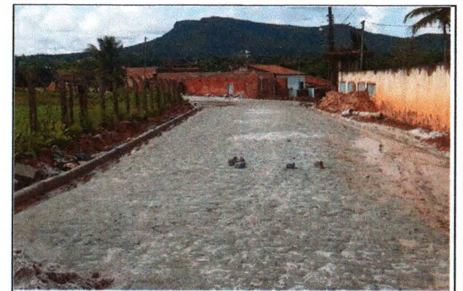
PAVIMENTAÇÃO DO TRECHO 01

Eng. Civil CREA 27202935-4 Coordenador de Nucleo Prefeitura Municipal de Itabaiana