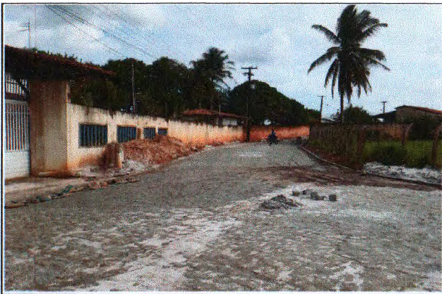
PAVIMENTAÇÃO DO TRECHO 01