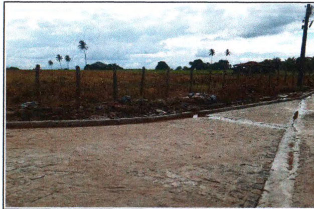
PAVIMENTAÇÃO DO TRECHO 03