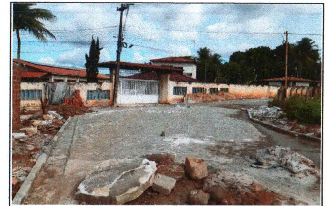
PAVIMENTAÇÃO DO TRECHO 01