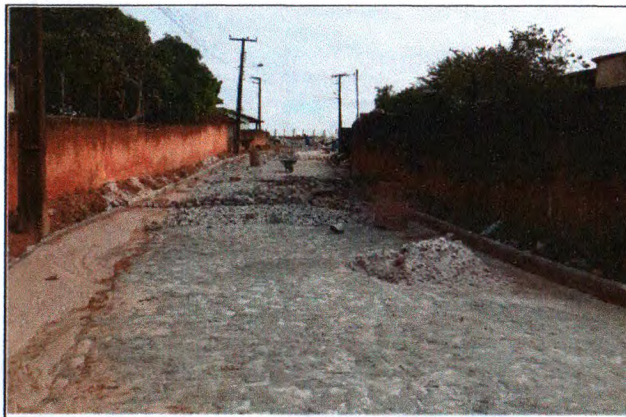
PAVIMENTAÇÃO DO TRECHO 01