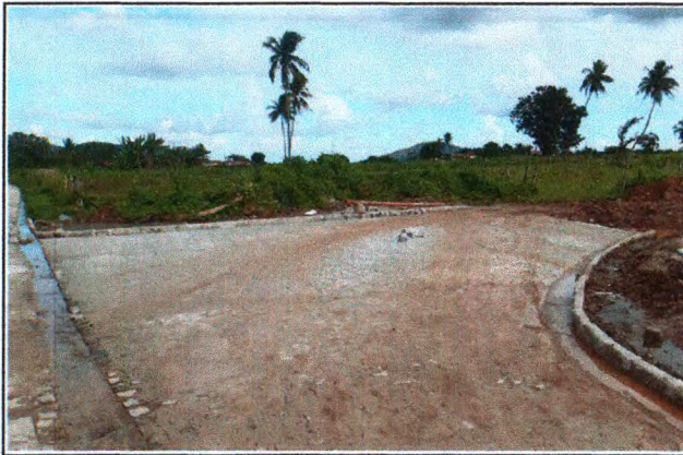
PAVIMENTAÇÃO DO TRECHO 03