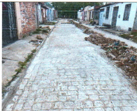
RUA MINERVINA DOS SANTOS