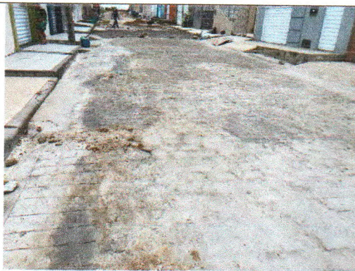
RUA ABNER ALVES DE ALMEIDA