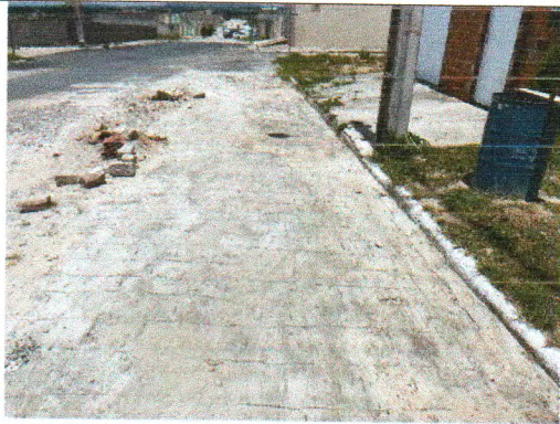
RUA VACA ESTRELA MEU BOI FUBÁ