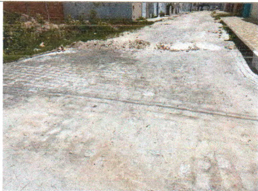
RUA VACA ESTRELA MEU BOI FUBÁ