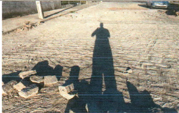
AV. ROSALVO ALEXANDRE DE LIMA