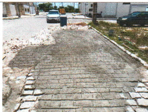
RUA VACA ESTRELA MEU BOI FUBÁ