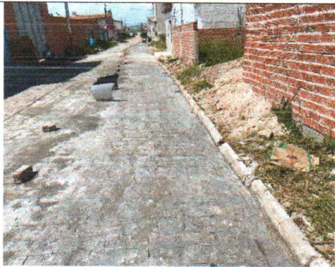
RUA JOÃO TAVARES DE JESUS