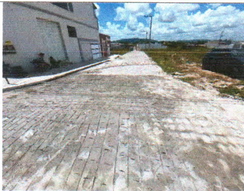
RUA VACA ESTRELA MEU BOI FUBÁ