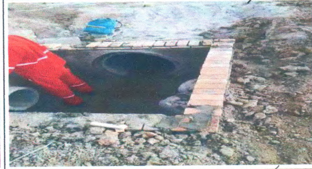
RUA JOSÉ NICOLAU DA SILVEIRA