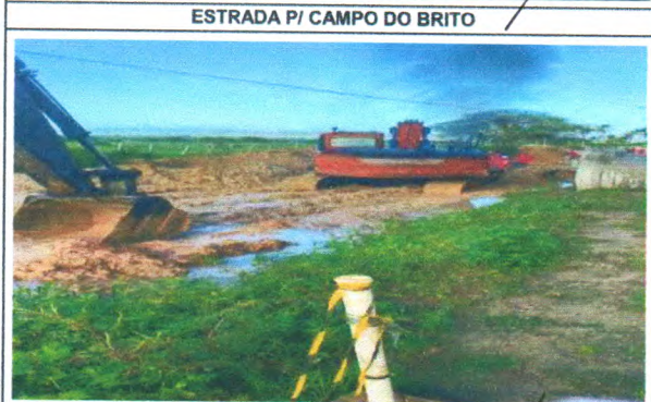
ESTRADA PI CAMPO DO BRITO