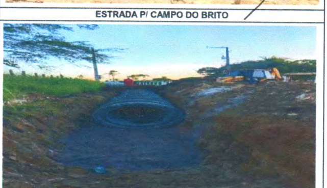
ESTRADA PI CAMPO DO BRITO