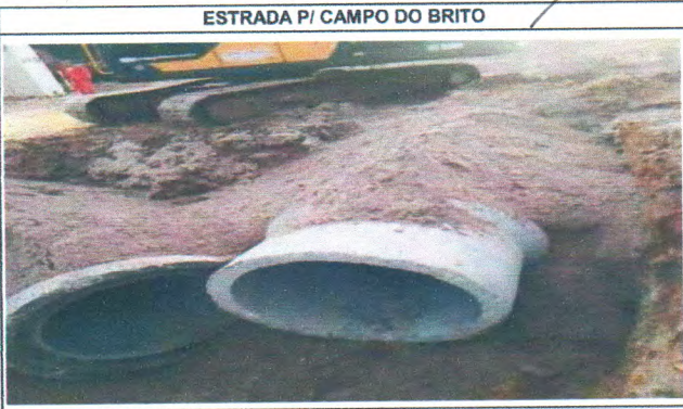
ESTRADA P/ CAMPO DO BRITO