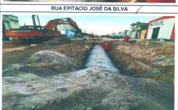
RUA EPITACIO JOSÉ DA SILVA