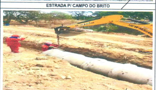
ESTRADA PI CAMPO DO BRITO