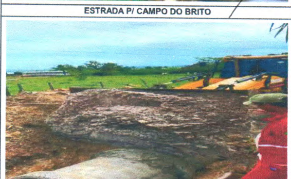
ESTRADA PI CAMPO DO BRITO