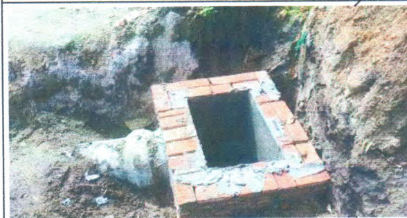
RUA JOSINA EPIFANIA DE OLIVEIRA