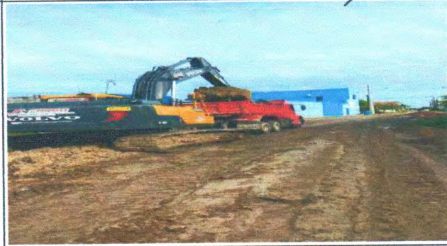
RUA JOSÉ BELO DE ARAUJO