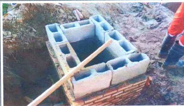
TRAVESSA JOAQUIM ALVES DOS SANTOS