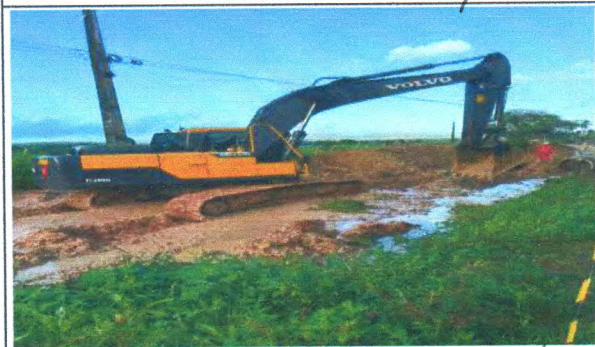
ESTRADA P/ CAMPO DO BRITO