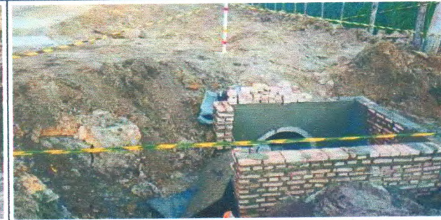
RUA JOSÉ BELO DE ARAUJO