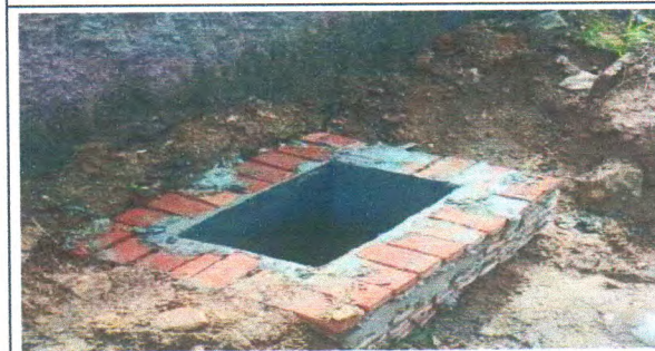
RUA JOÃO TAVARES DE JESUS