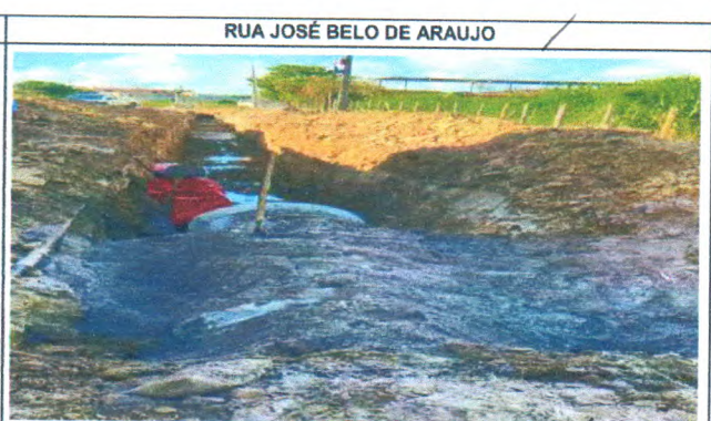
RUA JOSÉ BELO DE ARAUJO