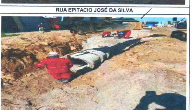
RUA EPITACIO JOSÉ DA SILVA