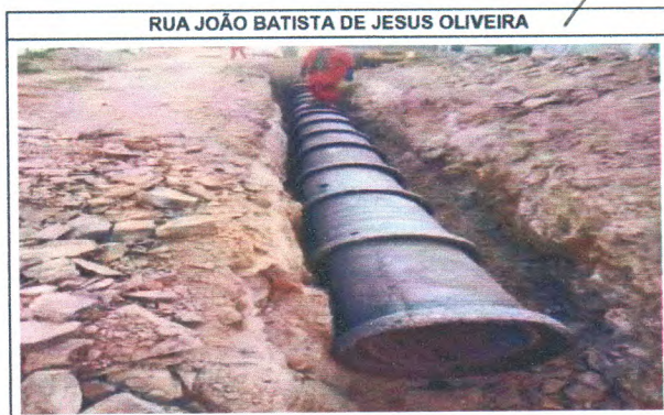
RUA JOÃO BATISTA DE JESUS OLIVEIRA