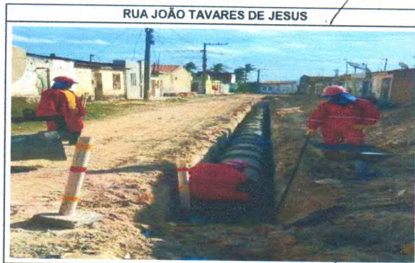
RUA JOÃO TAVARES DE JESUS