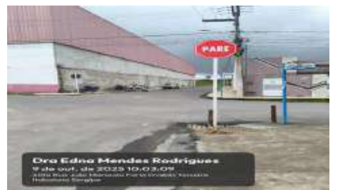
RUA WEDNA MENDES RODRIGUES (LOT. PARAÍO DASERRA)