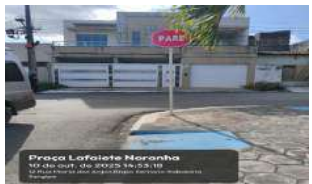
PRAÇA LAFAETE NORONHA (CONJ. JOÃO PEREIRA)