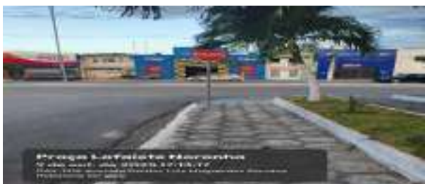
Praça Lafaete Noronha 9 de out. de 2025 17:15:17 1138 Avenida Doutor Lafaete Noronha Serrano Hidráulica Serrano