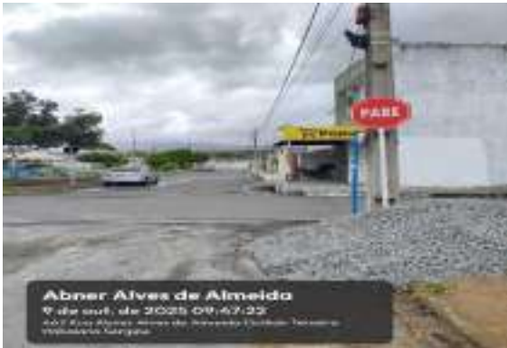
RUA ABNER ALVES DE ALMEIDA (LOT. PARAÍO DASERRA)