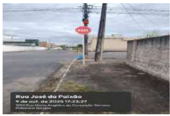
Rua José da Paixão 9 de out. de 2025 17:23:27 1540 Rua José da Paixão do Conjunto Serrano Hidráulica Serrano