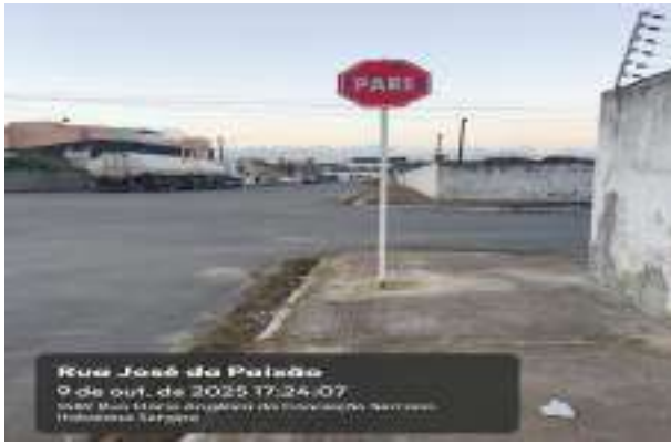
Rua José da Paixão 9 de out. de 2025 17:24:07 1540 Rua José da Paixão do Conjunto Serrano Hidráulica Serrano