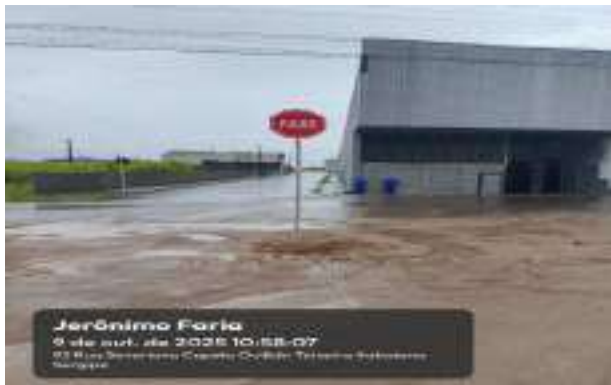
RUA JERONIMO FARIA (LOT. PARAÍO DASERRA)