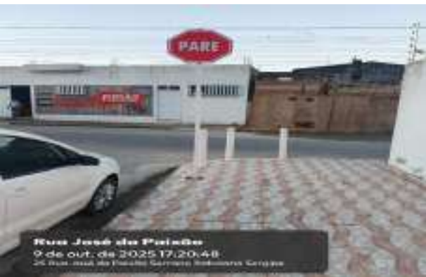
Rua José da Paixão 9 de out. de 2025 17:20:48 25 Rua José da Paixão Serrano Hidráulica Serrano