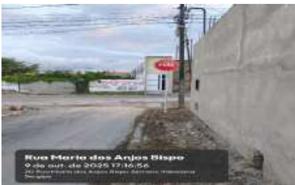
Rua Maria dos Anjos Bispo 9 de out. de 2025 17:16:56 20 Rua Maria dos Anjos Bispo Serrano Hidráulica Serrano