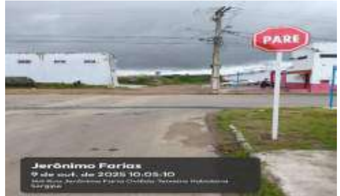
RUA JERONIMO FARIA (LOT. PARAÍO DASERRA)