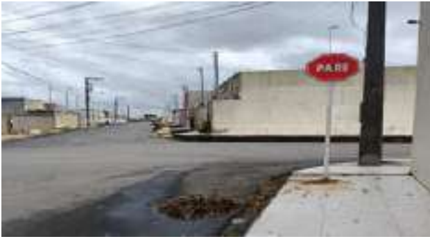
RUA JULIA MENDONÇA (LOT. PARAÍO DASERRA)