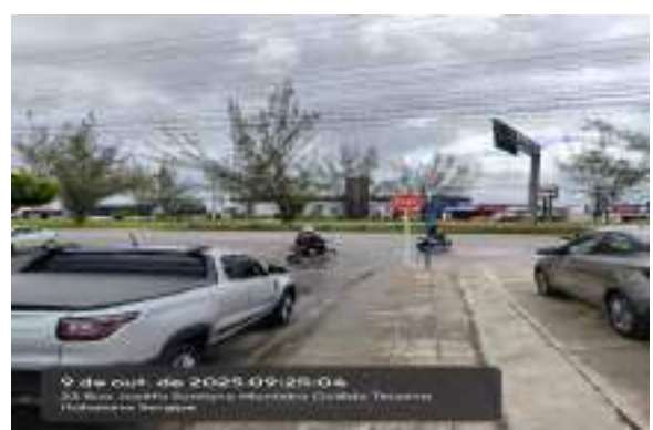
RUA JOSEFA SANTANA MONTEIRO (LOT. PARAÍO DASERRA)