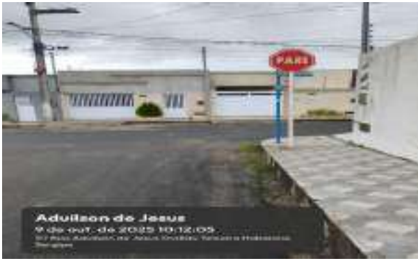
RUA ADUILSON DE JESUS (LOT. PARAÍO DASERRA)