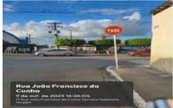
RUA JOÃO FRANCISCO DA CUNHA (CONJ. JOÃO PEREIRA)