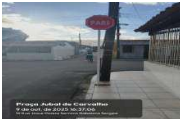
PRAÇA JUBAL DE CARVALHO (CONJ. JOÃO PEREIRA)