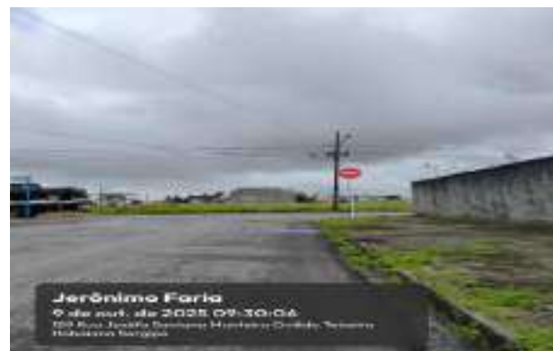
RUA JERONIMO FARIA (LOT. PARAÍO DASERRA)