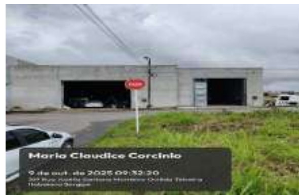
RUA CLAUDICE CORCINIO (LOT. PARAÍO DASERRA)