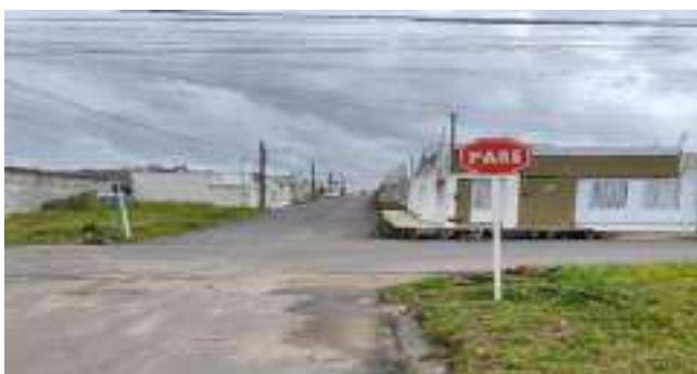
RUA FRANCISCO ALVES DE LIMA (LOT. PARAÍO DASERRA)