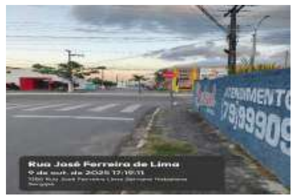
Rua José Ferreira de Lima 9 de out. de 2025 17:19:31 1150 Rua José Ferreira Lima Serrano Hidráulica Serrano