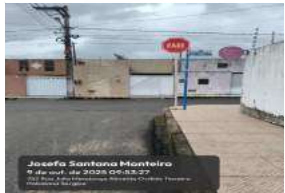
RUA JOSEFA SANTANA MONTEIRO (LOT. PARAÍO DASERRA)