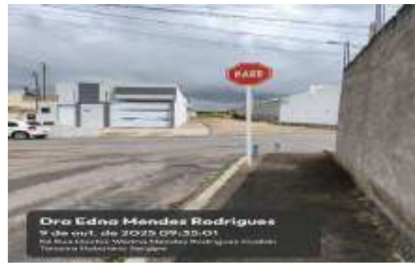
RUA WEDNA MENDES RODRIGUES (LOT. PARAÍO DASERRA)