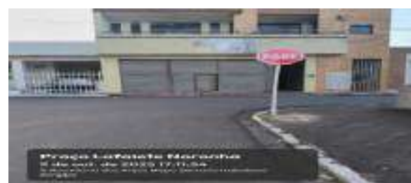
Praça Lafaete Noronha 9 de out. de 2025 17:14:04 1138 Avenida Doutor Lafaete Noronha Serrano Hidráulica Serrano