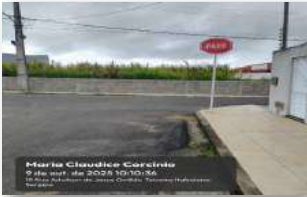
RUA CLAUDICE CORCINIO (LOT. PARAÍO DASERRA)