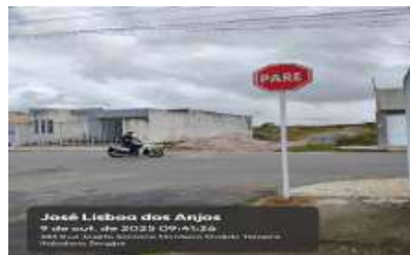
RUA JOSÉ LISBOA DOS ANJOS (LOT. PARAÍO DASERRA)