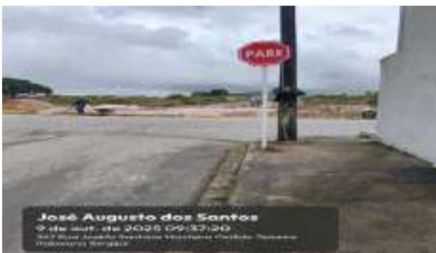
RUA JOSÉ AUGUSTO DOS SANTOS (LOT. PARAÍO DASERRA)