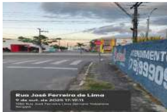
RUA JOSÉ FERREIRA LIMA (CONJ. JOÃO PEREIRA)