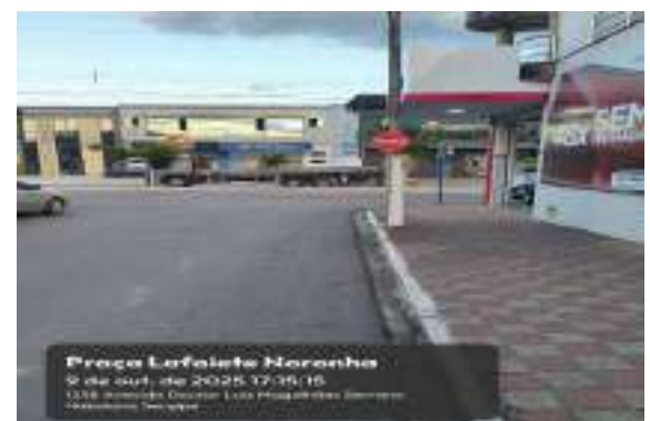
Praça Lafaete Noronha 9 de out. de 2025 17:16:16 1138 Avenida Doutor Lafaete Noronha Serrano Hidráulica Serrano