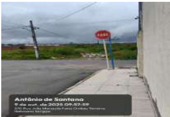
RUA JOSÉ ANTÔNIO DE SANTANA (LOT. PARAÍO DASERRA)