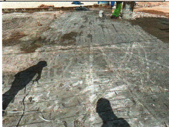
RUA ANTÔNIO FRANCISCO DA CUNHA