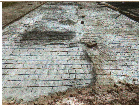
AV. CONSTRUTOR ANTÔNIO PEREIRA DE ANDRADE