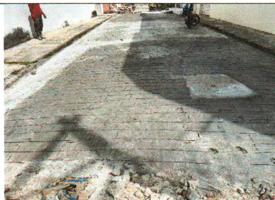
RUA ERCÍLIA COSTA DE OLIVEIRA