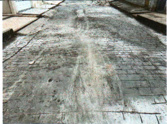
RUA ERCÍLIA COSTA DE OLIVEIRA