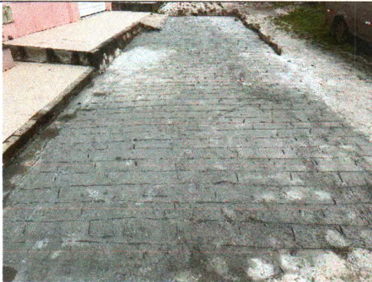
RUA ERCÍLIA COSTA DE OLIVEIRA