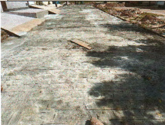
RUA ANTÔNIO FRANCISCO DA CUNHA