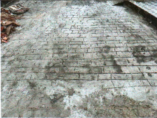
RUA ERCÍLIA COSTA DE OLIVEIRA