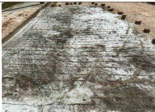
AV. CONSTRUTOR ANTÔNIO PEREIRA DE ANDRADE