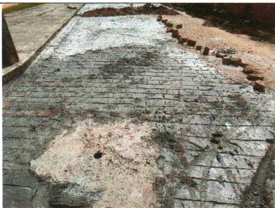
AV. CONSTRUTOR ANTÔNIO PEREIRA DE ANDRADE