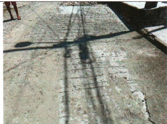
RUA JOSÉ ANTÔNIO DOS SANTOS