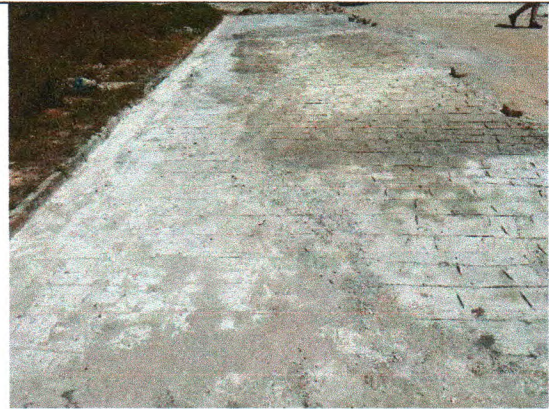
RUA PEDREIRO PAULO BATISTA DE MENEZES