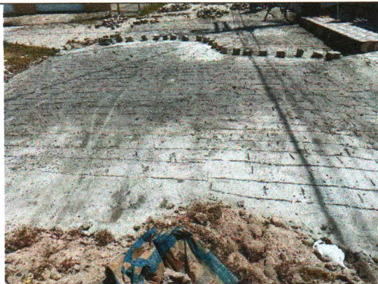
RUA JOSÉ ANTÔNIO DOS SANTOS