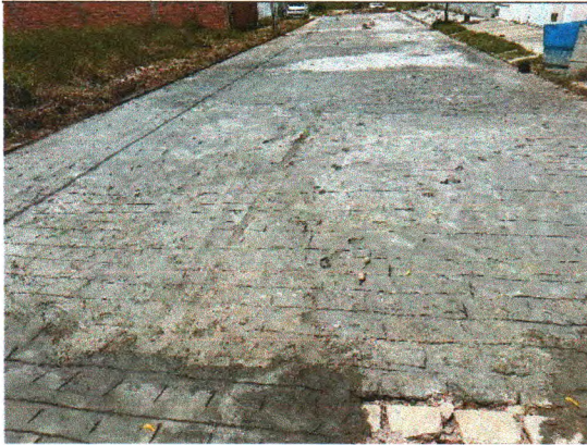
RUA PEDREIRO JOSÉ DIAS DE MENEZES