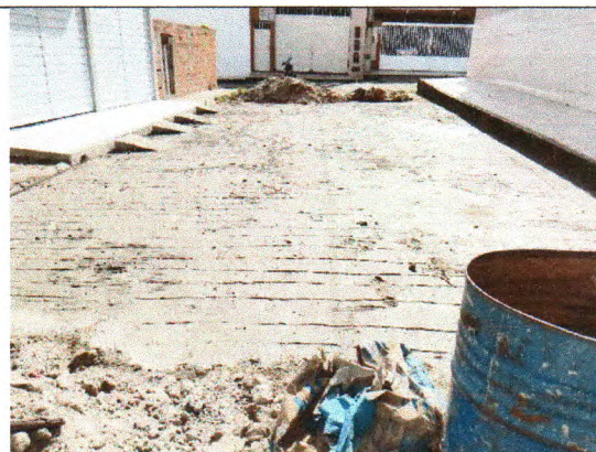
RUA ERCÍLIA COSTA DE OLIVEIRA