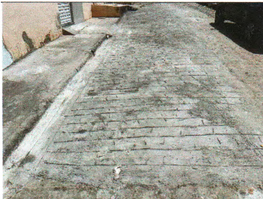
RUA JOSÉ ANTÔNIO DOS SANTOS