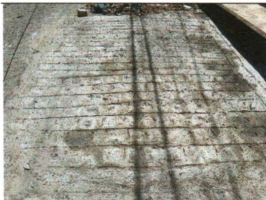
RUA JOSÉ ANTÔNIO DOS SANTOS