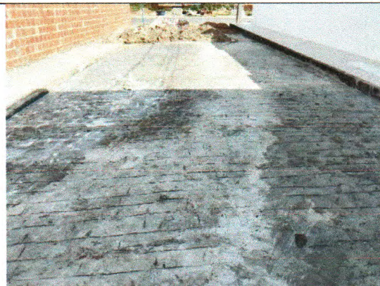
RUA ERCÍLIA COSTA DE OLIVEIRA