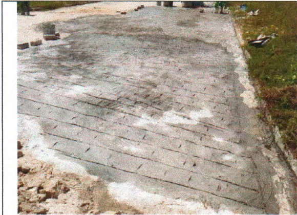
RUA PEDREIRO JOSÉ DIAS DE MENEZES