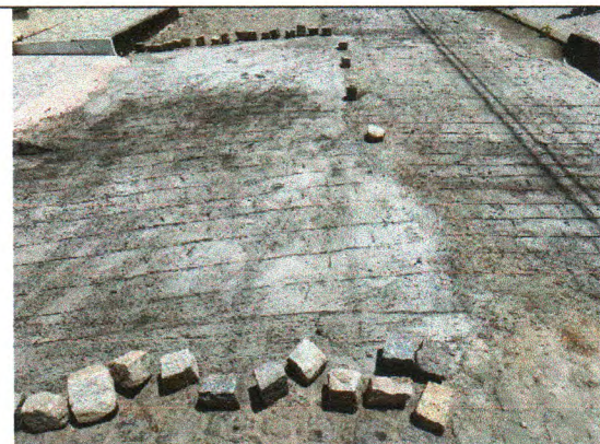
RUA JOSÉ ANTÔNIO DOS SANTOS