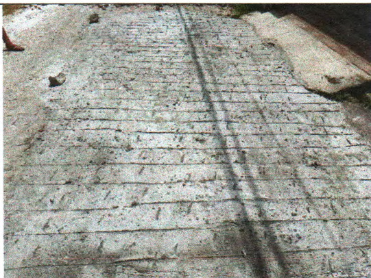
RUA JOSÉ ANTÔNIO DOS SANTOS