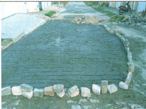
RUA CONSTRUTOR JOSÉ OLIVEIRA