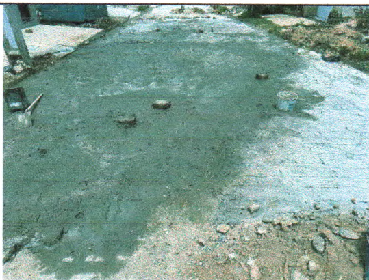
RUA PEDREIRO JOSÉ DIAS DE MENEZES