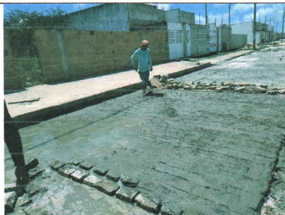
RUA CONSTRUTOR JOSÉ OLIVEIRA