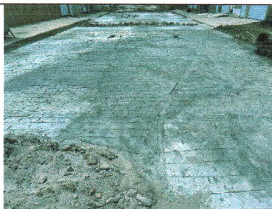
RUA JOSÉ ADEMAR DE CARVALHO SOBRINHO