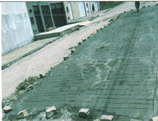
RUA CONSTRUTOR JOSÉ OLIVEIRA