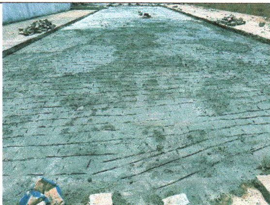
RUA PEDREIRO JOSÉ DIAS DE MENEZES