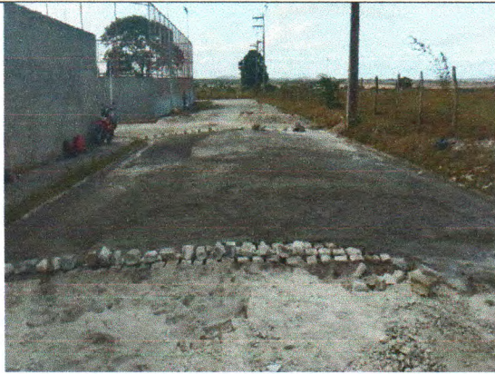
RUA BELARMINO JOSÉ DOS SANTOS