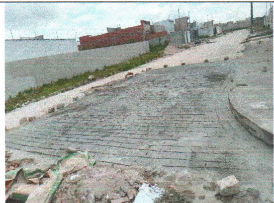
RUA JOSÉ ADEMAR DE CARVALHO SOBRINHO