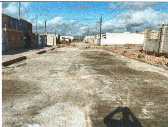
RUA JOSÉ ADEMAR DE CARVALHO SOBRINHO