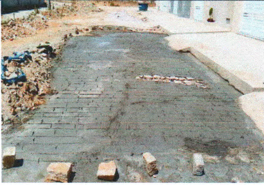
RUA JOSÉ ADEMAR DE CARVALHO SOBRINHO