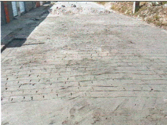
RUA BELARMINO JOSÉ DOS SANTOS