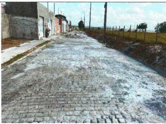
RUA BELARMINO JOSÉ DOS SANTOS