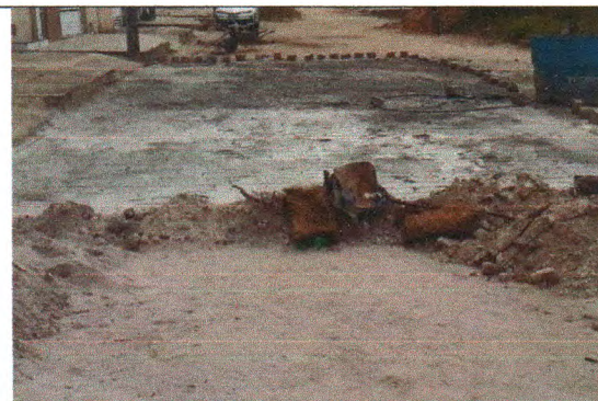
RUA JOSÉ ADEMAR DE CARVALHO SOBRINHO