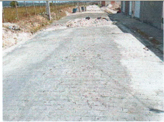
RUA BELARMINO JOSÉ DOS SANTOS