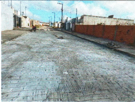
RUA JOSÉ PEDREIRO DIAS