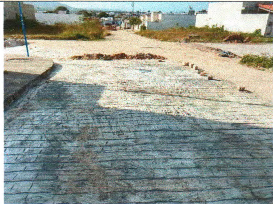
RUA CONSTRUTOR JOSÉ OLIVEIRA