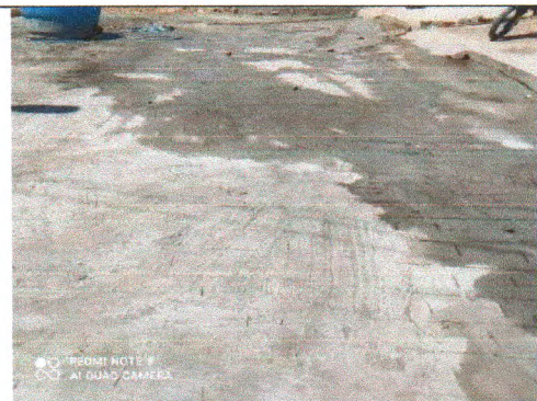
RUA JOSÉ ADEMAR DE CARVALHO SOBRINHO