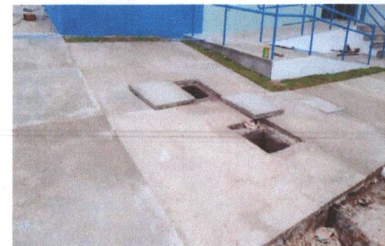
Execução Fossa e Filtro Anaeróbio e Piso em Concreto