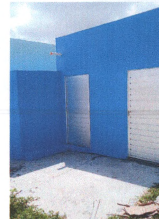
Execução de Piso em Concreto da Casa do Lixo