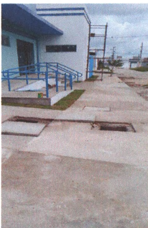
Execução de Piso em Concreto