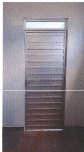
Execução de Porta Veneziana