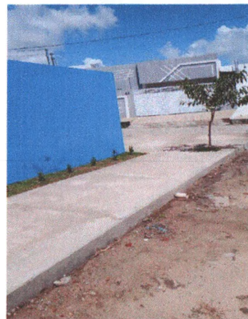
Execução de Piso em Concreto da Calçada