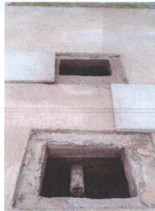
Execução de Fossa e Filtro Anaeróbio