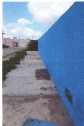
Execução de Piso em Concreto da Calçada