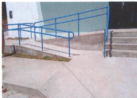
Execução e Corrimão, Piso em concreto e Grama