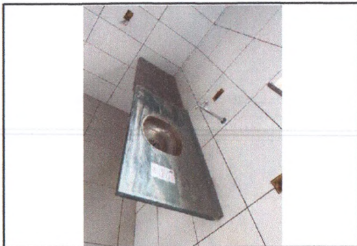
Execução das louças e metais 1