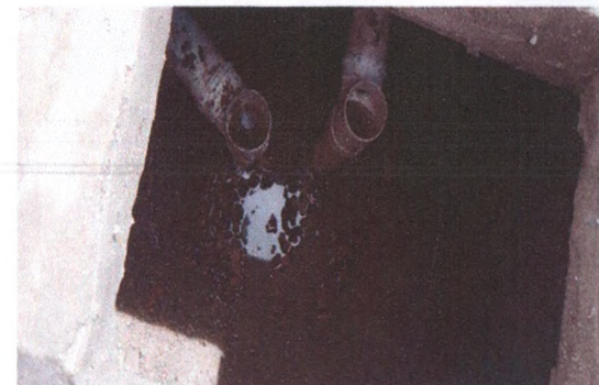
Execução de Fossa S ptica