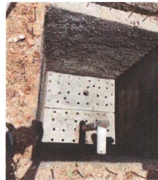
Execução de Filtro Anaeróbio