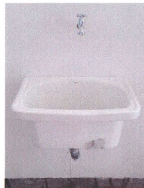
Execução de louças e metais 4