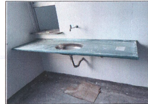
Execução das louças e metais 3