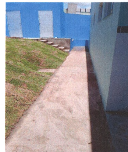
Execução de Piso em Concreto