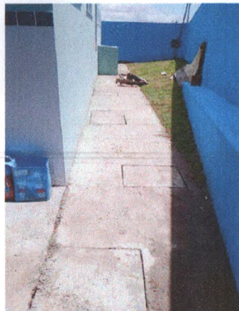
Execução Piso em Concreto