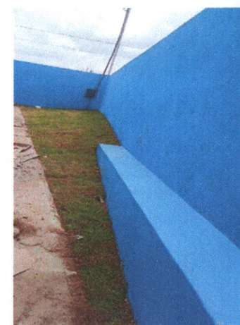
Execução de Grama na Lateral

CONCRET CONSTRUÇÕES E SERVIÇOS LTDA Vicente Natalias Rocha Bezerra Engenheiro Civil CREA - SE 2707034703