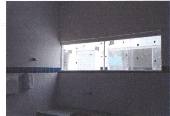
Execução em Esquadrias de Vidro 2