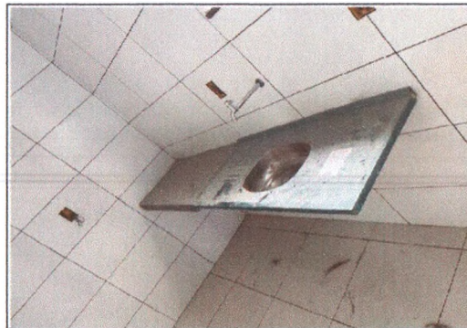
Execução das louças e metais 2