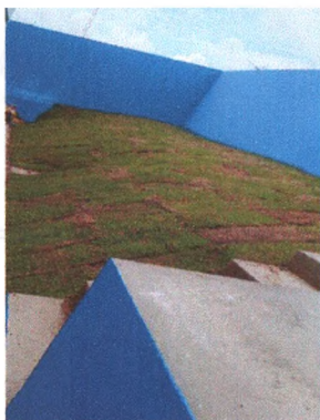
Execução de Grama 1