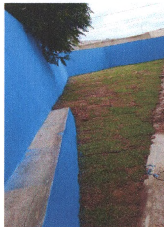
Execução de Grama na Lateral