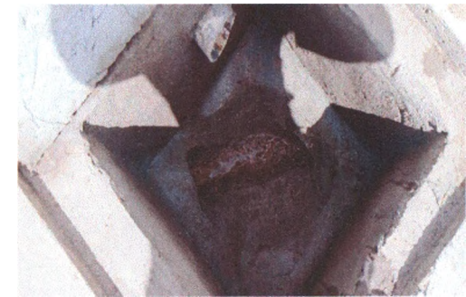
Execução de Caixa de Gordura