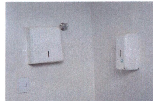
Execução de Porta Papel Toalha e Saboneteira