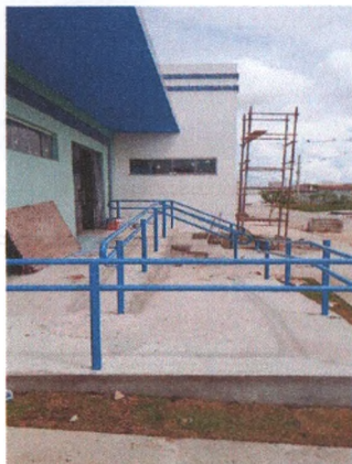
Execução Piso em Concreto e Concreto