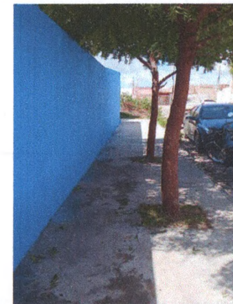
Execução de Piso em Concreto da Calçada

CONCRET CONSTRUÇÕES E SERVIÇOS LTDA Vicente Matheus Rocha Bezerra Engenheiro Civil CREA - SE 2707034703