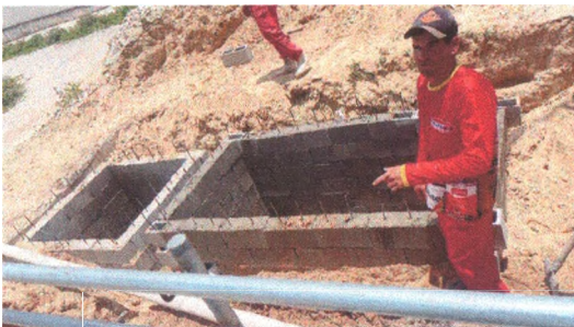
Execução de Fossa e Filtro Anaeróbio