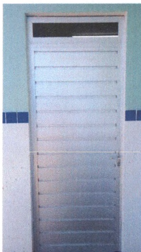
Execução de Porta Veneziana