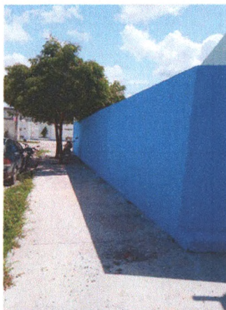
Execução de Piso em Concreto da Calçada