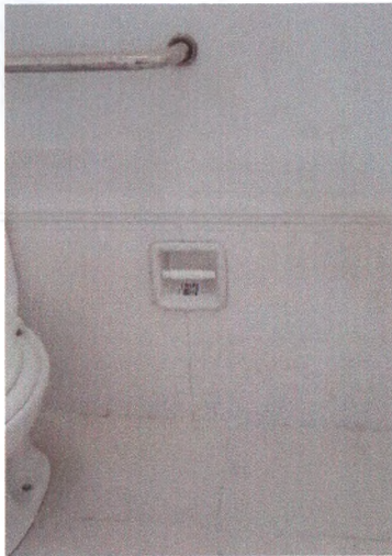
Porta Papel Higiênico