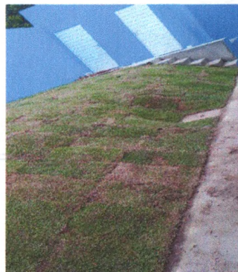
Execução de Grama 2