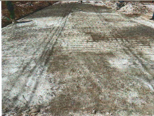
RUA BELARMINO JOSÉ DOS SANTOS