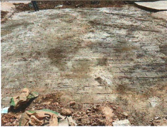
RUA JOSÉ ADEMAR DE CARVALHO SOBRINHO