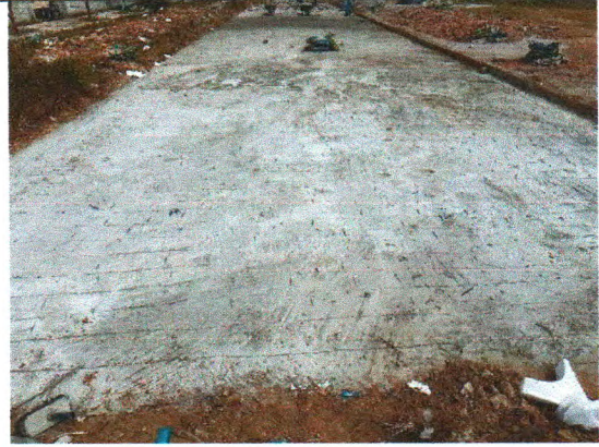
RUA ANTÔNIO FRANCISCO DA CUNHA