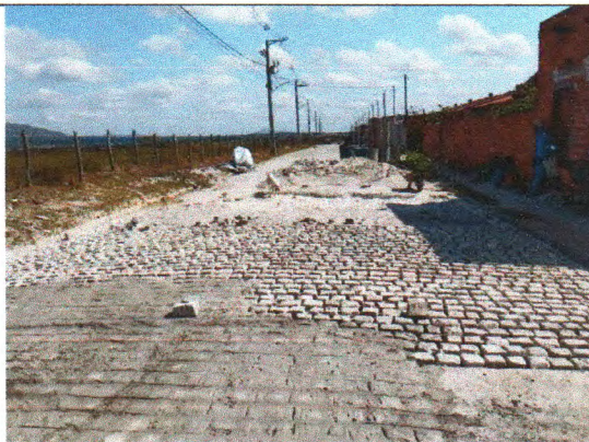
RUA BELARMINO JOSÉ DOS SANTOS