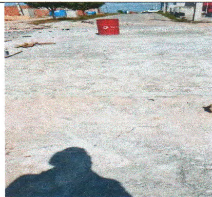
RUA SÃO JOÃO

MAYKON DOUGLAS SANTOS SANTANA:06641 211525 Assinado de forma digital por MAYKON DOUGLAS SANTOS SANTANA:0664121152 5 Dados: 2024.10.10 16:09:10 -03'00'