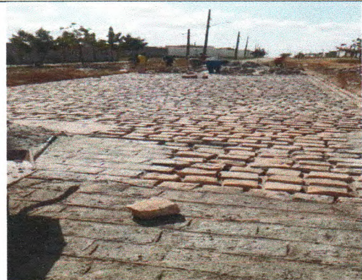
RUA ANTÔNIO FRANCISCO DA CUNHA