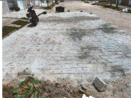
RUA JOSÉ GENTIL DE OLIVEIRA