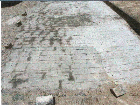
RUA JOSÉ ADEMAR DE CARVALHO SOBRINHO