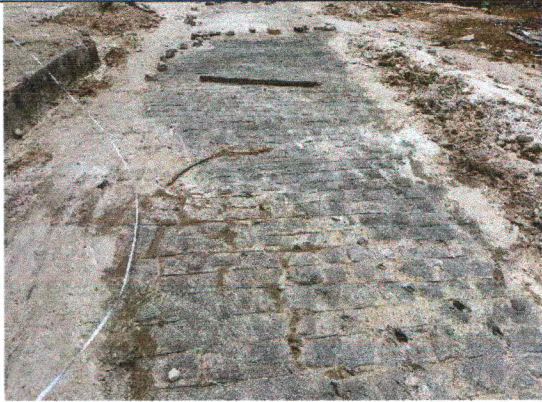
RUA PROFESSOR PAULO PEREIRA LIMA