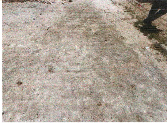
RUA PROFESSOR PAULO PEREIRA LIMA