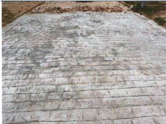
RUA ANTÔNIO FRANCISCO DA CUNHA