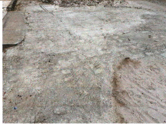
RUA MANOEL FRANCISCO DA CUNHA