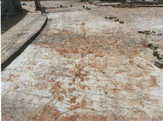
RUA JOSEPHA MELO NOVAES