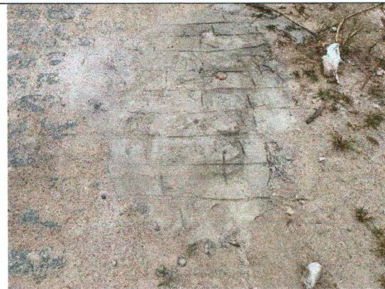
AV. ANTÔNIO VALTER DOS SANTOS