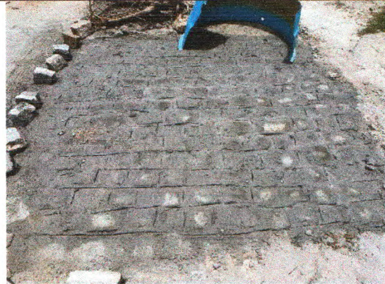
RUA PEDRO TAVARES DE JESUS