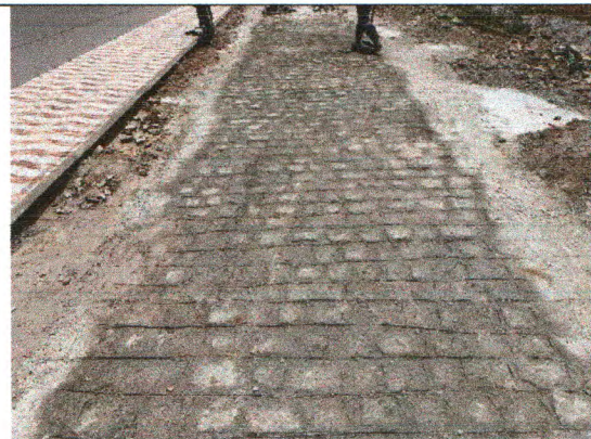
RUA PEDRO TAVARES DE JESUS