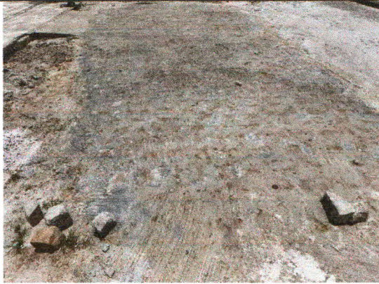
RUA MANOEL FRANCISCO DA CUNHA