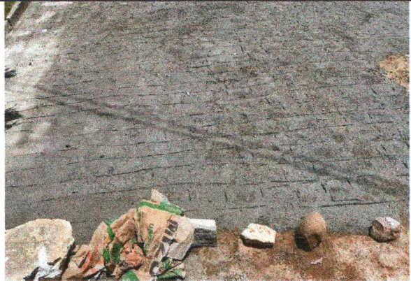
RUA TEREZINHA VALADARES BARRETO