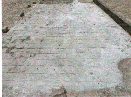
RUA JOSÉ ADEMAR DE CARVALHO SOBRINHO