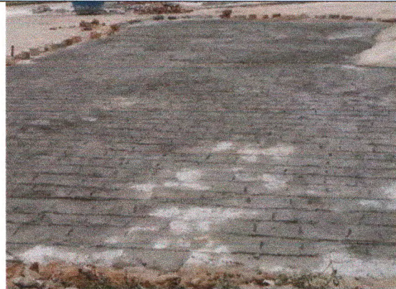
RUA JOSÉ ADEMAR DE CARVALHO SOBRINHO