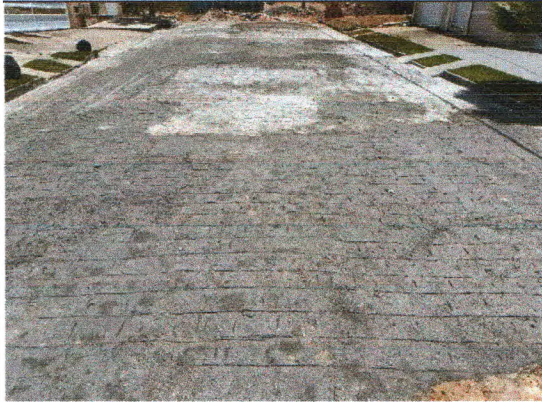
RUA TEREZINHA VALADARES BARRETO