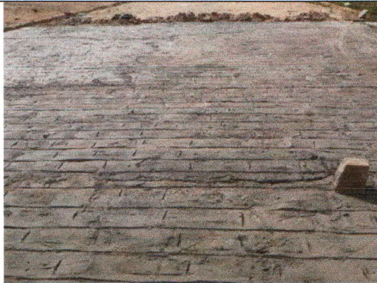
RUA PEDREIRO PAULO BATISTA DE MENEZES