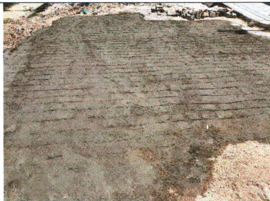
RUA PEDRO TAVARES DE JESUS