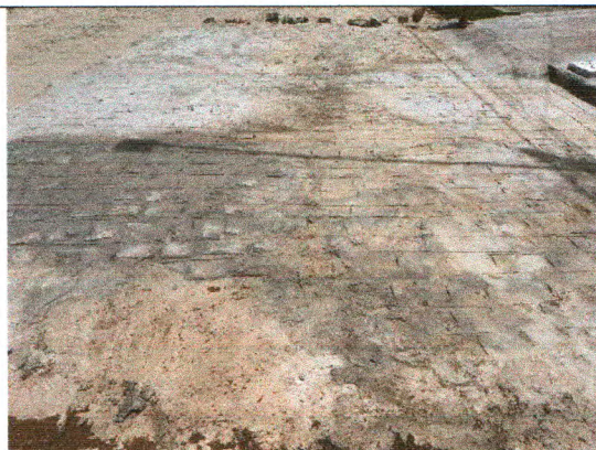
RUA JOSÉ GENTIL DE OLIVEIRA