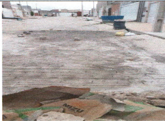
RUA JOSÉ ELSON DA SILVA MELO