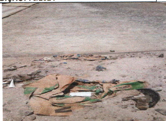
RUA MARIA DE LOURDES AQUINO SANTOS