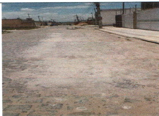
RUA MARIA DE LOURDES AQUINO SANTOS