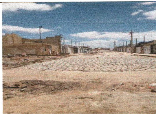
RUA JOSÉ ELSON DA SILVA MELO