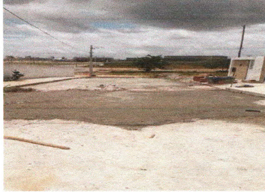
RUA JOSÉ ELSON DA SILVA MELO