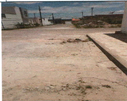
RUA JOSÉ MOISES SANTANA