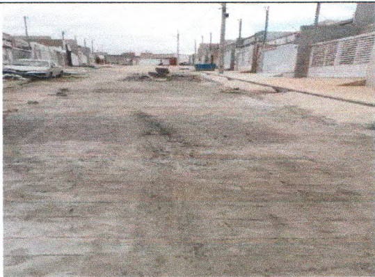
RUA JOSÉ ELSON DA SILVA MELO