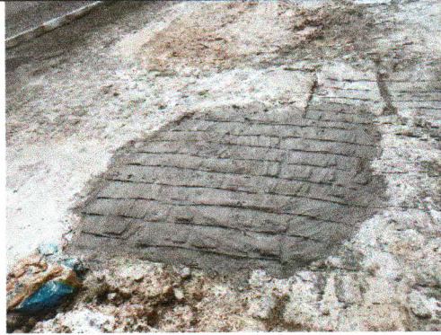
TRV. FRANCISCO DE MENDONÇA