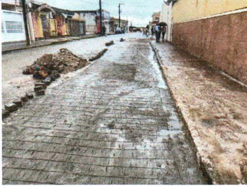
RUA LOURENÇO ALVES DOS SANTOS