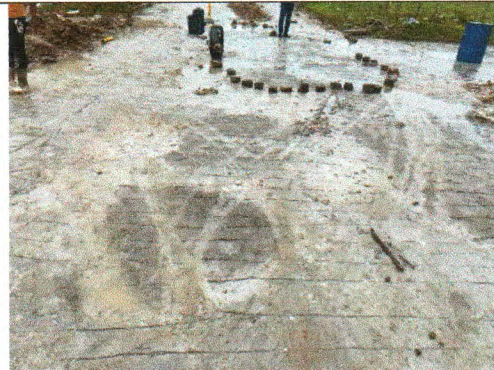
RUA HELENO LUIZ DA SILVA