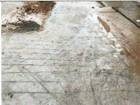
RUA HELENO LUIZ DA SILVA