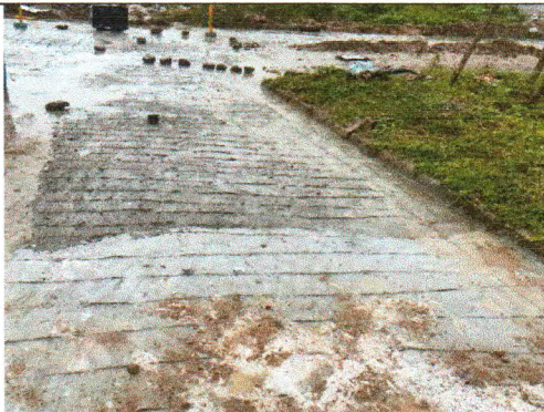
RUA HELENO LUIZ DA SILVA