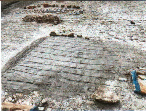
TRV. FRANCISCO DE MENDONÇA