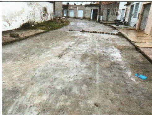
RUA VICENTE FERREIRA SOUZA