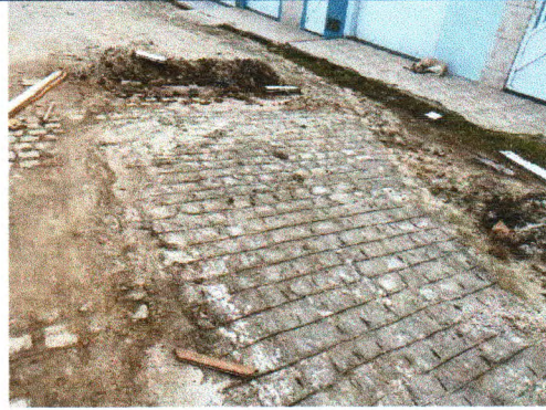
RUA PEDRO TAVARES DE JESUS