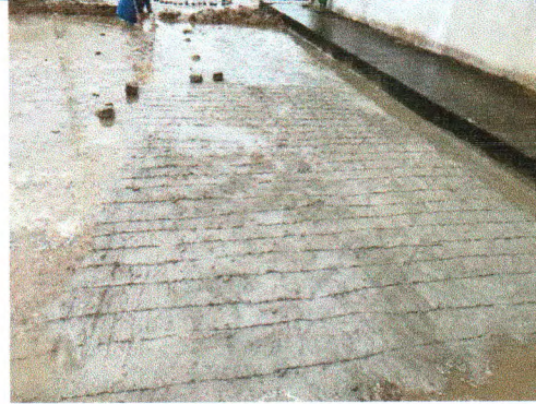
RUA HELENO LUIZ DA SILVA