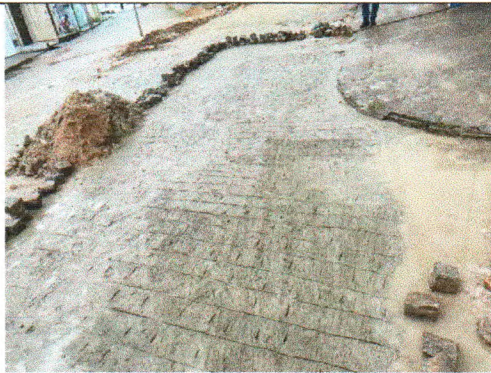
RUA VESTA MARIA DE GÓIS