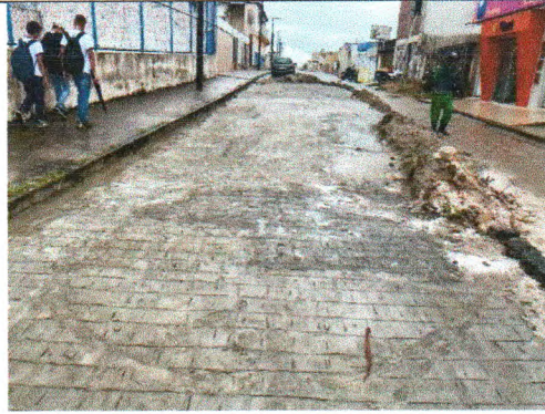
RUA LOURENÇO ALVES DOS SANTOS