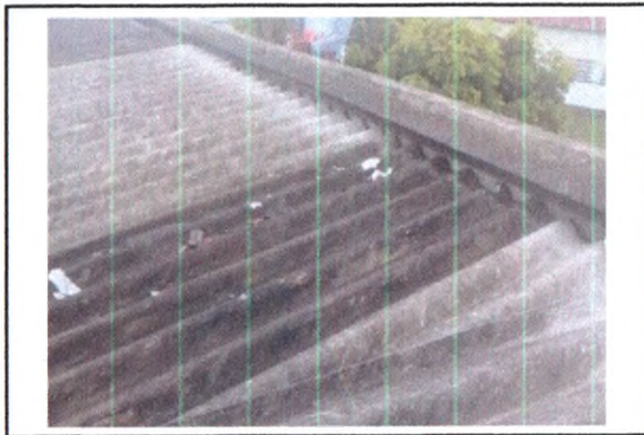
REVISÃO EM TELHADO DE FIBROCIMENTO