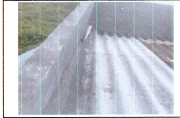
REVISÃO EM TELHADO DE FIBROCIMENTO