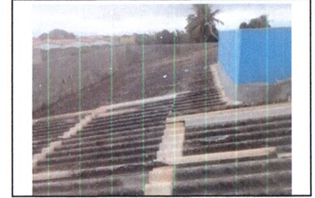
REVISÃO EM TELHADO DE FIBROCIMENTO