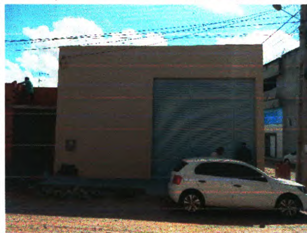
Foto 1. Vista da fachada frontal do imóvel avaliando.