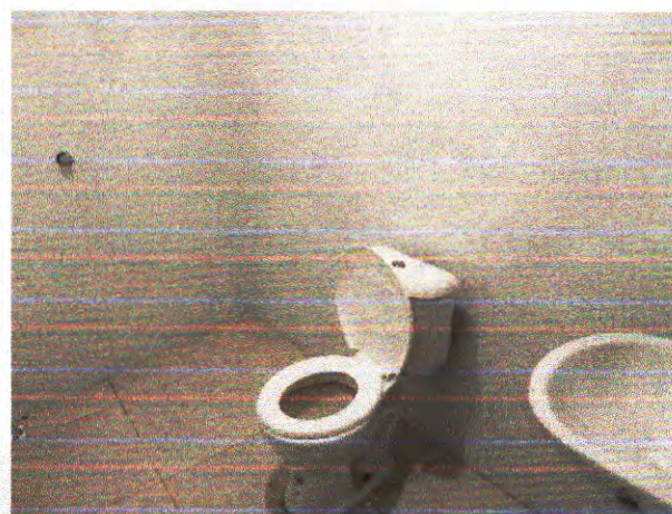
Foto 4. Vista do banheiro.