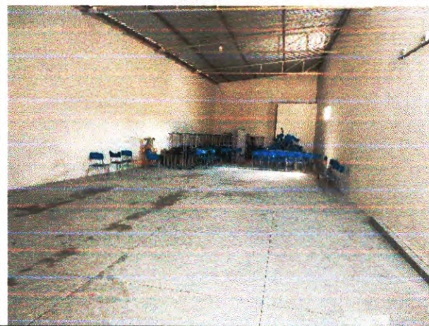
Foto 3. Vista do galpão.