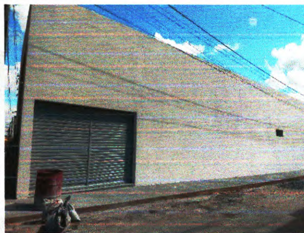
Foto 2. Vista da fachada lateral do imóvel.