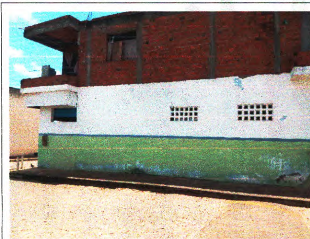
Foto 1. Vista da fachada frontal do imóvel avaliando.