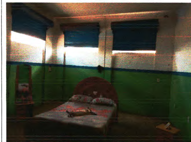
Foto 3. Vista de uma sala.