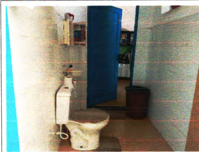
Foto 5. Vista do banheiro.