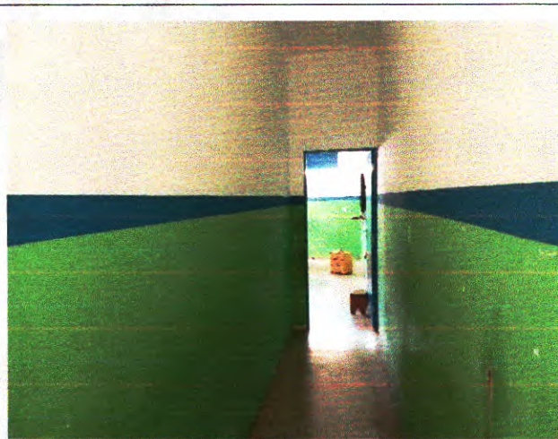
Foto 2. Vista do corredor.