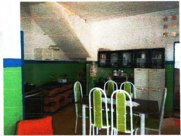
Foto 6. Vista da cozinha.