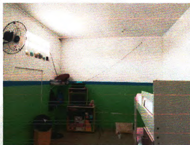
Foto 4. Vista de uma sala.