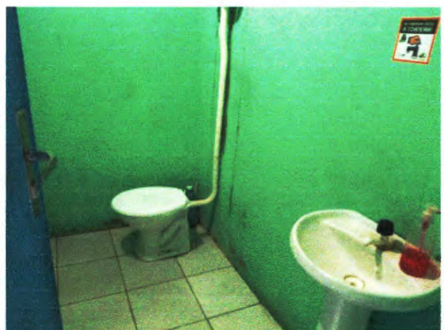
Foto 7. Vista de um banheiro.