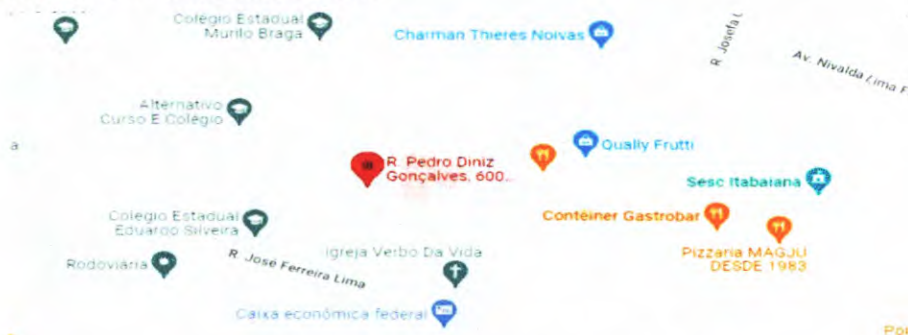
Figura 1- Localização do imóvel.