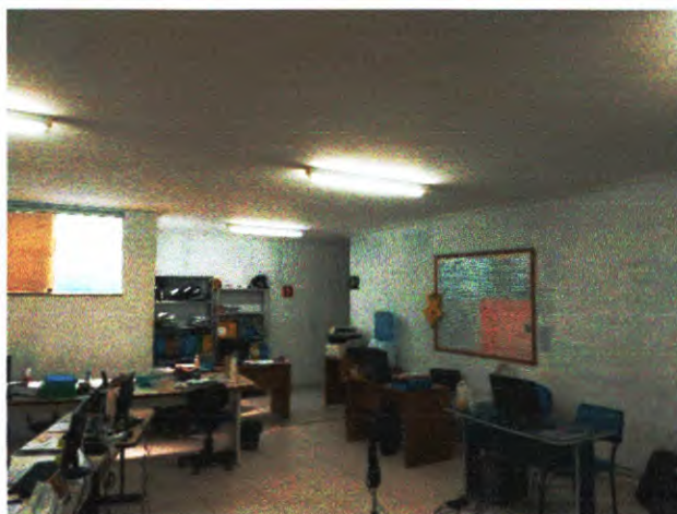
Foto 6. Vista de uma sala.