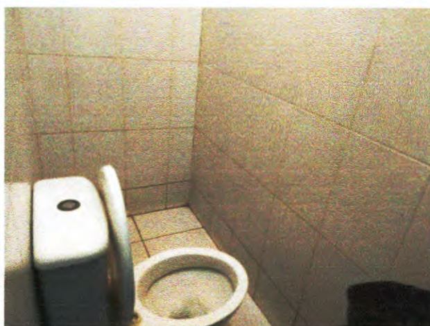
Foto 8. Vista de um banheiro.