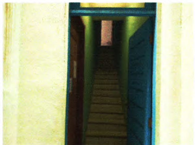
Foto 5. Vista da escada.