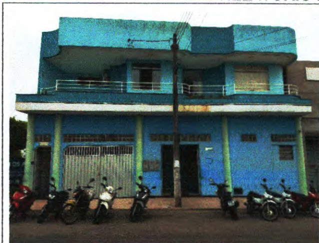
Foto 1. Vista da fachada do imóvel avaliando.