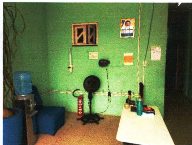
Foto 2. Vista da recepção.