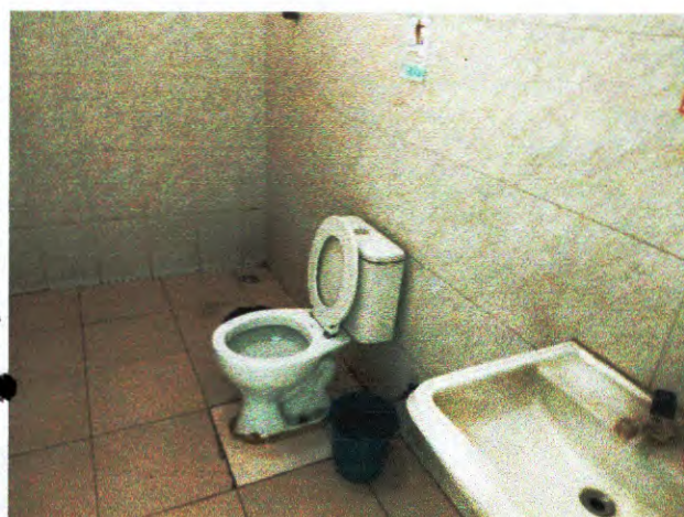
Foto 4. Vista de um banheiro.