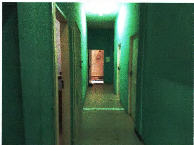
Foto 3. Vista do corredor.