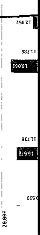
MEDIA/MEDIANA DE PREÇOS POR PERÍODO