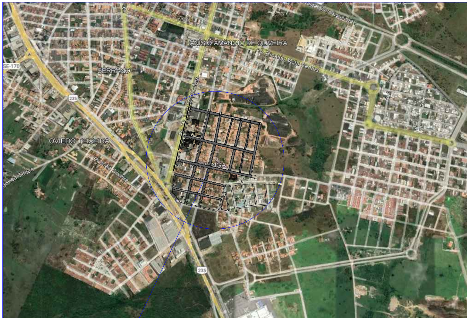
LOCALIZAÇÃO DO BAIRRO MARIANGA