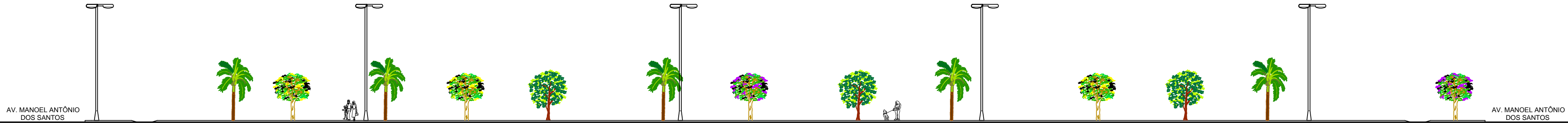
2 ELEVÇÃO - CANTEIRO 03 REVITALIZAÇÃO DO CANTEIRO CENTRAL DA AV. MANOEL ANTÔNIO DOS SANTOS ESC.: 1/250