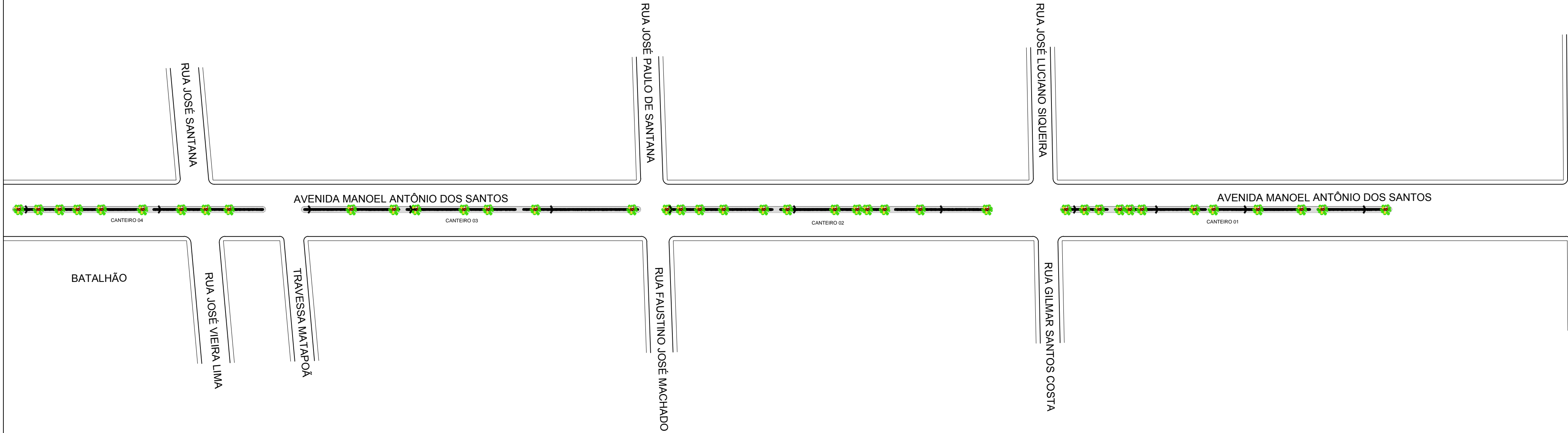
1 PLANTA BAIXA LEVANTAMENTO - LOCALIZAÇÃO REVITALIZAÇÃO DO CANTEIRO CENTRAL DA AV. MANOEL ANTÔNIO DOS SANTOS ESC.: 1/1000