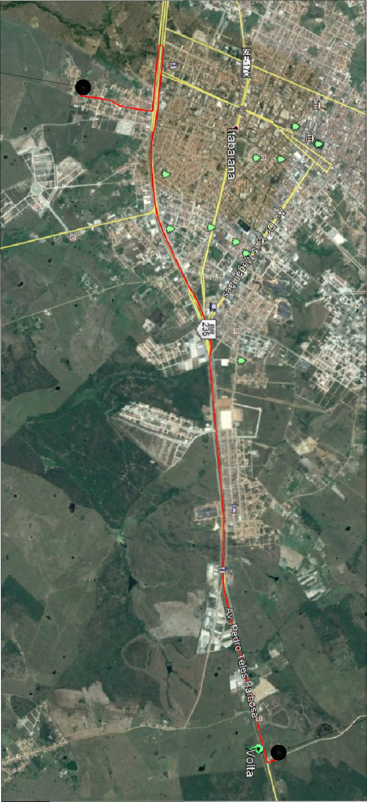
LOCALIZAÇÃO DAS RUAS A SEREM PAVIMENTADAS