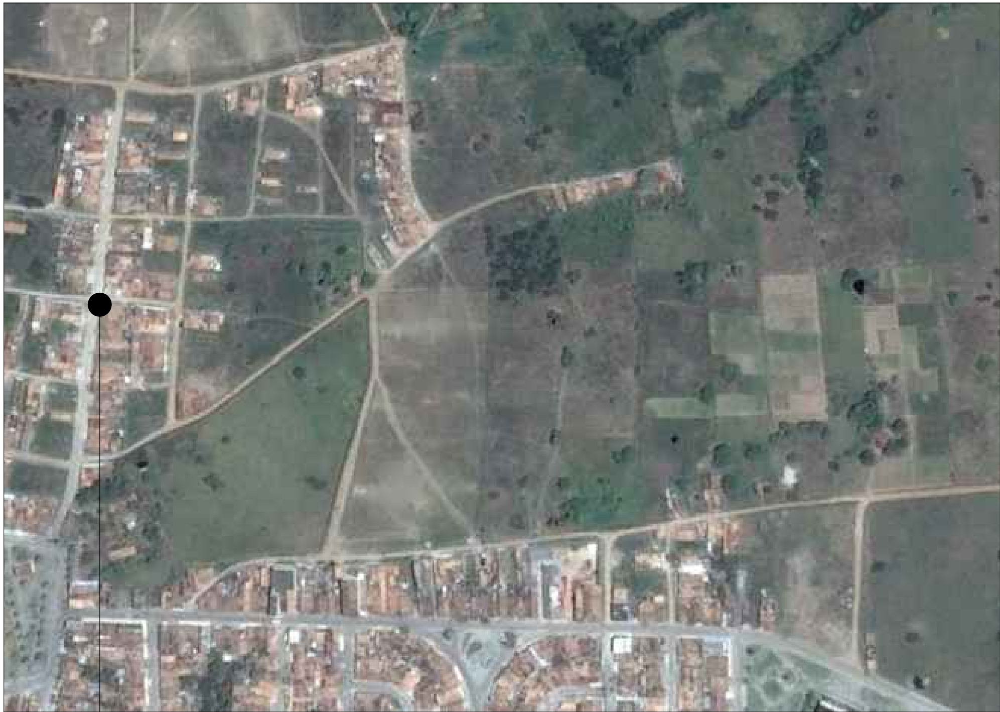
LOCALIZAÇÃO DAS RUAS A SEREM PAVIMENTADAS