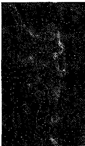
Leitte na abertura da Copa do Mundo FIFA 2014.

Em 28 de janeiro de 2013, a Universal Music lança uma coletânea digital com sucessos da Claudia Leitte e do Babado Novo intitulada de Extravase!. [89] Em 7 de junho de 2013 é lançada a canção "Quer Saber?", com a participação do cantor Thiaguinho. Em 3 de agosto de 2013 grava o terceiro DVD na Arena Pernambuco, em Recife, durante o festival O Maior Show do Mundo, [90] que viria a ser lançado em 14 de janeiro de 2014 sob o título de Axemusic - Ao Vivo, o álbum alcançou o primeiro lugar nas paradas do iTunes Brasil, estreou em segundo na parada musical da ABPD e esgotou a primeira tiragem em menos de 24 horas. O álbum trazia a participação de artistas como Thiaguinho, Wesley Safadão, Naldo Benny, Luiz Caldas, Wanessa, Armandinho e Nação do Maracatu Porto Rico. [91] O álbum vendeu cerca de 123.000 cópias no Brasil durante o ano de 2014, sendo um dos 25 mais vendidos no país no mesmo ano. [92][93] As canções Claudinha Bagunceira, Tarraxinha e Dekolê foram lançadas como singles do álbum. [94][95] Durante uma ação publicitária para as lâminas Gillette Vênus da P&g, Claudia lançou a canção Deusas do Amor com Ivete Sangalo. [96] Ambas receberam o cachê de R$ 1,5 milhões. [97] A canção vendeu mais de 50 000 cópias no Brasil, sendo certificada com Disco de Ouro. [98]