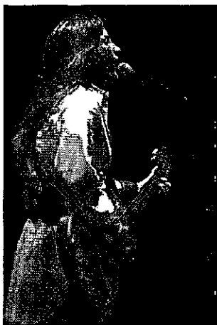
Leitte em apresentação (2005).