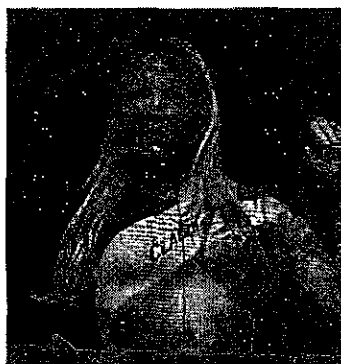
Leitte apresentando-se, na festa Combatchy , em São Paulo (2017).

Em outubro é anunciado que estaria deixando a Som Livre. [104] Logo após promove sua produtora, a 2T's Entretenimento, à selo independente, e lança seu primeiro EP, intitulado Sette . [105] Para promovê-lo, " Matimba " [106] foi escolhida como o primeiro single do álbum, alcançando a terceira posição na parada musical regional de Salvador da Billboard Brasil. [107] Uma versão remix da canção " Matimba " foi lançada com participações dos rappers Big Sean e MC Guimê. [108] Ainda em 2014, Claudia Leitte ganhou o troféu Melhores do Ano na categoria "melhor cantora". [109] Claudia foi eleita uma das principais protagonistas de 2014 em uma lista da " Veja São Paulo ", ganhando destaque na capa da revista. [110] Durante o ano de 2014, Claudia permaneceu oito semanas no ranking mundial Social 50 da Billboard, alcançando a 19ª posição como pico. [111] Dando continuidade a sua parceria com o Zumba Fitness, Claudia lançou a canção Portuñol como single promocional junto com um videoclipe em 5 de janeiro de 2015. [112] Já em 22 de janeiro, foi lançada " Prontas pra Divar ", single promocional gravado em parceria com Ivete Sangalo e produzida por Carlinhos Brown para mais uma ação publicitária das lâminas Gillette Vênus. [113] A faixa alcançou a segunda posição na parada musical regional de Salvador da Billboard Brasil. [114]