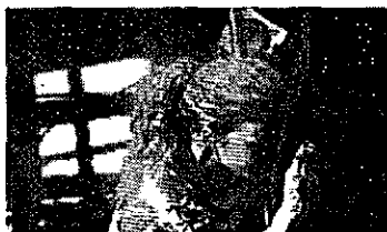
Leitte em um bloco carnavalesco de Salvador (2012).