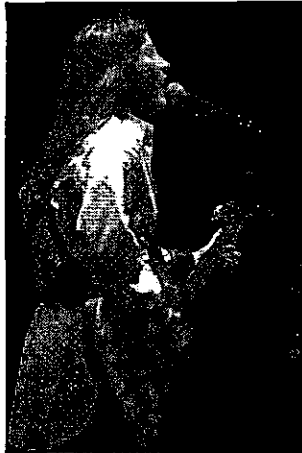
Leitte em apresentação (2005).