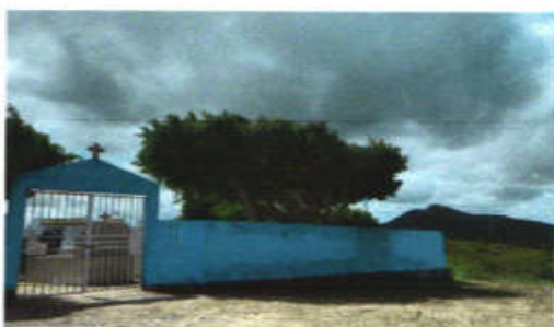
Entrada do Cemitério

1.3.5-Cemitério da Ribeira- apesar de não ser comum no Brasil, em países como Argentina a visitação a cemitérios é comum, aqui em Itabaiana a visita ao cemitério da Ribeira pode ser bastante atrativa pelo diferencial que apresenta. Por se localizar em um ponto alto do povoado, o turista que visita o ponto consegue apreciar a bela de visão de serras e povoados vizinhos, contando ainda com o contraste do paredão de rochas escuras que delimitam o tamanho do cemitério.