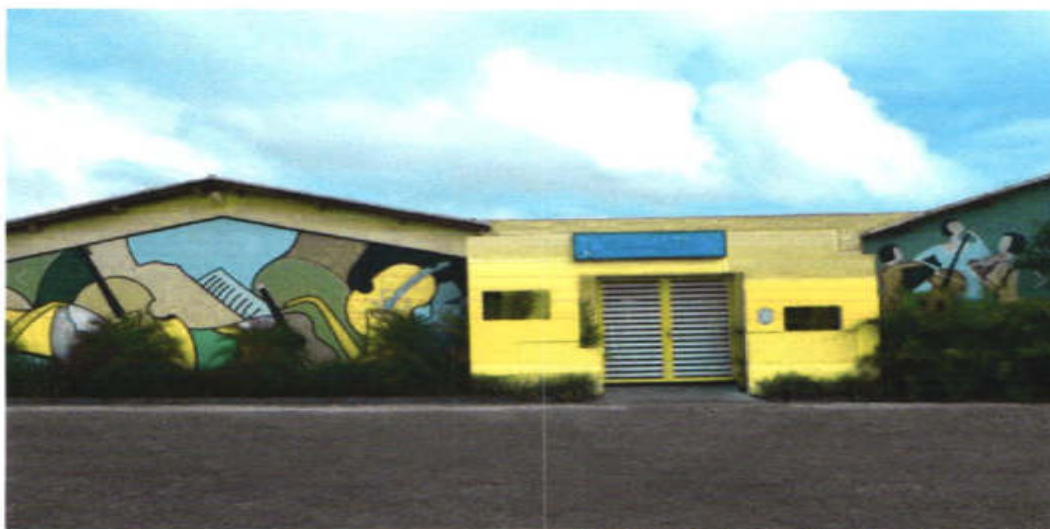
Instituto de Música Maestro João de Matos