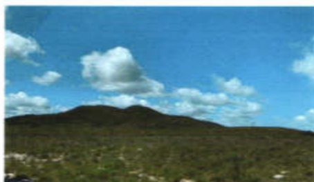
Serra do Cajueiro