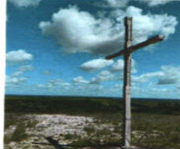
Cruzeiro do Século