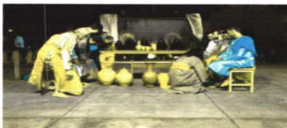
A encenação da Paixão de Cristo, na Praça do Povoado Magabeira 14

A referida praça teve sua construção iniciada no ano de 2008 e foi entregue a população no ano de 2014, dando origem a uma praça-teatro, onde ocorre a apresentação.