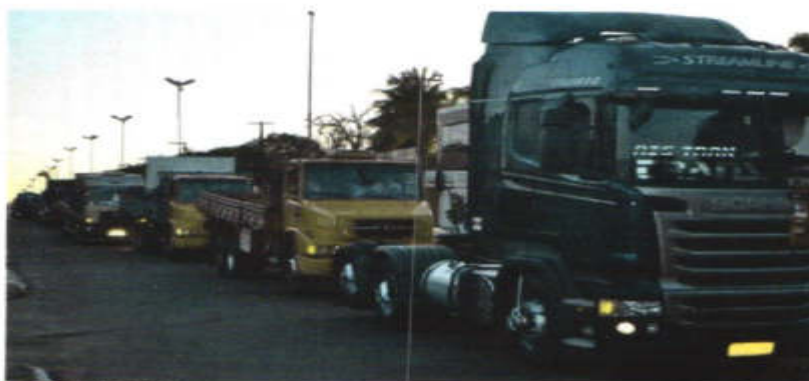
Alvorada do Caminhoneiro

Como Itabaiana tem posição estratégica no que diz respeito ao transporte de cargas para a região Nordeste, esse tipo de serviço é o motor da economia local. Os caminhões movimentam dinheiro para a cidade, geram empregos e têm ajudado a elevar o padrão de vida de toda a população.