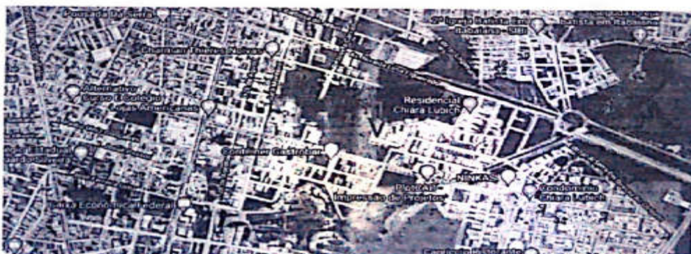
Figura 1. Localização do imóvel avaliando, Google Maps.

O imóvel objeto de estudo da presente avaliação localiza-se na Rua Maria Oliveira Mendonça, Bairro Anísio Amâncio de Oliveira, Itabaiana-SE. Tendo como referência de confrontante o SESC. A planta de localização e o memorial estão anexas ao processo.