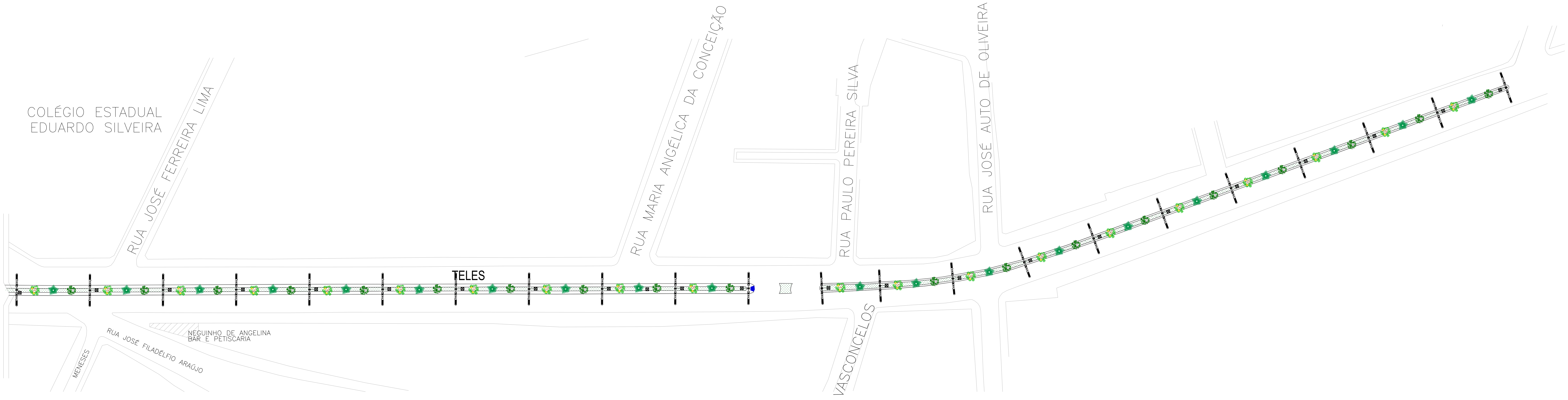
1 PLANTA BAIXA - LAYOUT REVITALIZAÇÃO DO CANTEIRO CENTRAL DA AV. ENGENHEIRO CARLOS REIS E AV. MANOEL FRANCISCO TELES ESC.: 1/500