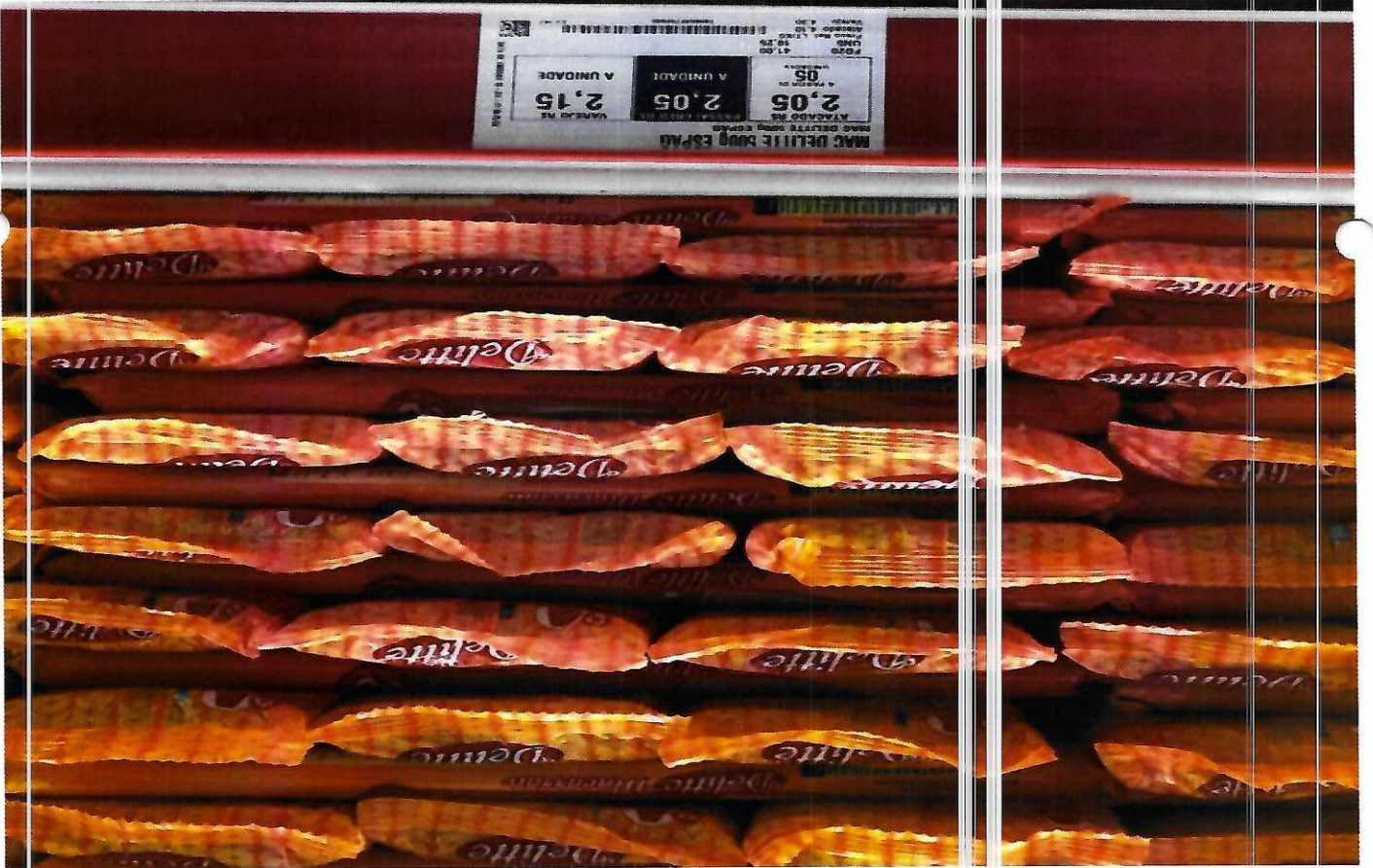
5. MACARRÃO - 500G (DELITTE)