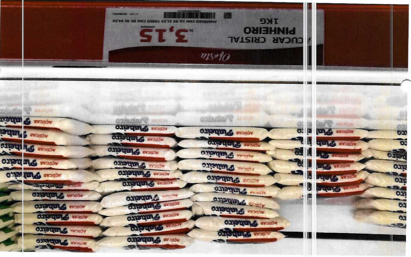
1. AÇÚCAR CRISTAL - (PINHEIRO)