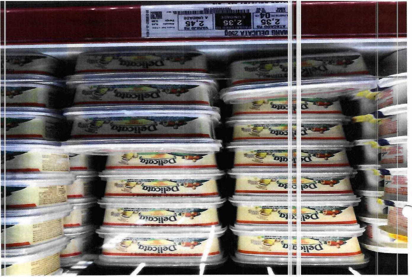
6. MARGARINA VEGETAL COM SAL - 250G (DELICATA)