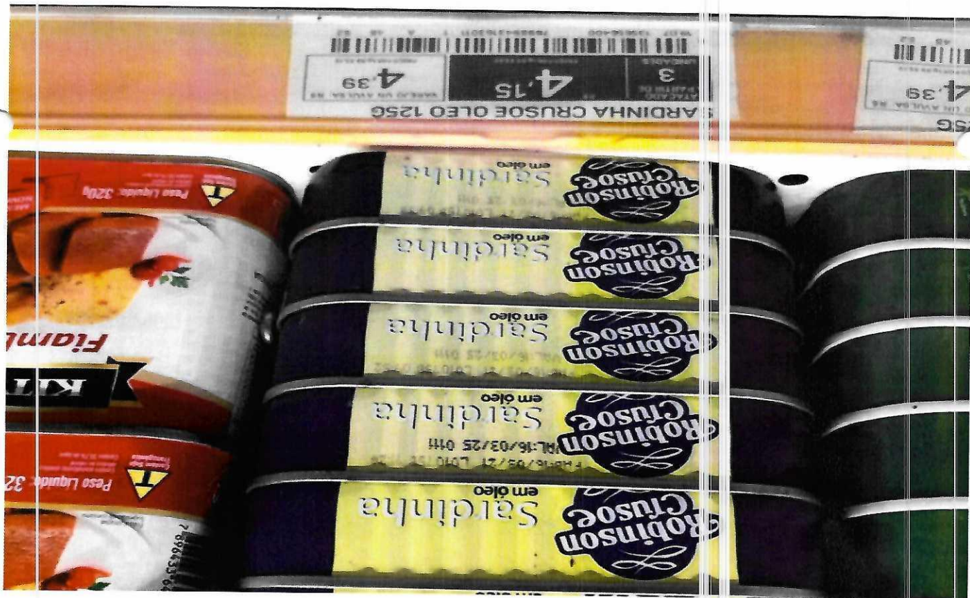
3. SARDINHA - 125g (ROBINSON CRUSOE)