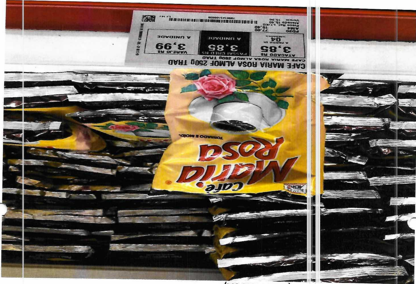
2. CAFÉ EM PÓ - 250G (MARIA ROSA)