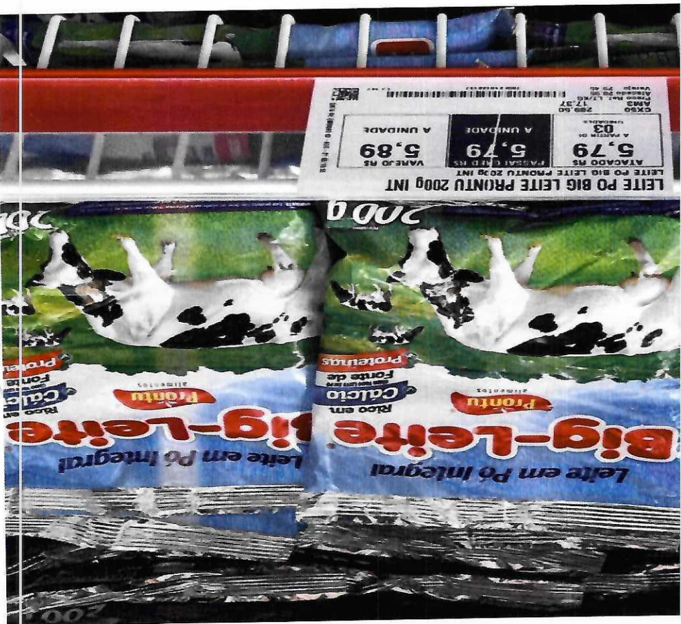
4. LEITE EM PÓ INTEGRAL - 200G (BIG-LEITE)