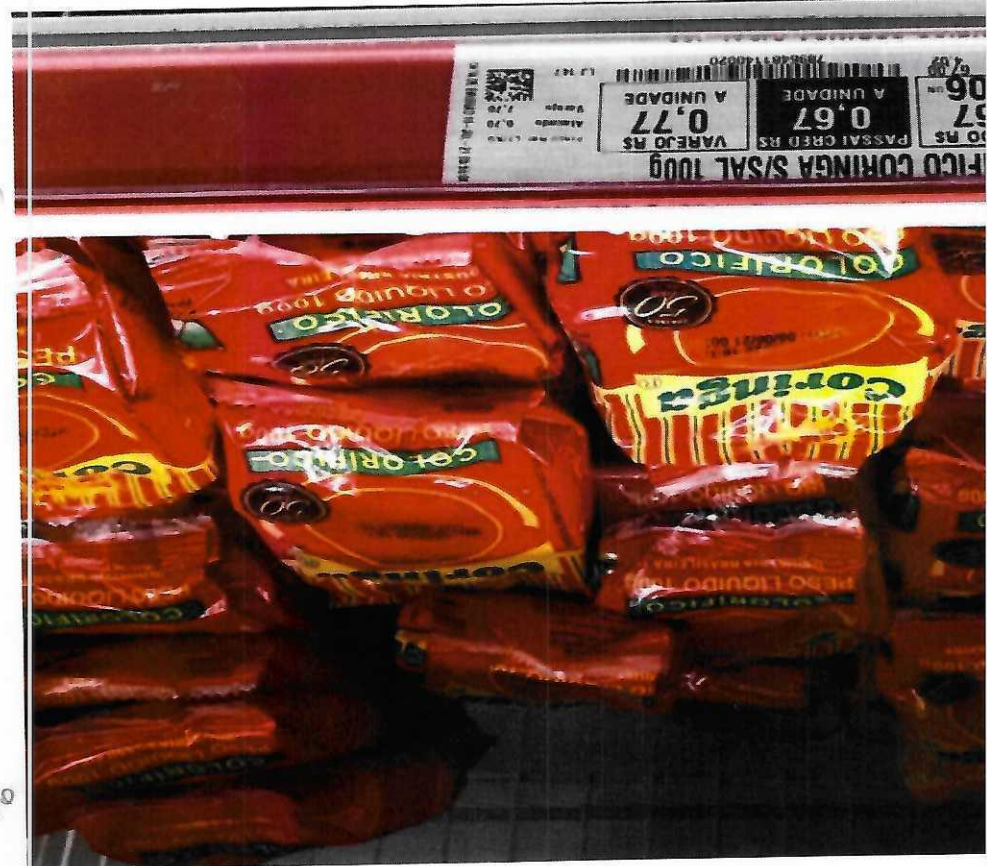
3. COLORÍFICO EM PÓ - 100G (CORINGA)