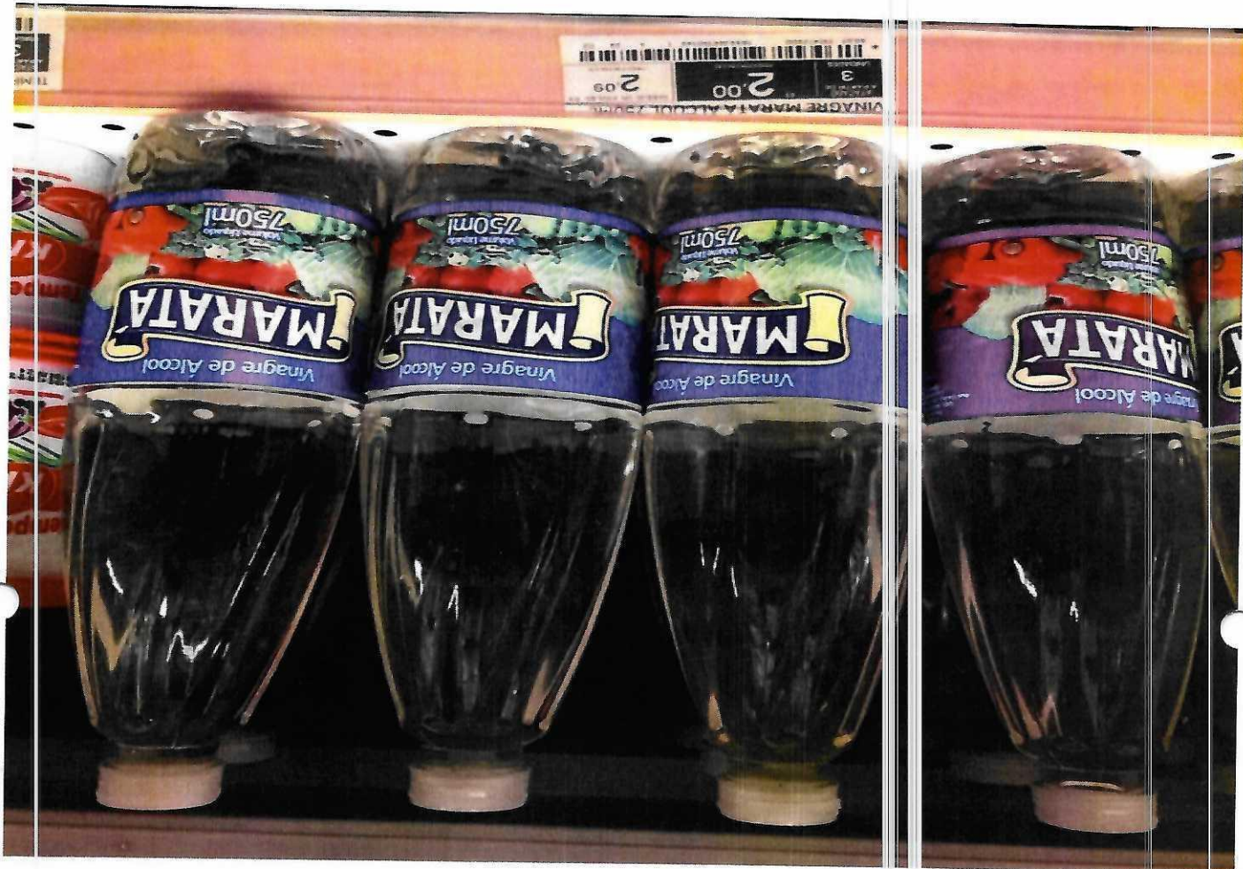
4. VINAGRE - 750M (MARATA)