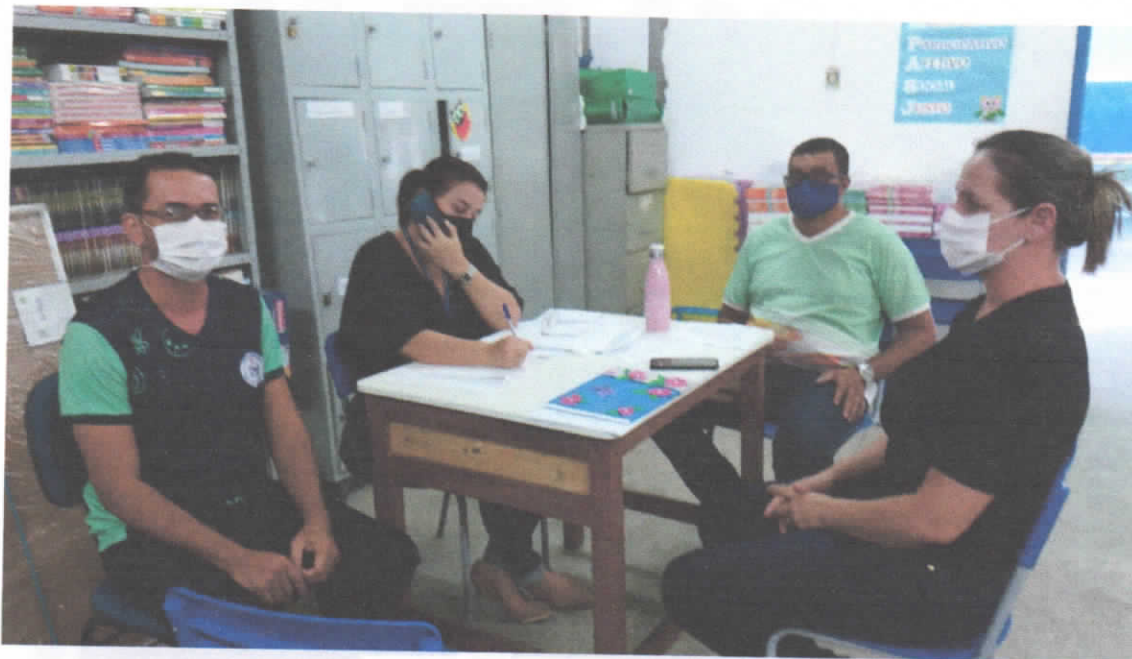
Escola Municipal Prof a Anailde Santos de Jesus.