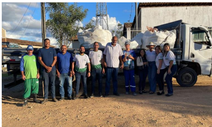
Fotos 08, 09, 10 e 11: Participação no evento Blitz do Campo em parceria com a Secretaria de Agricultura