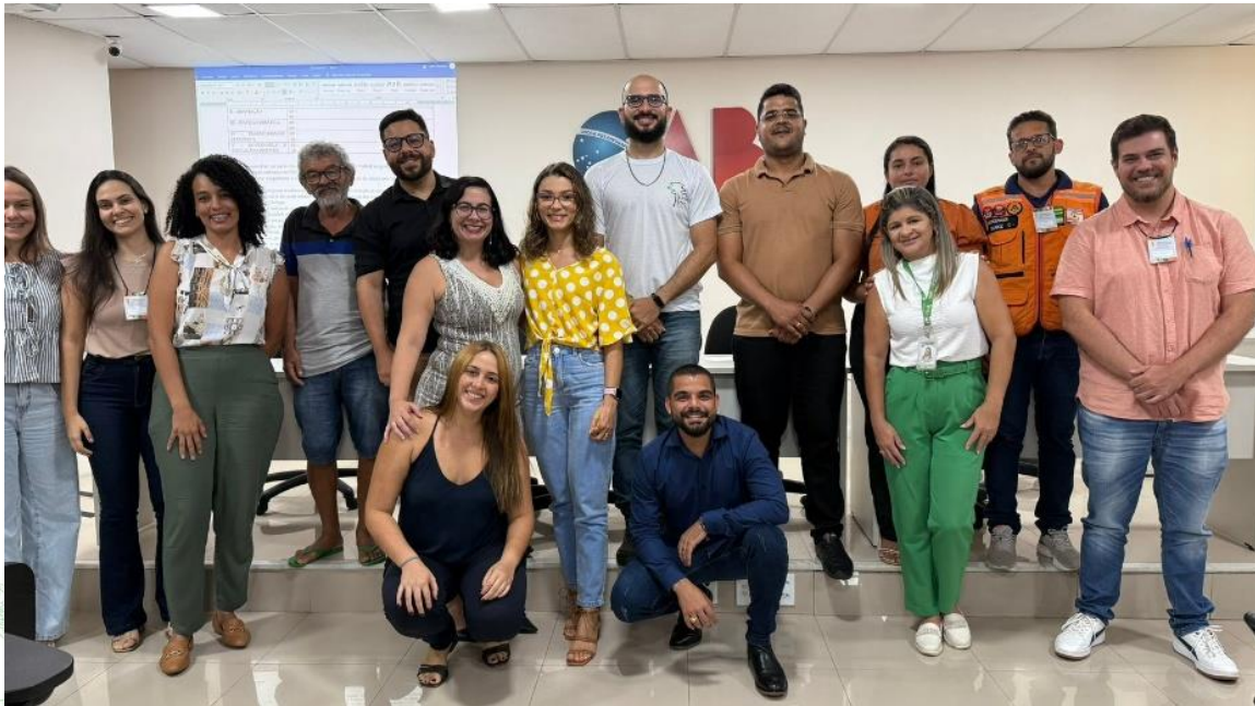
Foto 14: Reunião com representantes do IFS e secretaria da Agricultura